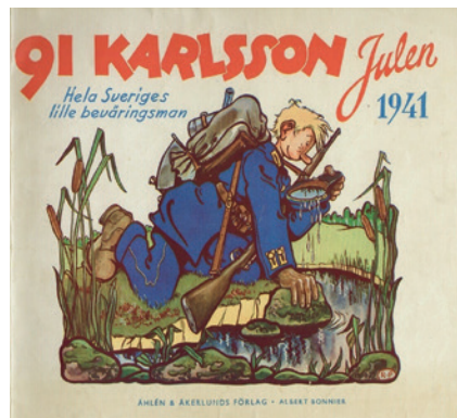
Omslaget till julalbumet 1941.