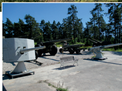
Delar av den tyngre marina materielen är uppställd utomhus. Under hösten 2015 påbörjas en byggnad som beräknas bli färdigställd under 2016.

Under andra världskriget låg en halv miljon svenska män i beredskap i Kalixlinjen. Sten Ekman tar oss i nr 1/2016 till Kalixlinjens museum och berättar om försvarsförberedelsearbetet i östra Norrbotten under andra världskriget och kalla kriget.