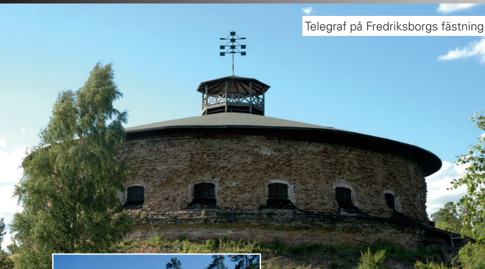
Telegraf på Fredriksborgs fästning.