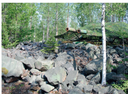
Exteriör bild av två kanoner. Ett av Siknäs batterierna med hela anläggningen i fyra plan insprängd i berget. Två av kanontornen finns kvar i dag.

Vårt försvarsfordonmuseum Arsenalen med en av Europas största samlingar av militärfordon har genom museichefen Stefan Karlsson bidragit med två artiklar. I nr 1/2014 fick vi en ingående artikel om den pågående renoveringen av Sveriges äldsta stridsvagn och nr 2/2016 en redovisning av internationellt utbyte med Tjeckien av militärhistoriska objekt. ■