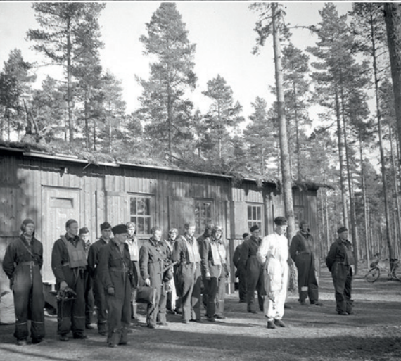
Flygvapenövning 1942 på Brattforsheden.