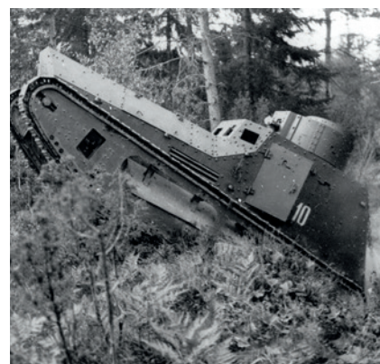
Strv m/21 i sin rätta miljö.