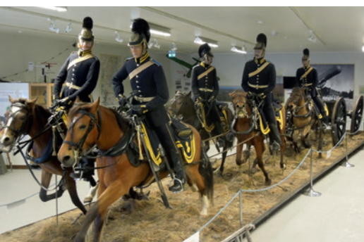
I Artillerihallen finns det fantastiska 6-spannet för ridande artilleri 1850 i skala 1:1.