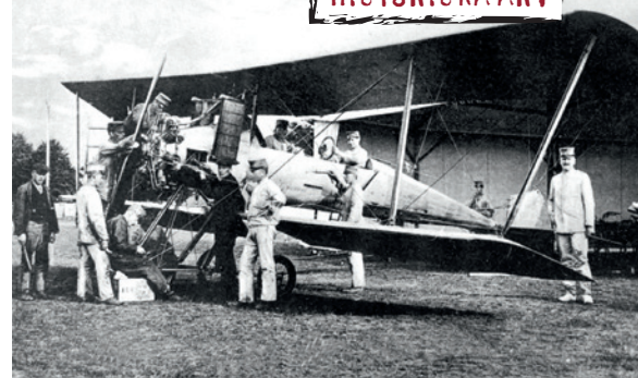
De allra första försöken med militära flygförband i Sverige på Axevalla hed.