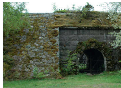
Ingång till Södra fortet på Vaberget.