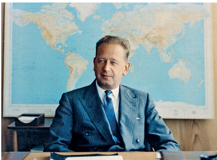
Dag Hammarskjöld - 1959.