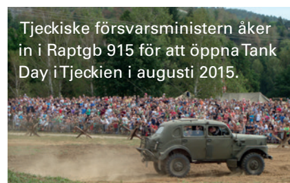
Tjeckiske försvarsministern åker in i Raptgb 915 för att öppna Tank Day i Tjeckien i augusti 2015.