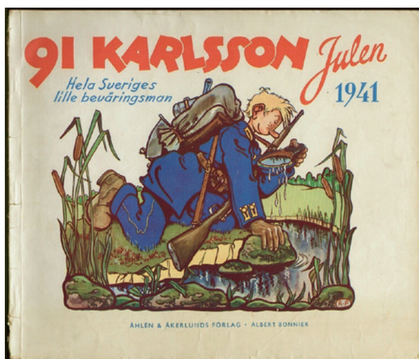
Omslaget till julalbumet 1941.

tidning med fokus på äventyr och med unga män som målgrupp. Den första tiden var serien helt utan pratbubblor, försedda med rimmande text under serierutorna, till en början tänkt att framföras till kända melodier. Texten var oftast författad av den oidentifierade pseudonymen Kadudd. Vid sidan av publiceringen i Levande livet gavs även 91:an ut som julalbum med start 1934. Utgivningen av tidningen fortgår än idag.