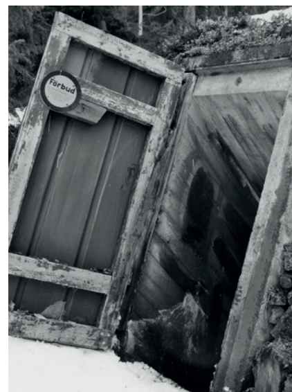
Ingång till skyddsrum.

Om den ena trappan blev blockerad skulle man kunna ta sig ut ändå. Bergrummen är olika stora – ett är gjort för 48 man och ett för 24 man, så många som man kunde vara om man skulle sova i berget. Men om man momentant i en krissituation måste ta skydd kunde man i det större av rummen packa in 200 man. I ett sådant läge räcker inte den friskluftstillförsel som var inbyggd i bergrummet, utan då måste syrenivån ökas med hjälp av syrgastuber. När man kommit ner i rummet möts man av ett förrum med vapenställ och hyllor, då syftet var att man inte skulle bära med sig utrustningen in i bergrummet för utrymmets skull. En primitiv toalettmöjlighet finns nere i berget men sannolikt är att de som hade anledning att vistas i anläggningen kunde gå ut och göra sina behov. Det mindre bergrummet används inte idag men är förberett för att man skall kunna vistas där. Det mindre bergrummet var avsett som uppehållsplats och övernattningsmöjlighet för chefen och hans närmaste medarbetare. Båda bergrummen har