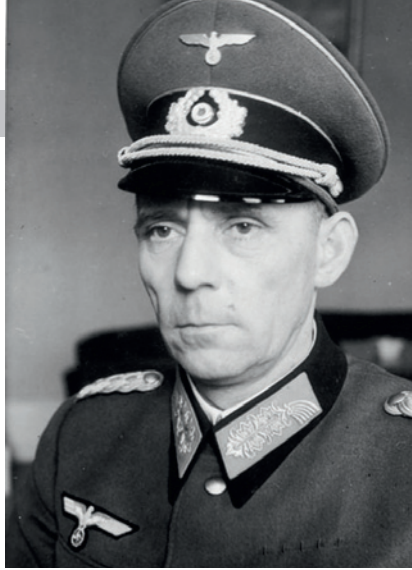
Adolf von Schell.

Senare – efter kriget – fick vi klarhet i att tyskarna hade utarbetat planer för hur en invasion skulle gå till. Redan innan tyskarna invaderade Norge hade man en viss planläggning för en invasion av Sverige, men i början av 1943 fick generalmajoren Adolf von Schell uppdraget att planera för en invasion av vårt land. Schell ville börja med att lamslå det svenska försvaret i Norrland och i första hand slå ut Bodens fästning. Samtidigt skulle man anfälla flyget på Frösön för att slå ut de störbombare som var baserade där för att sedan luftlandsätta trupper för att erövra F 4. Därefter skulle den 25:e pansardivisionen gå från Trondheim och Röros mot Östersund. Det här är uppgifter som svensk militär anade men inte visste. Om man varit på det klara över att tyskarna hade så långt gångna planer hade situationen varit långt mera prekär. De dokument med planer som Schell