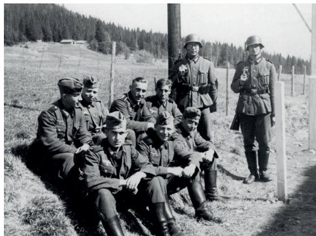
I Gäddede svarade 5:e kompaniet för försvaret. Även här upprättades viss kontakt med tyskarna på andra sidan gränsen. Denna bild är från den norska sidan och visar personalen i den tyska gränsposteringen.