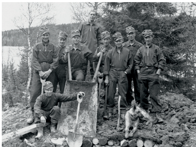
Befästningsarbeten vid Bodsjöedet i maj 1940.