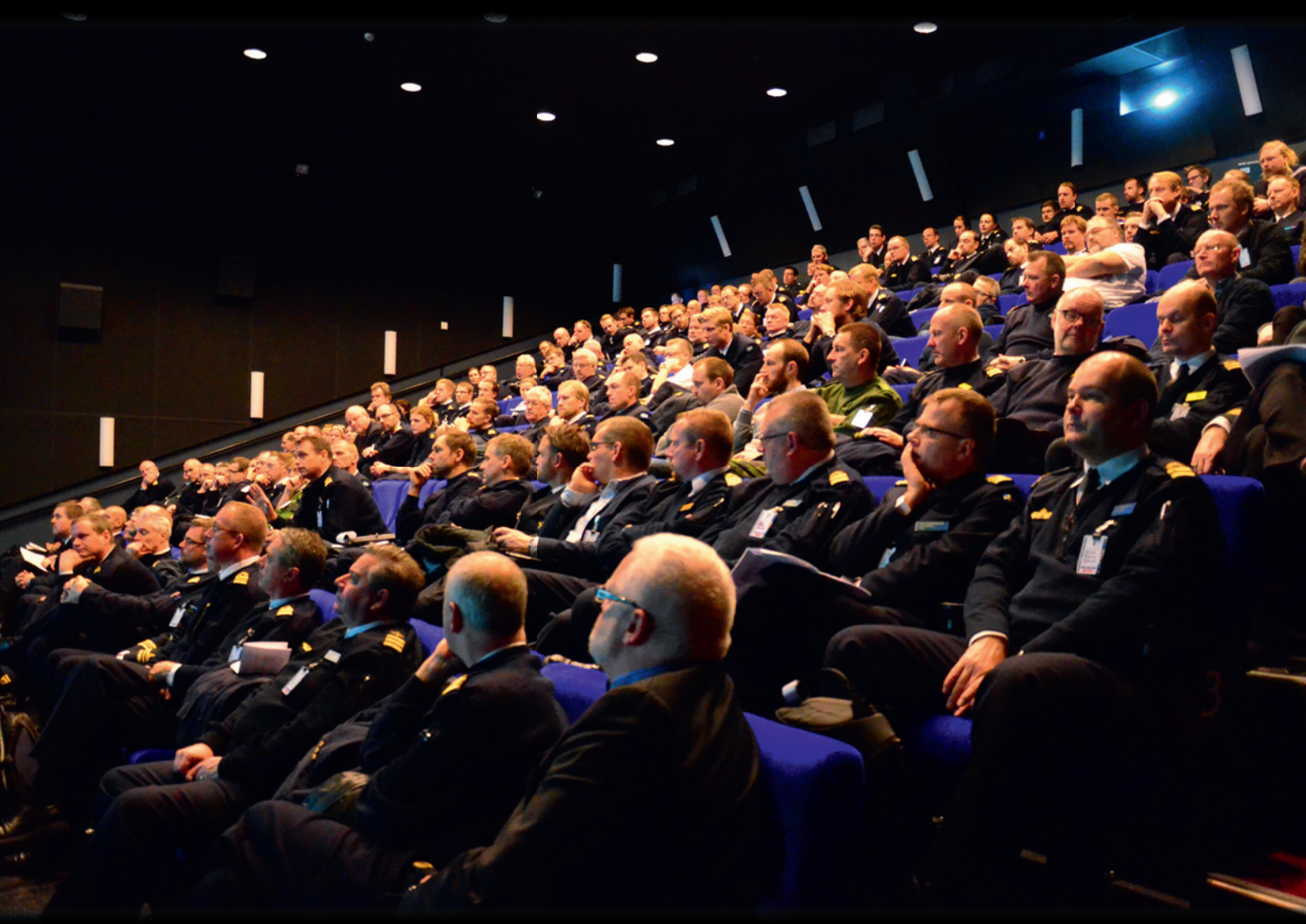
En fylld biografialong deltagare i logistikspåret.

TIFF valde att följa spåret logistik under dag två. I detta spår var det cirka 195 personer som fyllde den biografialong som användes.