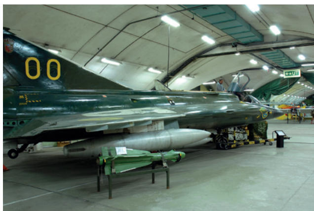
En av Aeroseums J 35 Draken i en av bergtunnlarna.

• Arsenalen – Sveriges Militärfordonsmuseum i Strängnäs öppnade i juni 2011 och har redan haft nästan 20 000 besökare. Här visas samtliga militära fordon i Armémuseums förråd, stridsfordonen från f d Pansarmuseet i Axvall och hjulfordonen från Militärfordonsmuseet i Malmköping i ett av världens största militärfordonsmuseer. Museet visar även f d Södermanlands regemente (I10/P10) och militärmusikens historia (öppnar 2012).