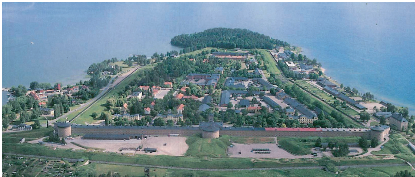
Vy över Karlsborgs fästning. Museet ligger i Slutvärnets mittparti.