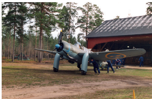
B 17 utanför ett av ladvärnen på Brattforsheden.