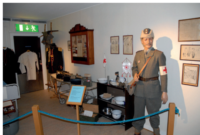
Interiör på Garnisons- och Luftvärnsmuseet.