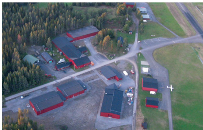
Flygbild över Teknikland i Optand. Det gamla krigsflygfältet till höger i bilden.