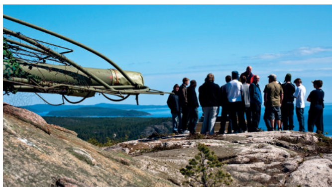
Utsikt från en av tunga batteriets två 12,2 pjäser på Hemsö.