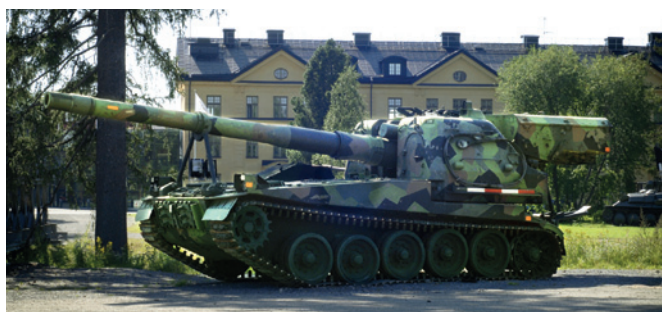
Bandkanon utanför Forsvarsmuseum Boden.