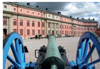
Borggården på Vaxholms kastell.

• Vaxholms fästningsmuseum visar en fästning med anor från 1500-talet som under 400 år fungerat som ett lås mot invasionsföretag mot Stockholm, det fasta kustartilleriet samt Vaxholms kustartilleriregemente (KA1).