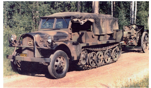
Halvbandtraktor framför 10,5 cm haubits på Artillerimuseet.