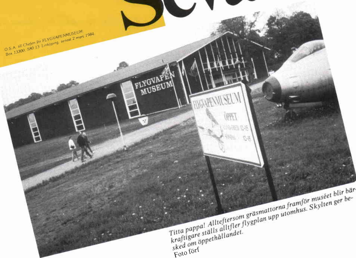
Titta pappa! Allteftersom gräsmattorna framsför museet blir bärkraftigare ställs alltifler flygplan upp utomhus. Skylten ger besked om öppethållandet.

□ Det blev en minnesrik dag, där svensk och internationell flygmateriel från 1912 och framåt glänste ikapp med veteranernas lysande ansikten. En glad fest!