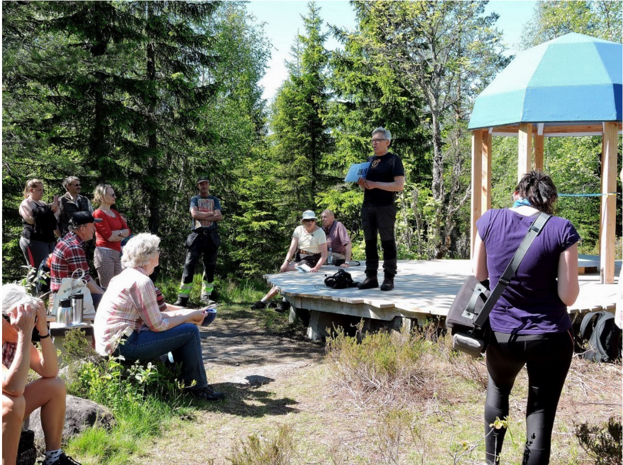
Från invigningen Högsta punkten ingår nu som en del i Bergslagsleden.