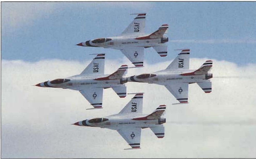
Ett av de mera uppskattade inslagen på Mildenhall var ett framträdande av den amerikanska uppvisningsgruppen Thunderbirds. De flyger sina F-16 med mycket små avstånd mellan planen.