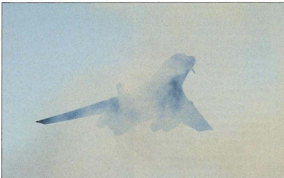
Uppvisningsröken låg understundom tät över Fairford. Här är det en amerikansk B-1B som forcerar röken för att inleda sitt kraftfulla program till ackompanjement av dånande efterbrännkammare.

Piloter och tekniker ur F 4 svarade för den uppmärksammade uppvisningen med JA 37 på RAF Mildenhall. Det var första gången Sverige var med.