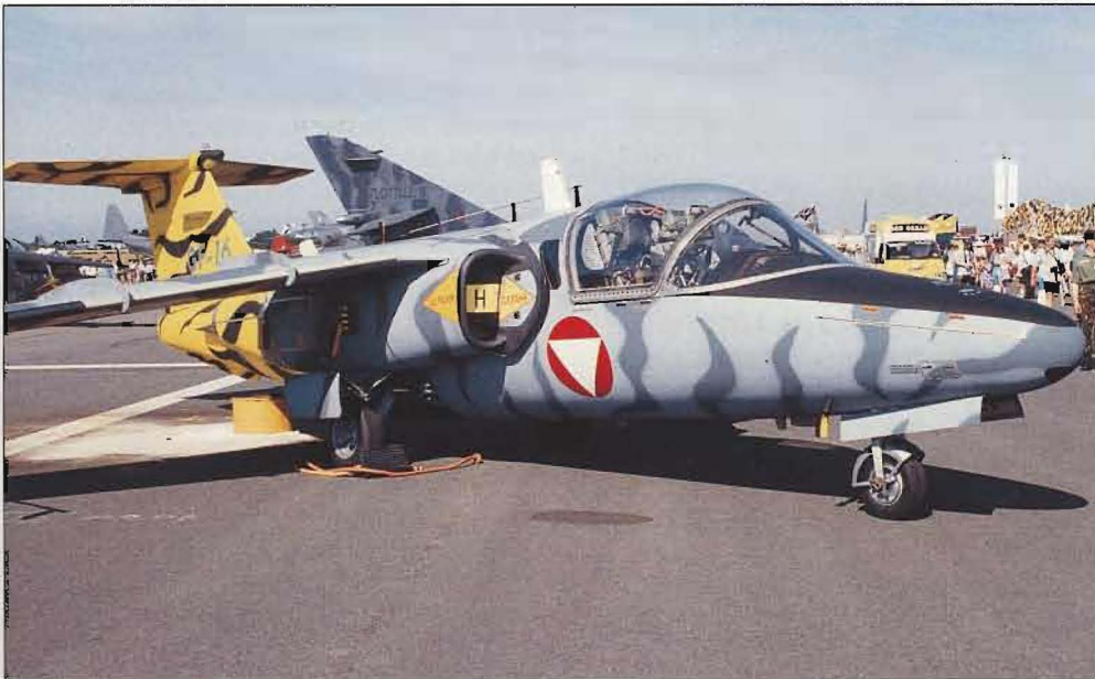
Ett tema i temat var "Tigers". Flera flygdivisioner runt om i Europa och USA har tigern som symbol och vid lämpliga tillfällen träffas dessa divisioner. Här en österrikisk tiger i form av en Saab 105OE.