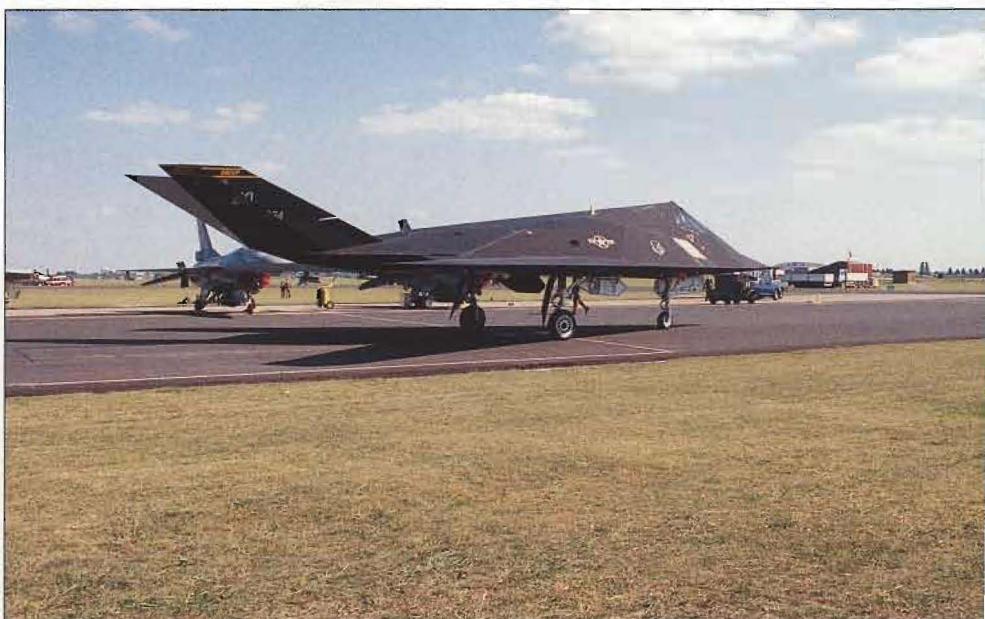
"Smygflygplanet" F-117 gjorde sin egentliga stridsdebut under Gulfkriget och är numera ett ganska vanligt inslag i flygdagar runt om i världen.