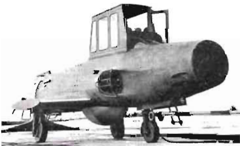
• Alliotalets attacktpl premiärvisad i mockup.