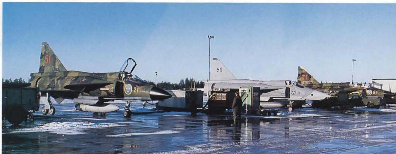
Divisionen Urban Röd vid F 21 i Luleå kommer att flyga med olika versioner av Viggens till och med 2006.

Situationen var inte okomplicerad, för de berörda gällde det bland annat att ta ställning till den privata situationen, ekonomiska villkor, hur länge man skulle vara