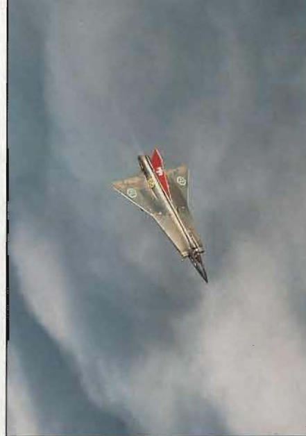
Ovan: Draken-systemet utgår helt från nivå 7.