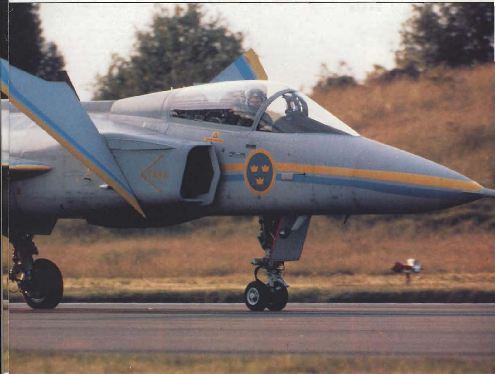
I nivå 10 bromsas JAS 39-projektet upp helt redan nästa år. Gripen ersätts senare med ett färre antal utländska flygplan.

Bassystemet reduceras till 25 bataljoner 1996 och till 16 bataljoner vid sekelskiftet. Bassystemet skall därvid utformas för att främst lösa uppgifter i låga konflikt-nivåer.