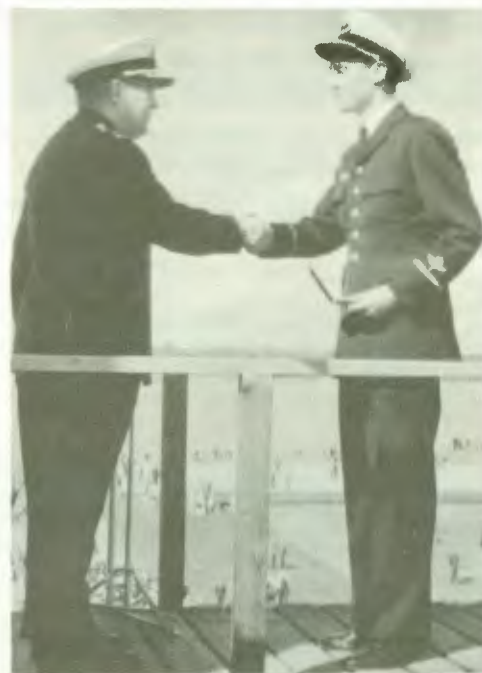
Ovan: Formationsflygning. Nedan: CFV utdelar ST:s guldmedalj.