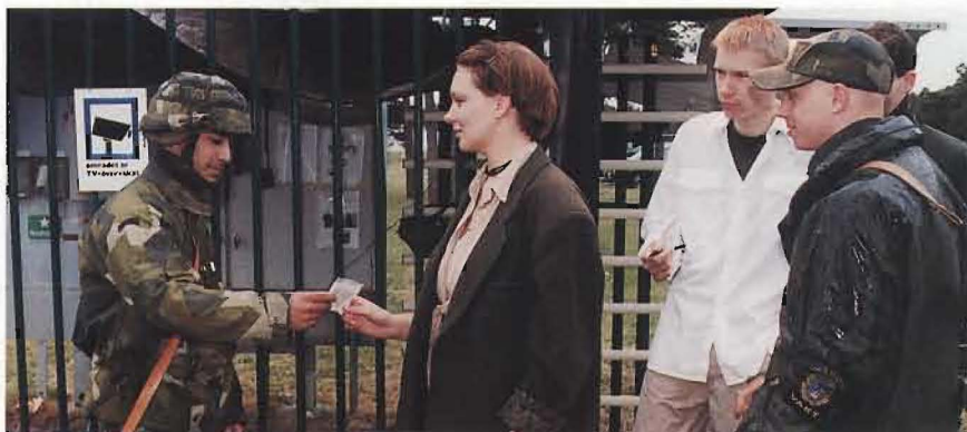
Ett övningsmoment där figuranter spelade rollen som journalister vid inpassering till den svenska campen.

– All kommunikation med utomstående myndigheter och befattningshavare måste ske på ett främmande språk. Här på Gotland samövar vi med olika civila myndigheter och alla kontakter med dem sker på engelska.