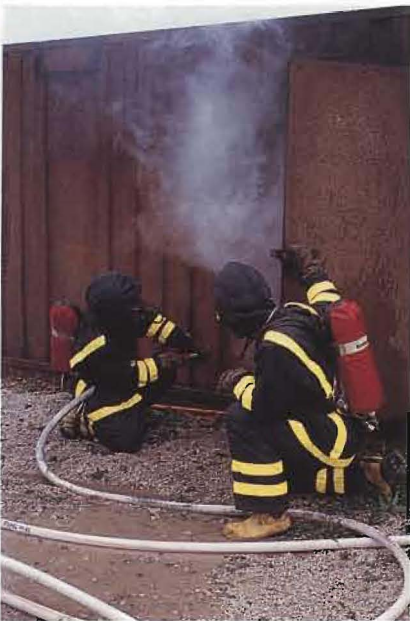
En av de förmågor som värnpliktiga räddningssoldater i en flygbataljon normalt utbildas till är rökdykning. En tillgång även i internationella sammanhang.

Andra exempel på övningshändelser som inträffade var ett spelat haveri där en pilot efter en fågelkollision tvingades hoppa i närheten av, men ändå utanför, flygfältet som var det tilldelade området. Då fick bataljonsledning-