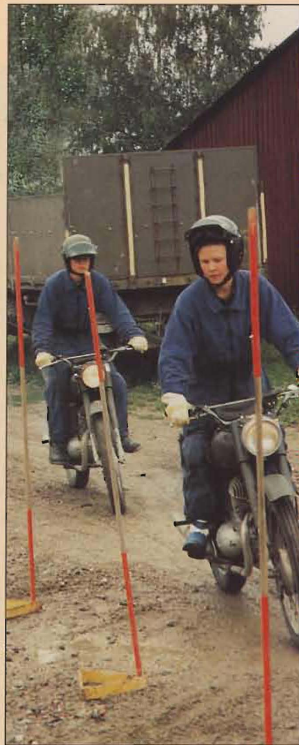
FMCK – MC-ordonnansutbildning.

Skjutverksamheten bedrivs i regel året runt med tillgång till bl a inomhusskjuthallar. Verksamheten omfattar utbildning, träning och tävlingskjutning. Träffpunkt 95 , skyttearrangemangen då "alla" svenskar lär sig vad "skytte" är, äger rum den 20-21 maj. ■