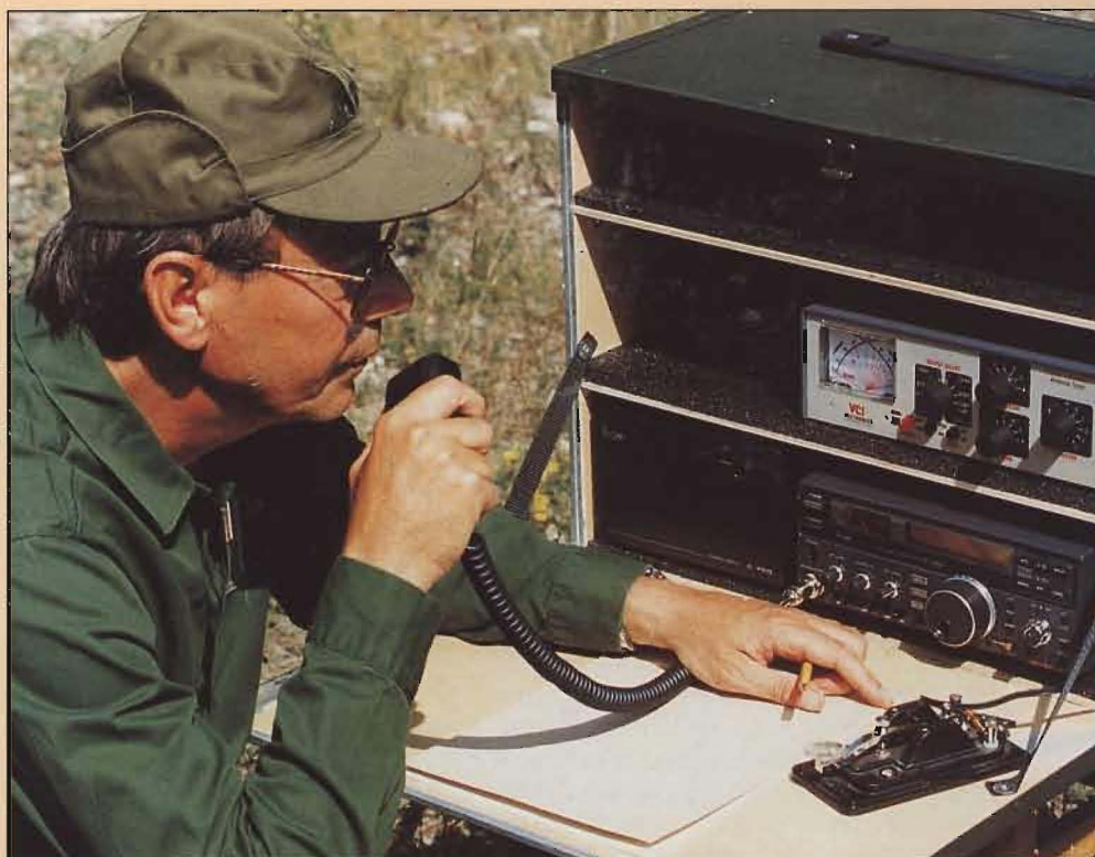
Inför en krigsförbandsövning är en FRO-kurs bra för repetition av t ex telefoni, telegrafi eller nyare sambandsmateriel.