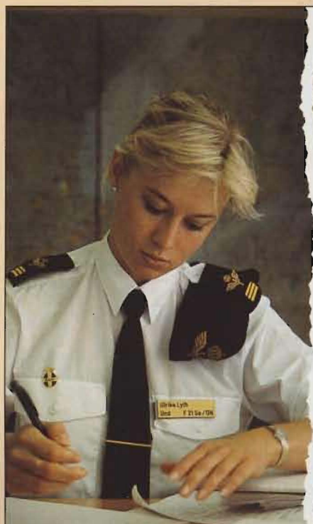
Underrättelselotta formulerar rapport.

Vilka är de frivilliga försvarsorganisationerna och vad har de för verksamhet? Här lämnas en kort information om några av frivilligorganisationerna och deras respektive verksamhetsområden.