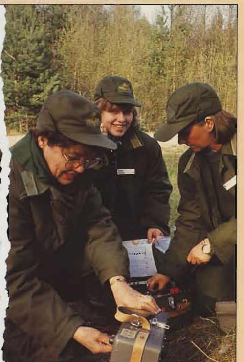
Lottor under patrullfälttävlan. ▶