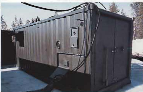
Fototolkarna i SWAFRAP AJS37 har utbildats under våren. Framkallning av film och tolkning av flygspaningsbilderna sker numera i containern. På bilden till höger plundras en Viggen på filmkassetterna.