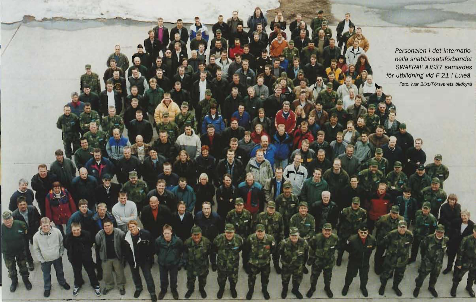
Personalen i det internationella snabbinsatsförbandet SWAFRAP AJS37 samlades för utbildning vid F 21 i Luleå.