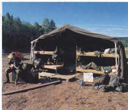
Under verifieringsövningen i Borlänge provades att förlägga delar av personalen i tält med tolv våningssängar vardera.