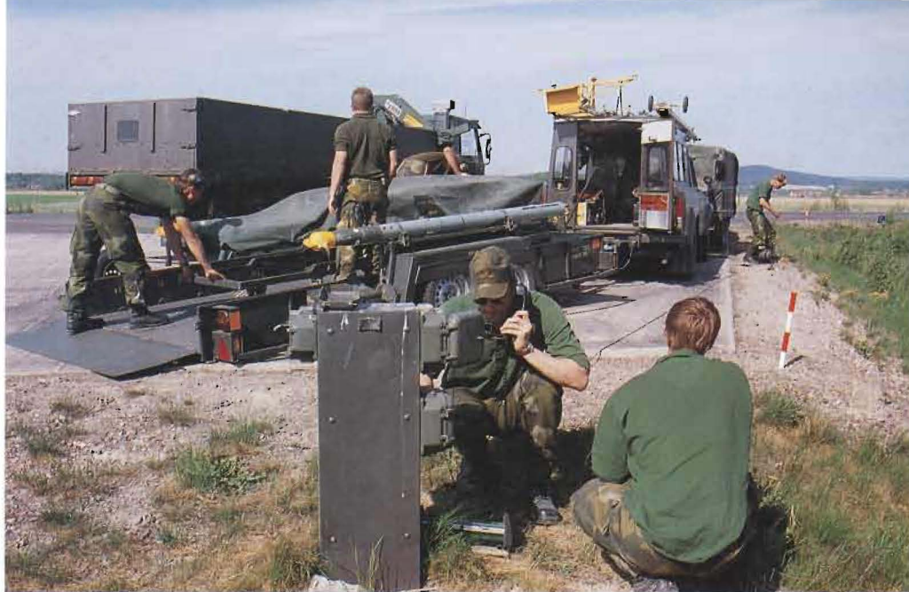
En klargöringstropp förbereder sig för att kunna klargöra en Gripen för ett nytt uppdrag.

Införandet av Flygbasbataljon 04 påbörjas under 2001. Ny materiel, som måste tillföras under de närmaste åren för att vi ska kunna uppnå de förmågor vi ansatt, kommer att tillföras förbanden.