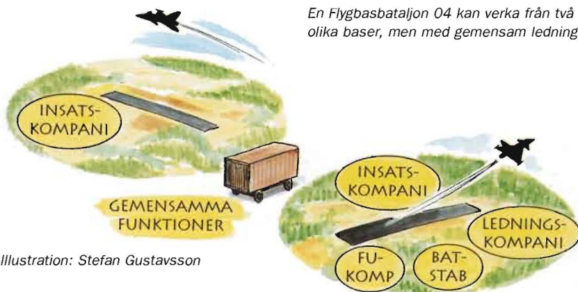
En Flygbasbataljon 04 kan verka från två olika baser, men med gemensam ledning.

Utvecklingen av informationssystem är en förutsättning för att medge en framtida flexibilitet. Det enda krav som ställs på infrastrukturen är möjligheten att kunna landa ett flygplan.