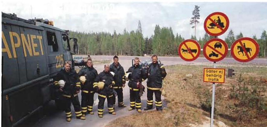
I Flygbasbataljon 04 ingår en egen räddningsstyrka