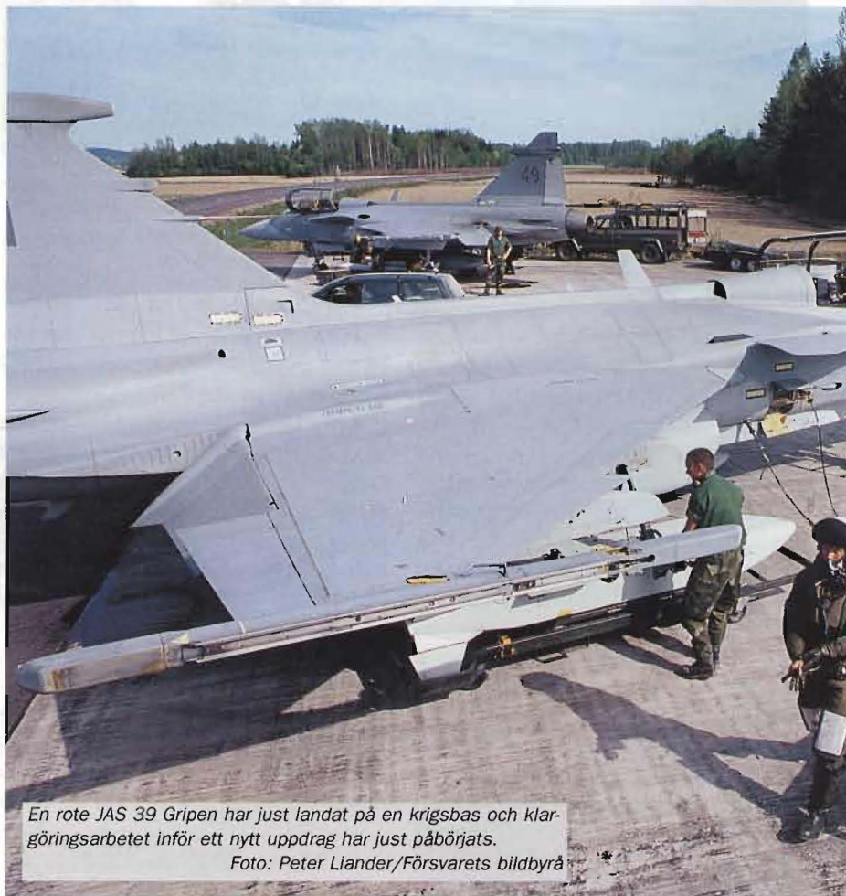
En rote JAS 39 Gripen har just landat på en krigsbas och klaringsarbetet inför ett nytt uppdrag har just påbörjats.