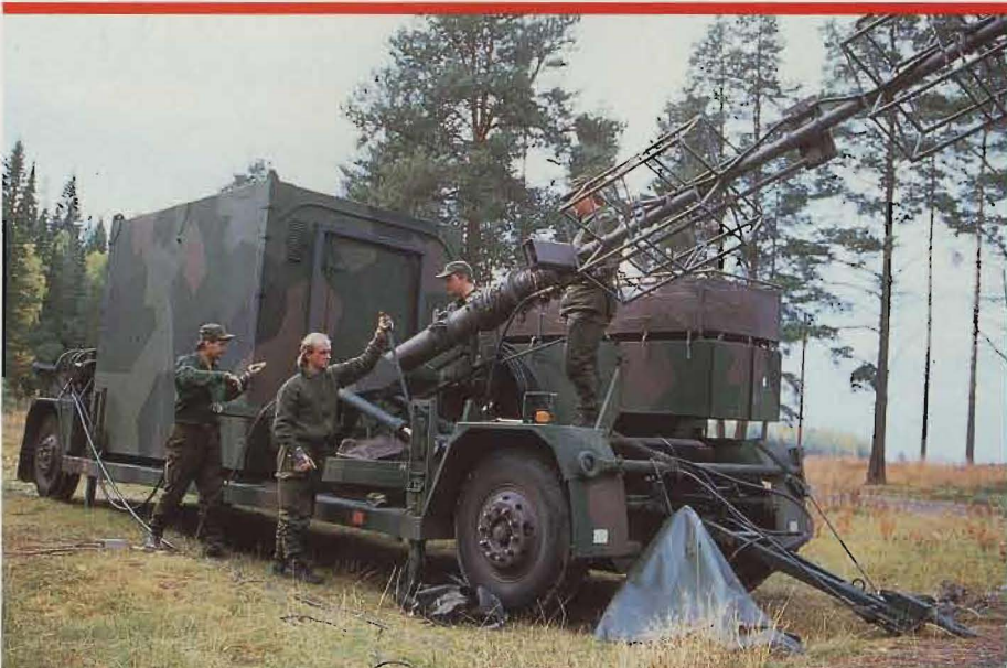
Sambandstjänsten har transportabel materiel till föfogande. Här upprättandegrupp i verksamhet.