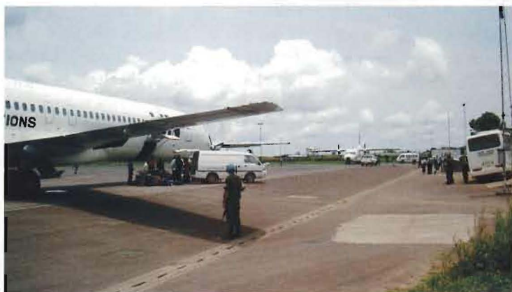
Flygplatsen i Kindu trafikeras av en mängd olika flygplanstyper, Boeing 727, Casa 212, Il-76 m fl.