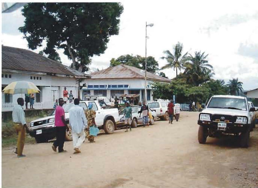
Gatumiljö i staden Kindu, där det svenska flygplatsförbandet kommer att verka.