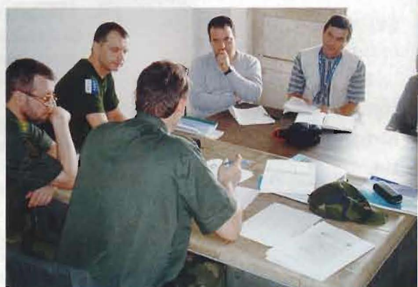
Personal ur en svensk rekognoseringsgrupp i samtal med FN-personal i Kindu.