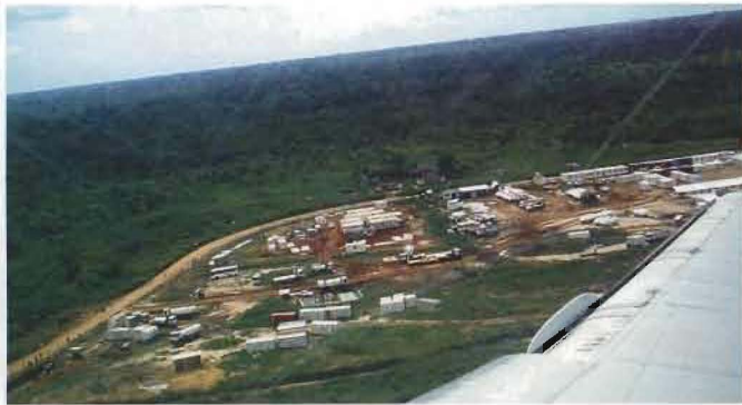
Vy över FN-campen vid Kindu flygplats.