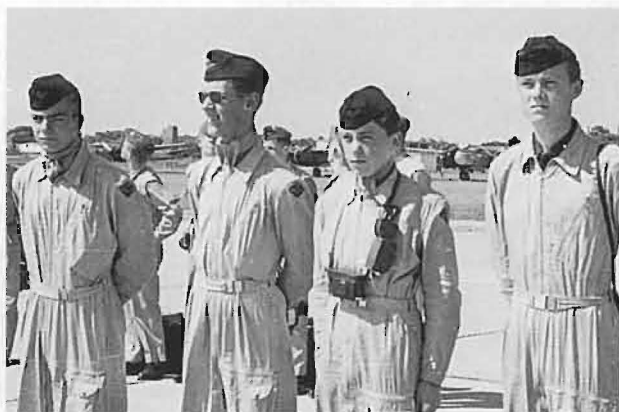
Svenska flygpojkar uppställda under ett utbytesbesök i USA. Året var 1957.

De 50 åren med svenskt IACE-deltagande kommer naturligtvis också att uppmärksammas på något sätt under jubileumsåret. Rekryteringscentrum har tillsatt en arbetsgrupp som jobbar med projektet.