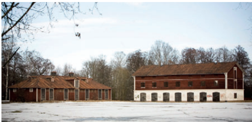
De ursprungliga byggnaderna (skidförrådet och vagnsförrådet innan renoveringen).

Strax söder om Kasernhöjden, mellan E18 och Klarälven ligger de byggnader som från och med den 1 juni 2013 ska innehålla Brigadmuseum. Det lägre en och en halv våningshuset kallas för skidförrådet och det högre trevåningshuset be-