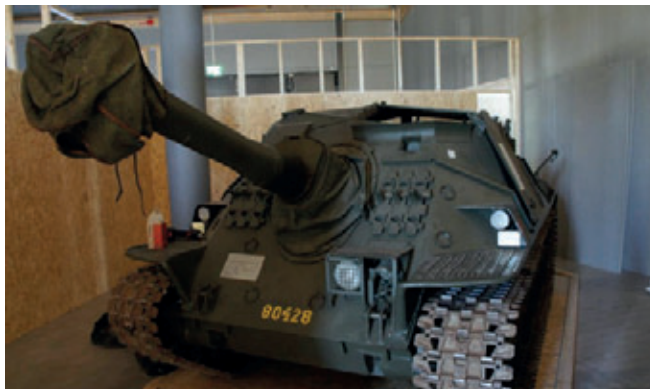
IKV:n på plats i rummet om svensk försvarsindustri.

Sedan dess har mycket hänt. Föreningen FSIV har expanderat både när det gäller antalet medlemmar och den verksamhet föreningen bedriver. I början av 2009 tog synopsarbetet verklig fart med utgångspunkt i de riktlinjer som SMHA utdelat, nämligen att: