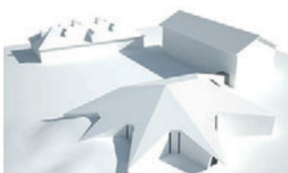
Skiss från arkitekten Murman.

Under sensommaren 2012 stod ännu en byggnad klar mitt emot skidförrådet. Den nya spektakulära byggnaden väcker uppmärksamhet och har ett attraktionsvärde i sig. Huset som är ritat av Murman Arkitekter har förutsättningar att