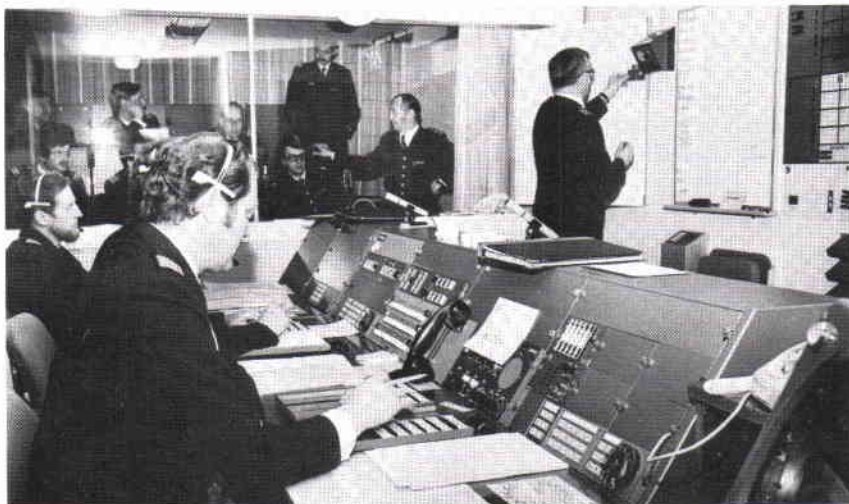
Spelanläggningens kommandocentral i BBS, Basbefälsskolan.