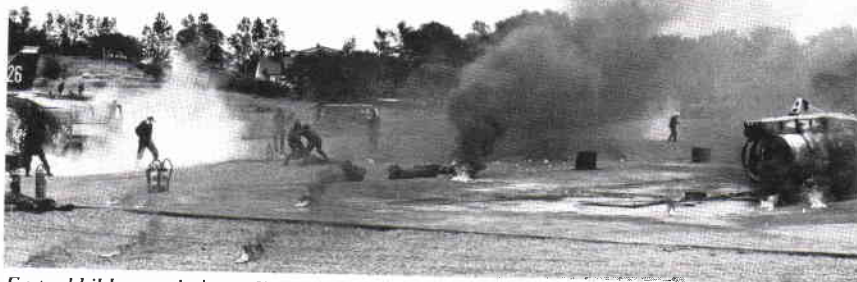
En tankbil har exploderat. Enheten för brandförvars- och räddningsutbildning övar på F14.