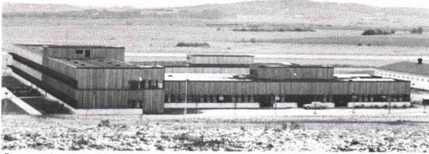
Den nya skolbyggnaden med basbefälsskolan, BBS, och Flygmaterielskolan, FFS.

omfattande utbildningsverksamhet, till sin huvuddel förlagd vid skolorna här, men delvis också med kurser vid flottiljerna eller annorstädes. Vi redovisar nu 3 200 elever i 250 kurser på ett verksamhetsår, dels i kurser för civil personal och dels för militärer, allt fördelat på våra fyra skolenheter. Är man road av statistik kan man lätt räkna ut att det blir i stort en kursstart per arbetsdag.