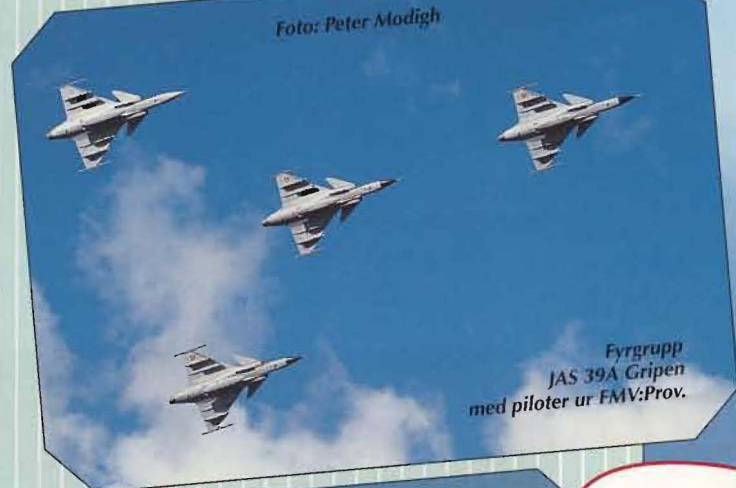
Fyrgrupp JAS 39A Gripen med piloter ur FMV:Prov.