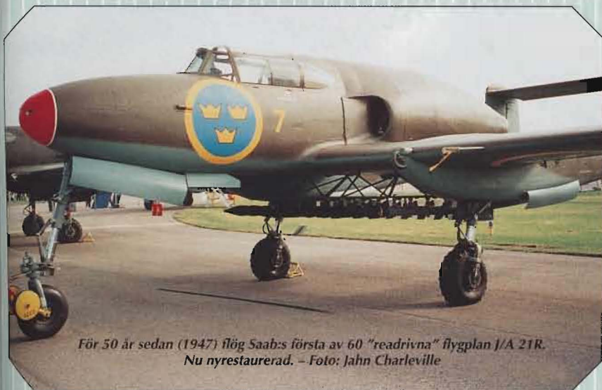
För 50 år sedan (1947) flög Saab:s första av 60 "readrivna" flygplan J/A 21R. Nu nyrestaurerad.