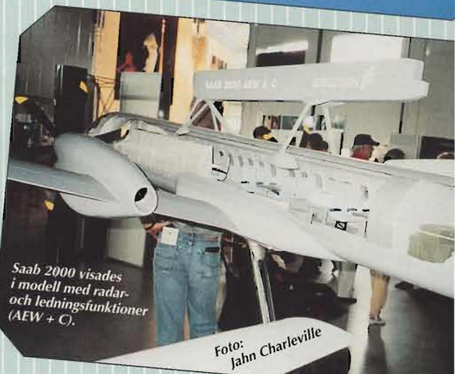
Saab 2000 visades i modell med radar- och ledningsfunktioner (AEW + C).