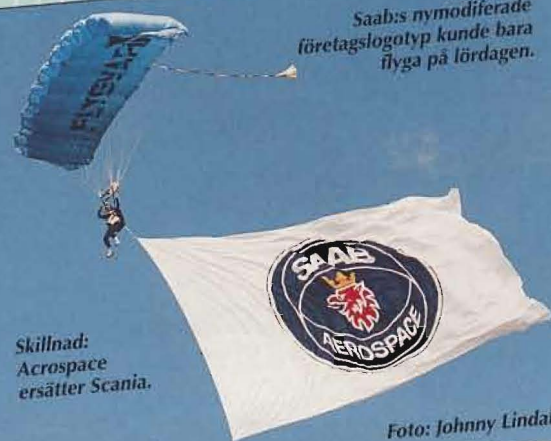
Skillnad: Acrospace ersätter Scania.

Saab:s nymodifierade företagslogotyp kunde bara flyga på lördagen.