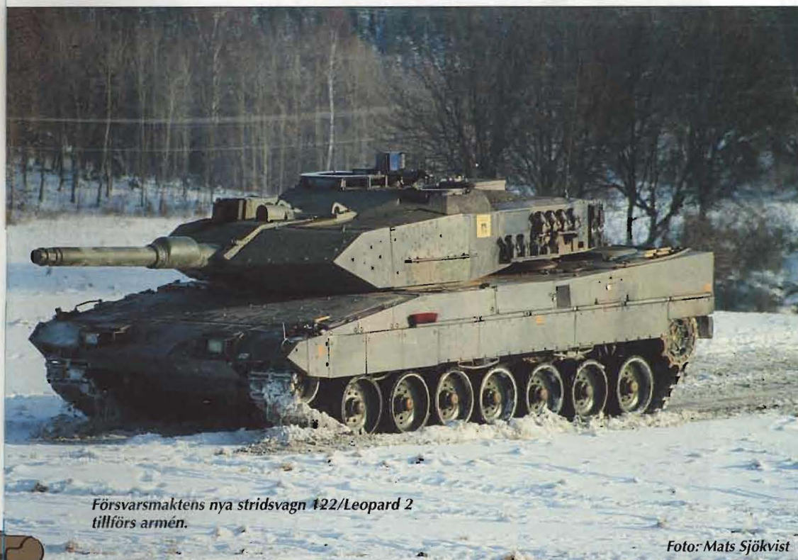
Försvarsmaktens nya stridsvagn 122/Leopard 2 tillförs armén.

► Försvarsmakten har enligt UTFÖR inte integrerats utan mycket av försvarsgrensindelningen och -kulturen lever kvar , vilket försvårat genomförande och lett till suboptimeringar. UTFÖR föreslår en ►