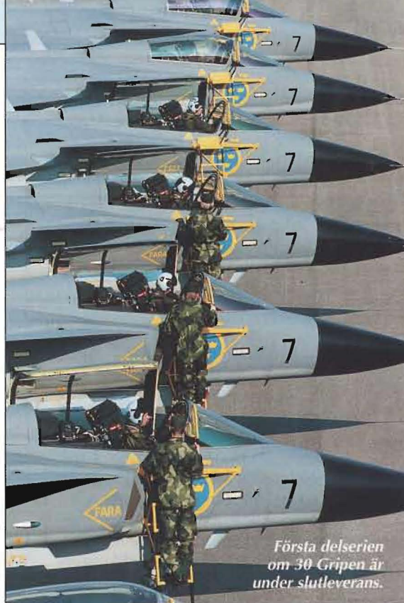
Första delserien om 30 Gripen är under slutleverans.

Totalförsvarets resurser skall även kunna användas för fredsfrämjande verksamhet