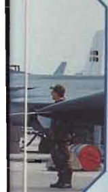
T v: I fjärde generationens flygvapen ingår bl a S 100B Argus, JAS 39A och B.