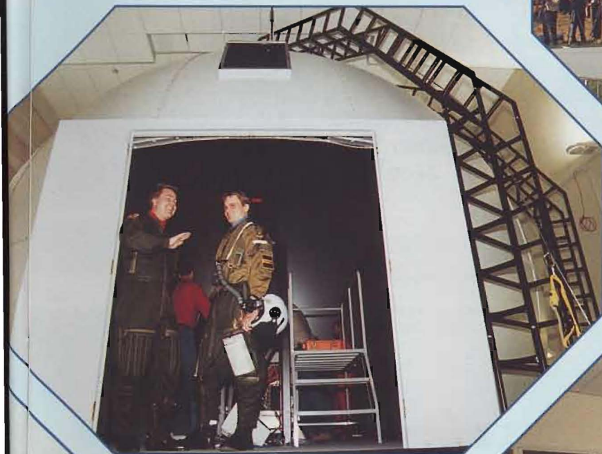
Ovan: Entrén till en av domesimulatorerna.