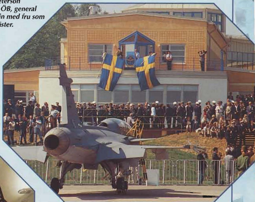
Ovan: Huvudaktörerna invigningsdagen: Gripen- centrum, den internationella gästskaran och flyg- plan Gripen.