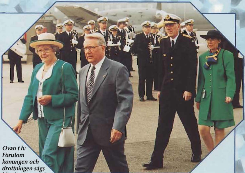
Ovan t h: Förutom konungen och drottningen sågs bl a försvarsminis- ter Tage G Peterson med fru och ÖB, general Owe Wiktorin med fru som invigningsgäster.