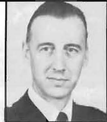
C FS Generalmajor Evert Båge