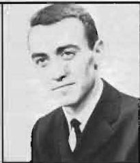
C FS 1 Överste Rolf Clementson