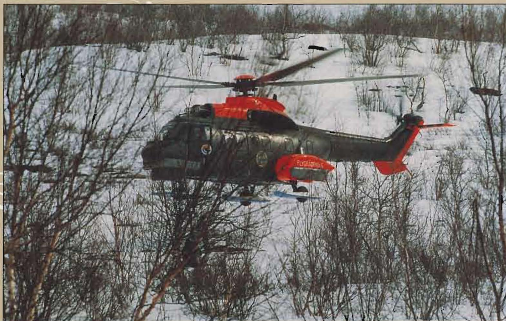
HKP 10 under räddningsuppdrag i fjällterräng.