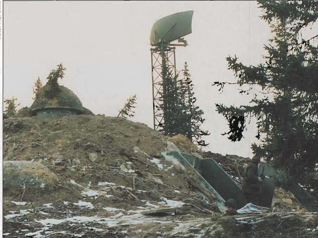
PS-870 med fortifikatoriskt skydd.

hålls under en övergångsperiod av den nya Viggen-versionen SK 37E. På sikt skall denna förmåga finnas i Gripen.