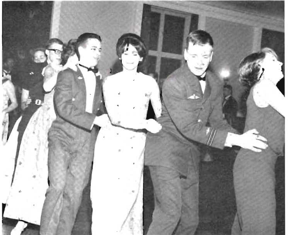
"En liten jenka i Balders hage dansar..." — Verkligen nordisk "förbrödring" blev det på F20, då norska och danska kadetter trädde dansen med söta svenska tjejer till tonerna av finsk musik.