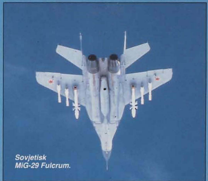
Sovjetisk MiG-29 Fulcrum.