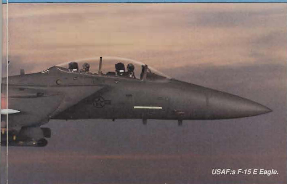
USAF:s F-15 E Eagle.

Beträffande flygstyrkrafter regleras antalet stridsflygplan och attackhelikoptrar inom hela tillämpningsområdet (ATTU). Någon regional fördelning i zoner i likhet med vad som gäl-