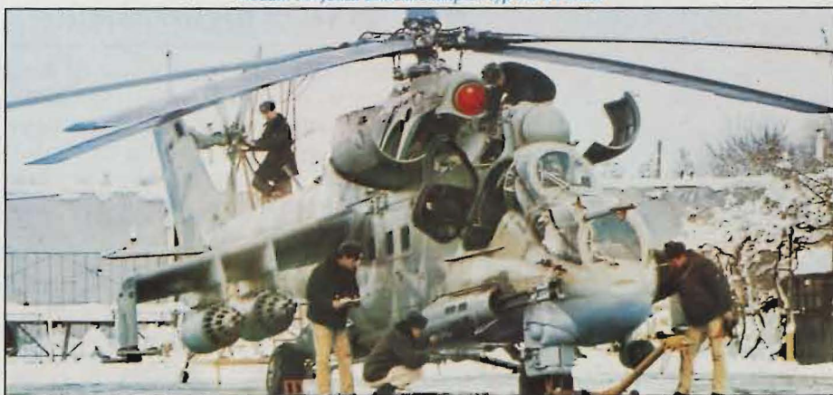
Nedan: Sovjetisk attackhelikopter typ Mi-24 Hind.

Här skisserade slutsatser m m förutsätter att förhandlingsklimatet mellan Öst och Väst fortsätter samt att tillbakadragningarna inte störs. Det viktigaste är att stormakterna – främst USA och Sovjetunionen – inte finner några förevändningar för att inte ratificera och genomföra avtalet enligt dess syften. ■