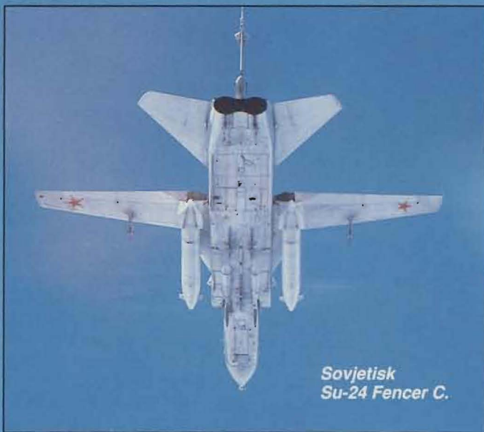
Sovjetisk Su-24 Fencer C.