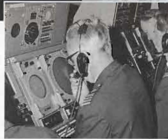
Överste Gert Stangenberg var med om uppbyggnaden av luftförsvarscentralen Puman. Till vänster ses han i aktion på 1960-talet.