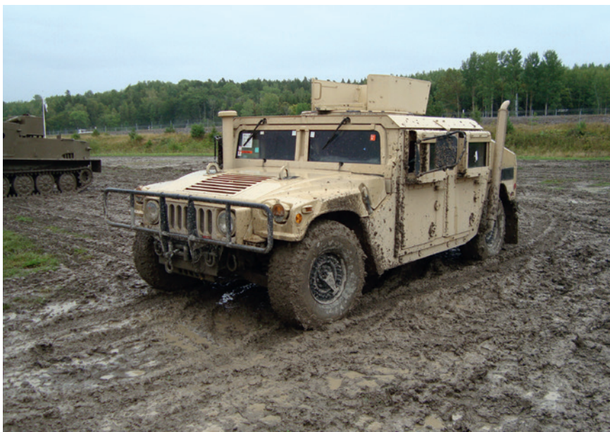
HMMWV 1151 A1 efter att ha visats upp på Arsenalens uppvisning i september 2015.

första anfallsvåg med marininfanteri mot sydsverige. OT 62 har ett rymligt transportutrymme med plats för 16 soldater. Den är fullt amfibisk med vattenjet som suger in vattnet under vagnen och pressar ut det genom luckor längst bak. Hastigheten i vatten är 11 km/h och räckvidden i vatten är 15 mil.