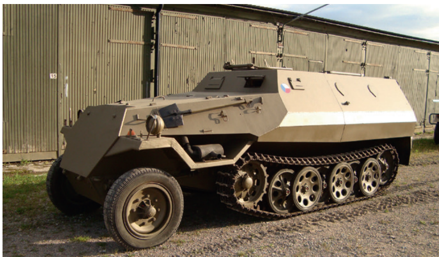
Vissa OT 810 fanns kvar i tjänst fram till mitten av 1990-talet och kan på så sätt jämföras med våra KP-bilar.

Bland fordonen märks en GAZ 69 i radiutförande, en GAZ 71 GTSM, en OT 810 stridsledningsversion, en OT 62 stridsledningsversion och en HMMWV M1151 A1.