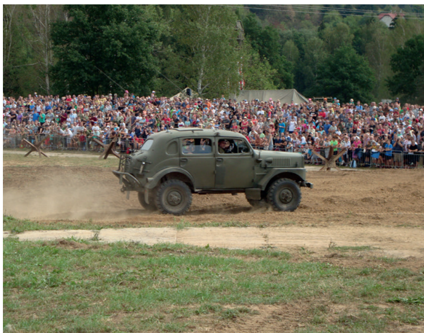
Tjeckiske försvarsministern åker in i Raptgb 915 för att öppna Tank Day i Tjeckien i augusti 2015.

Svenska försvaret har även haft en del kanoner som tillverkats av Skoda