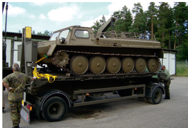
GAZ 71 GTSM är en fordonstyp som inte varit speciellt vanlig i väst, men helt enkelt är en lastbil på band. Dessa transport- och dragfordon fanns i många olika varianter och storlekar från 5 ton upp till över 20 ton. Museets exemplar tillverkades 1980.