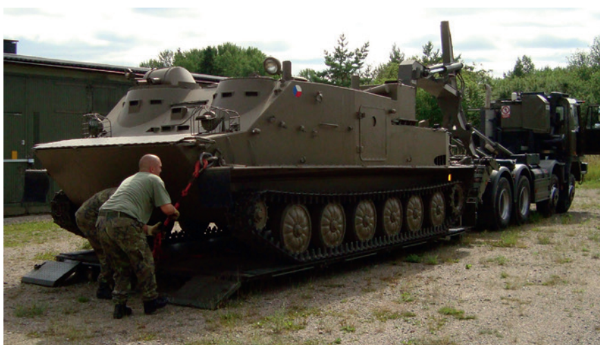
OT 62 lastas av på Arsenalen i Strängnäs.

OT 810 är väldigt intressant eftersom den är en nyproduktion av halvbandvagnen Sdkfz 251 som användes av tyska förband under andra världskriget. För att efter kriget snabbt få fram ett splitter-skyddat trupptransportfordon till den tjeckiska armén återupptog man produktionen i slutet av 1950-talet, men då med en Tatra dieselmotor, andra band, tak och en del andra ändringar. Det finns bara ett fåtal OT 810 i originalutförande kvar, de allra flesta har byggts om för att efterlikna föregångaren Sdkfz 251, men museets exemplar kommer att behållas i sitt tjeckiska utförande. En avslöjande detalj är luftintagen på höger sida som visar att det är ett ledningsfordon – på insidan sitter en låda i vilken det sitter ett elverk.