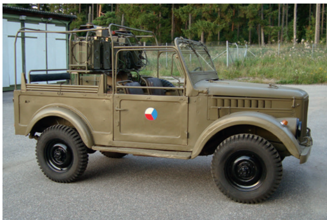
GAZ 69 är öststaternas motsvarighet till exempelvis Terrängbil 903 och andra västproducerade lätta terrängbilar från 1950-talet.