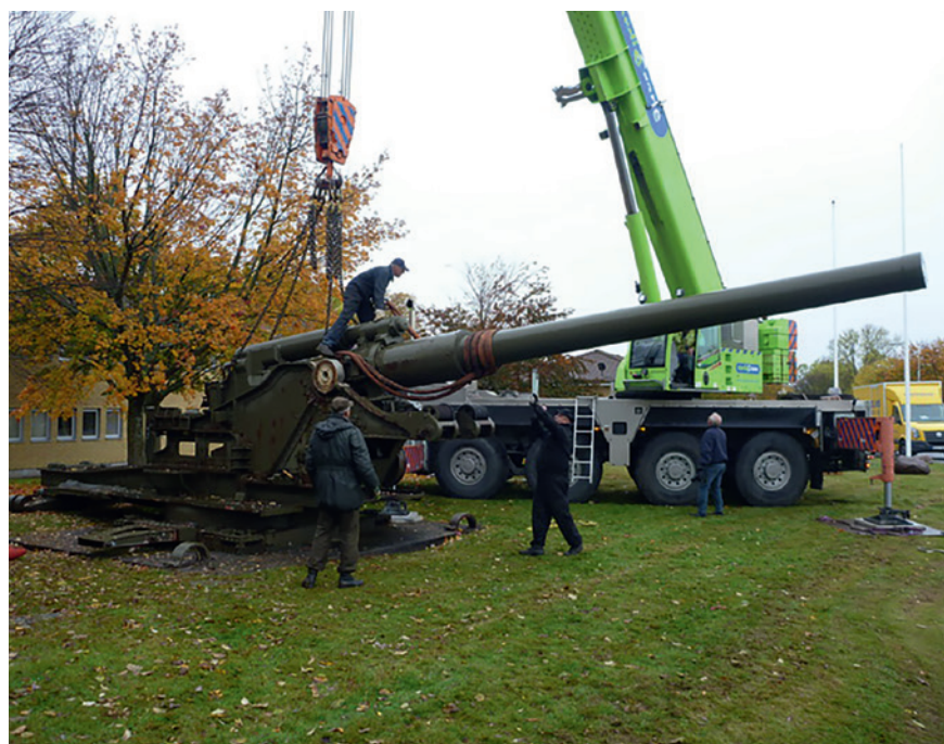
21 cm Skoda m/42 lastas i Göteborg. Den ca 40 ton tunga pjäsen kunde monteras isär med hjälp av erfaren (pensionerad) personal som hade lånats in.

Det enda föremålet som föranledde en viss diskussion var den 21 cm KA-pjäsen som stod som monument på nedlagda KA 4 i Göteborg. Pjä-