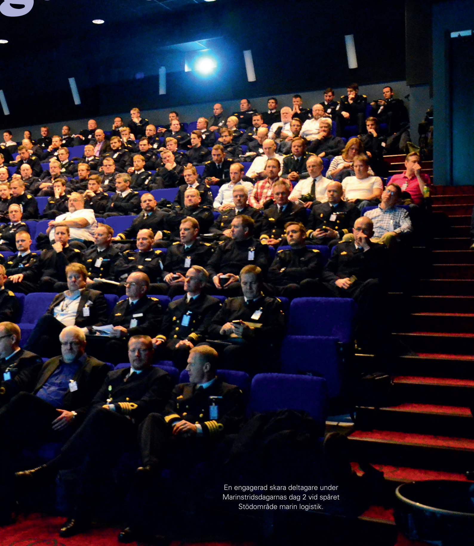
En engagerad skara deltagare under Marinstridsdagarnas dag 2 vid spåret Stödområde marin logistik.