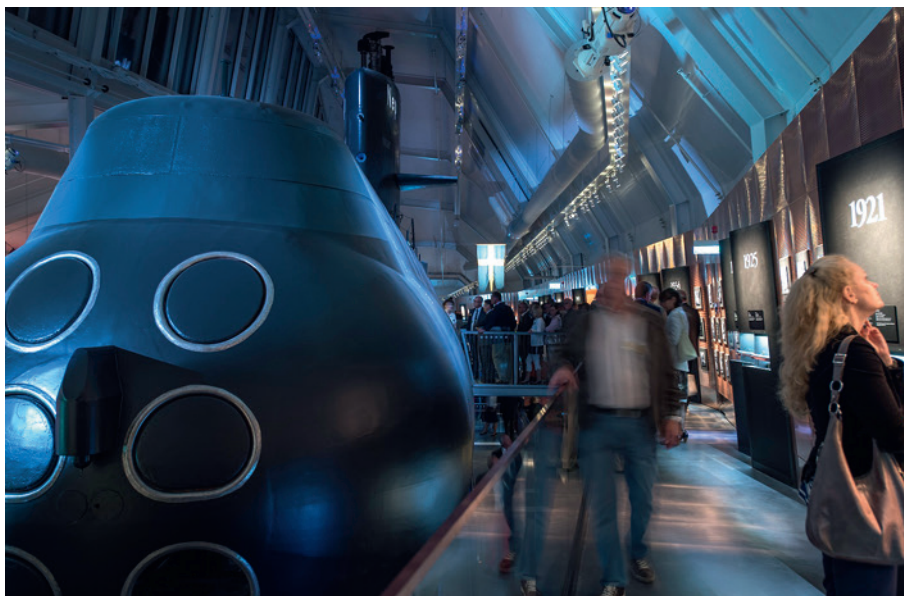
HMS Neptun med HMS Ulvens flagga i bakgrunden.

ombord. I utställningen kan både barn och vuxna testa sig fram i prova-på-stationer eller lära sig mer om ubåtarnas speciella miljö och egenskaper. Något som lämnar ett djupt intryck är ubåten Ulvens örlogsflagga som hänger uppspänd på en wire från Neptuns torn, det är den örlogsflagga vilken bärgades av dykaren som identifierade Ulven på botten och tog med sig flaggan upp som ett bevis på att svensk ubåt var identifierad.