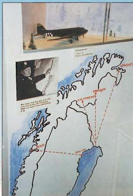
Bilden visar de router Balchens Dakotor bl a företog.

ningar. Ledare och organisatör var även här Bernt Balchen.