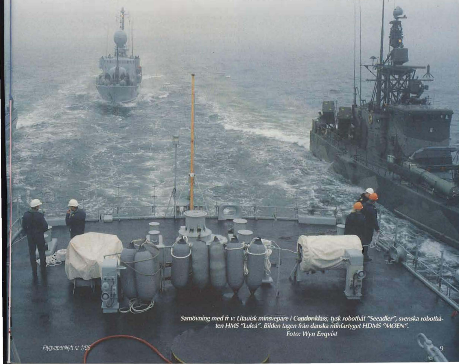
Samövning med fr v: Litauisk minsvepare i Condor-klass, tysk robotbåt "Seeadler", svenska robotbåten HMS "Luleå". Bilden tagen från danska minfartyget HDMS "MØEN".

I transportflygdelen deltog en C-160 Transall från Tyskland, en C-130 Hercules från Danmark och vår svenska TP 84 ur F 7. Övningen omfattade fällning av förnödenheter, "Air Drop", ►