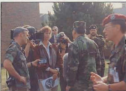
Internationell mediebevakning – intervju med SACEUR:s general G. Joulwan.

T h: Våra två Hercules-besättningar (ur F 7) blev svensk-historiska i PFF-sammanhang.