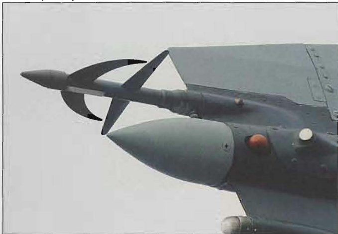
Detta är den polska MiG-23:ans fenspets. Överst ("spetssharpnen"): En antenn för närnavigeringssystem, RSBN; (liknas vid TACAN/ILS dvs Tactical Air Navigation/Instrument Landing System). – Konen nedanför: Antenn för transpondersystem. – Vita fläck- en därbakom: Radar- varningssystem. – Knoppen längst ned: Navigeringsljus.

tannien, två F-15E Strike Eagle från USA/Lakenheath samt två F-16 Fighting Falcon från Danmark. Flygmålen utgjordes av danska F-16 och T-17 (SAAB Supporter). Övningen omfattade för jaktdelen upprätthållande av en "No Fly Zone", NFZ, samt skydd av en "Safe Area", SA. Detta genomfördes genom att jaktflyg leddes in mot mål inom NFZ för att identifiera och eventuellt skugga målflygplanen. Avvisning eller vapeninsats har inte övats. Skydd av SA har genomförts som "Force Demonstration", dvs över-