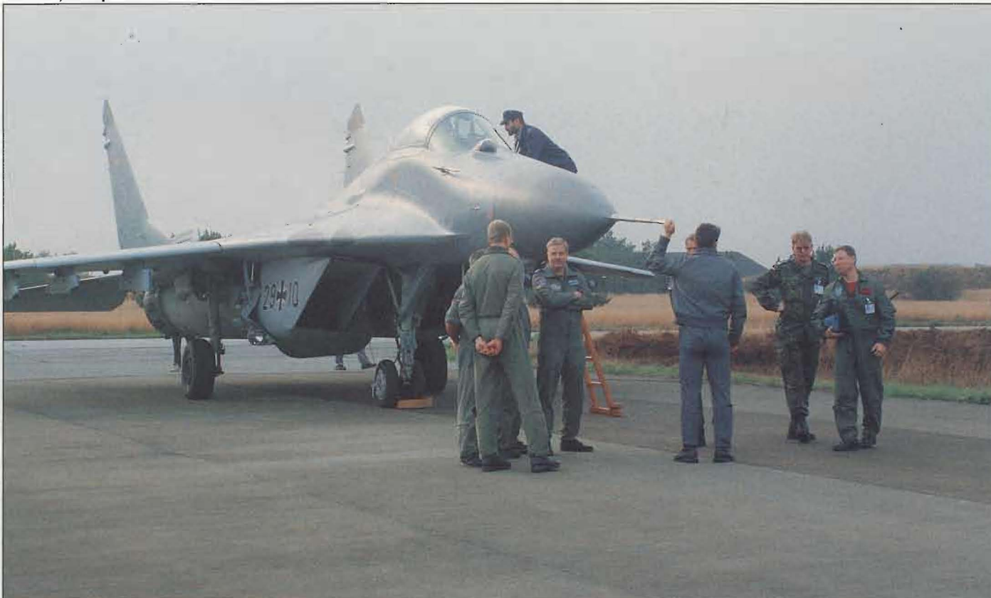
Tyska Luftwaffe deltog med en av sina från DDR övertagna MiG-29 Fulcrum. Väckte de flesta piloters stora intresse.

Då det dessutom var första gången som partnationsers flyg skulle delta i en övning med NATO-flyg kom flygsäkerhetsaspekter att dominea processen. Uppgiften att planera och genomföra övningen för flygvapnets räkning gavs till Flygvapnets Taktiska Centrum, FTC. Inledningsvis planerades för svenskt deltagande med två JA 37 Jaktviggen, en TP 84 Hercules och en HKP 10 Super Puma för att täcka alla delar av flygövningen. Regeringen beslöt senare om deltagande med bara en TP 84 och en HKP 10. Deltagandet i jaktdelen kom därför att genomföras med observatörer.