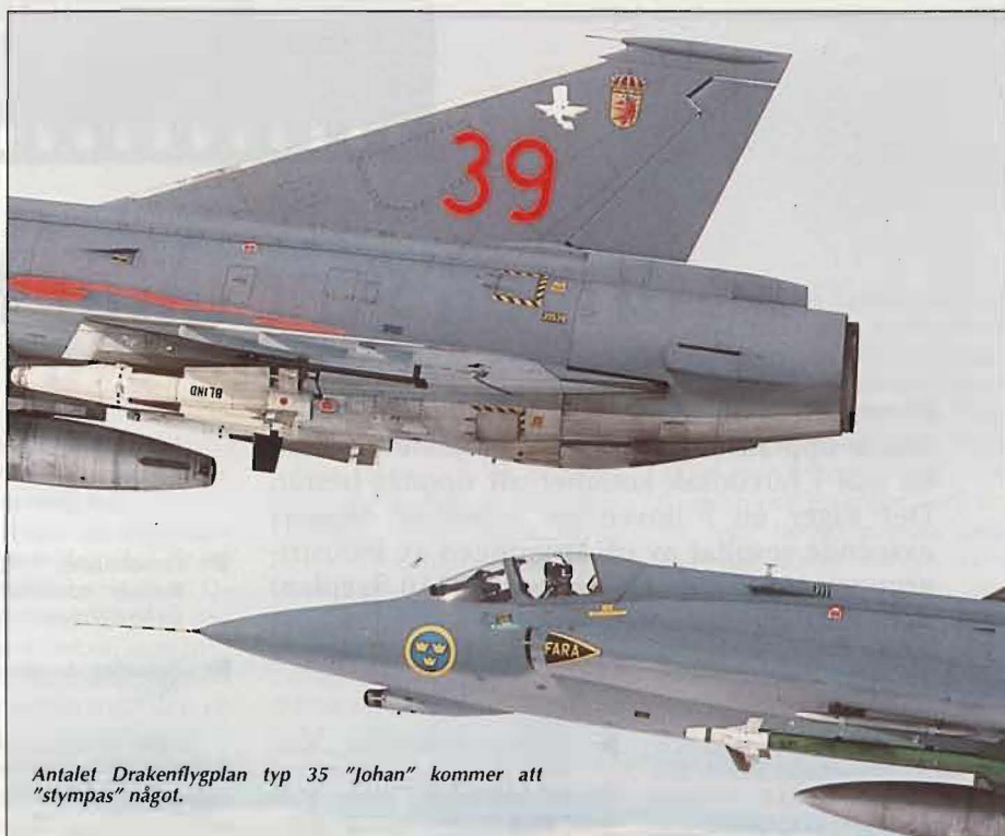
Antalet Drakenflygplan typ 35 "Johan" kommer att "stympas" något.