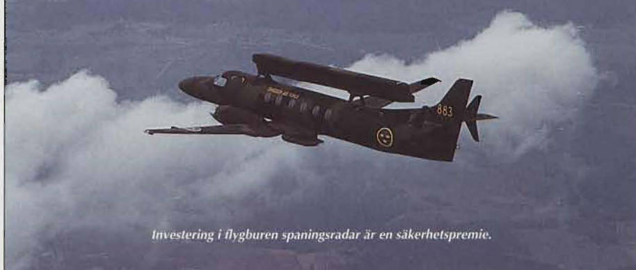
Investering i flygburen spaningsradar är en säkerhetspremie.