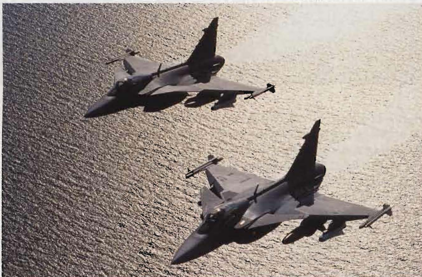
Det framtida flygvapnet kommer att innehålla åtta divisioner med JAS 39 Gripen fördelat på fyra flottiljer.