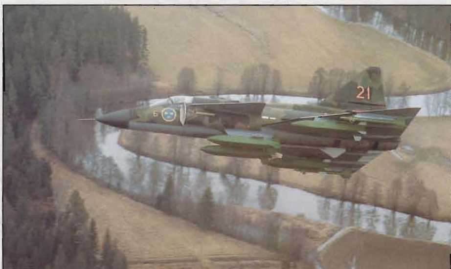
Bombkapseln kan, enl ÖB 92, bara tillföras om alternativ A väljs.

Anskaffningen av JAS 39 Gripen fullföljs till 16 divisioner. Endast ett begränsat antal kvalificerade radarjaktrobotar kan anskaffas. Den tvåsitsiga skolversionen av JAS 39 (39B) kan inte anskaffas. I stället köps ett