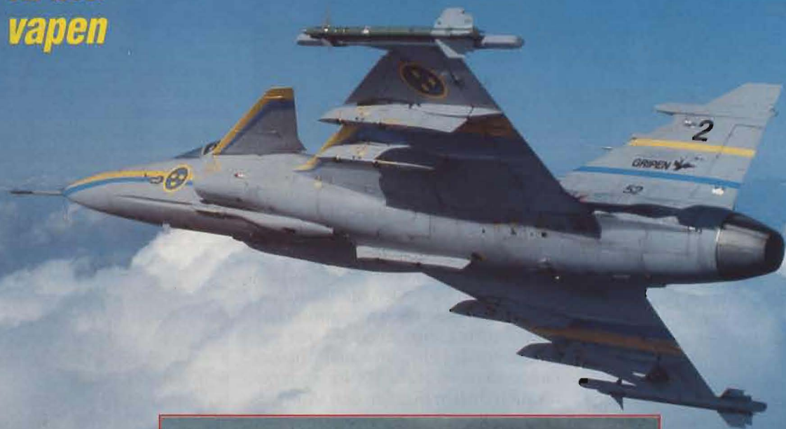
Första robotavfyringen från JAS 39 Gripen september - 91

"If you don't know who your friends are going to be next week, then you have to build your own defences."