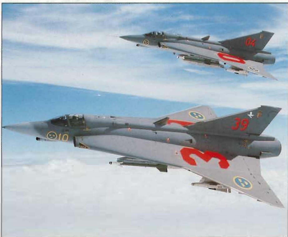
Exempel på alternativ C:s kapitalförstörelse – skrotning av alla nymodifierade Drakenflygplan, J 35J. Cirka 400 miljoner kastas bort. Bl a.

Hela försvaret får i alternativ C en låg krigsduglighet . Flygstridskrafternas vapen och stödssystem får oroväckande låg kvantitet och kvalitet.