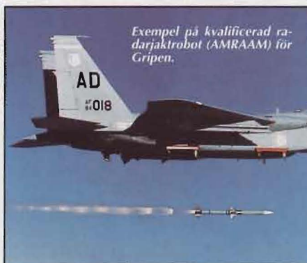
Exempel på kvalificerad radarjaktrobot (AMRAAM) för Gripen.

spaningsradarstationer (FSR-890) organiseras. 21 JAS 39-divisioner ersätter på sikt 35- och 37-systemen. JAS