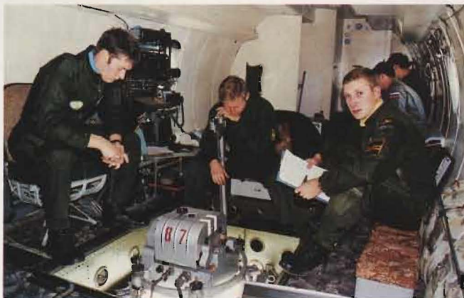
Svensk och rysk personal i samarbete i flygplanet An-30B.