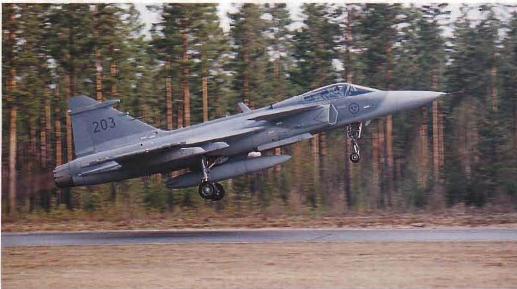
JAS 39 Gripen startar från Färila för ett uppdrag under Flygvapenövning 03. Företagsordern som reglerade uppdraget var utarbetad av Flygtaktiska kommandot.

ARTIKELFÖRFATTAREN ÄR ÖVERSTELÖJTNANT VID FTK I UPPSALA.