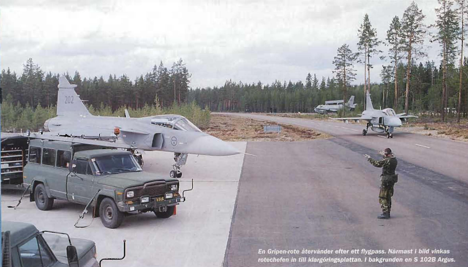
En Gripen-rote återvänder efter ett flygpas. Närmast i bild vinkas rotechefen in till klargöringsplattan. I bakgrunden en S 102B Argus.

Basbataljonen på Färila hade förvisso en inte helt typenlig sammansättning, eftersom man betjänade både Viggen- och Gripen-divisioner från samma bas. Detta förhållande uppstod eftersom Gripenomskolningen för F 4:s del tvingats skjutas fram i tiden. För övningens del hade detta dock ingen avgörande betydelse.