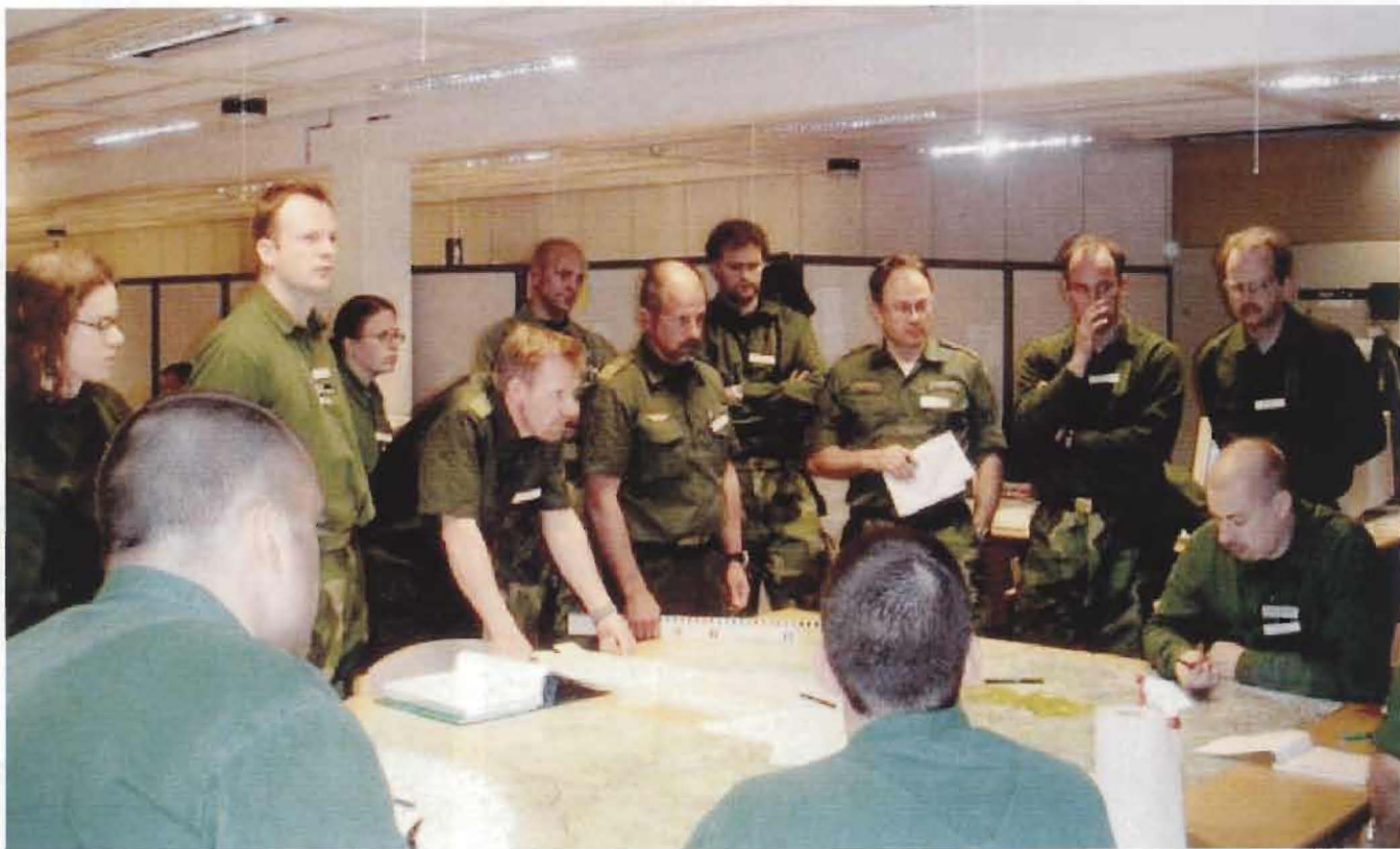
Insatserna under Flygvapenövning 03 leddes från F 17:s stridsleningscentral utanför Hässleholm.