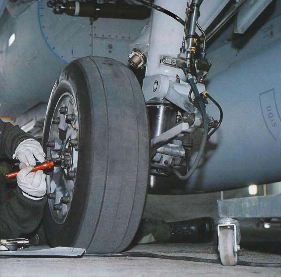
Löjtnant Malin Ekenberg från F 21 i Luleå inspekterar ett av hjulnaven under en s k C-service av JAS 39 Gripen. Hela serviceproceduren gjordes i en fälthangar på Färila-basen.