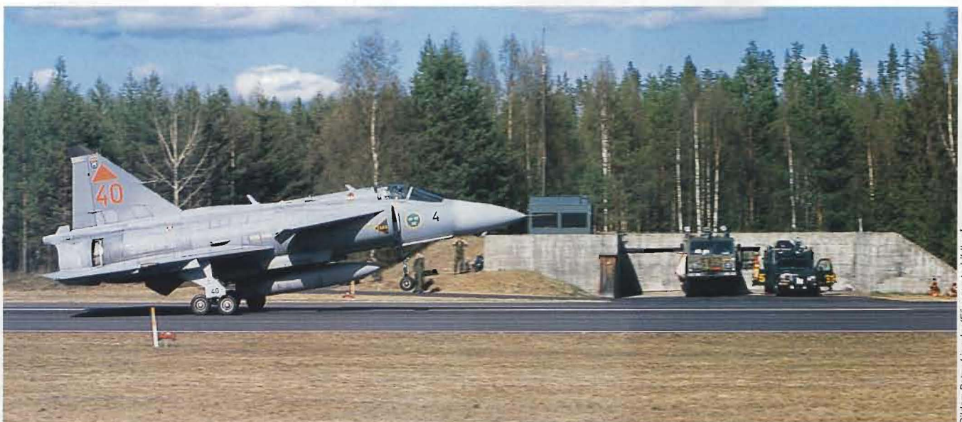
En JA 37 Jaktviggen landar på Färila. I bakgrunden ses flygledartornet och räddningsstyrkans fordon ur Insatskompaniets R3-pluton.