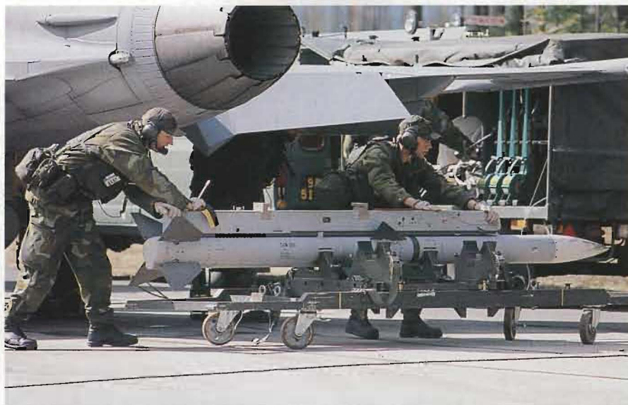
Värnpliktiga ur en klargöringstropp rullar fram en RB 99 AMRAAM till Gripen.

För deltagarna från F 21 blev det en tio timmar lång transport med bussar. Materielen hade fraktats till närbelägna