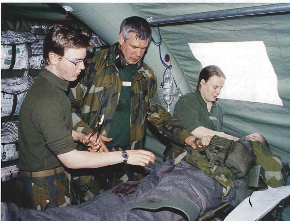
Den skadade tas om hand av läkare och sjukskötare inne i tältets behandlingsrum.