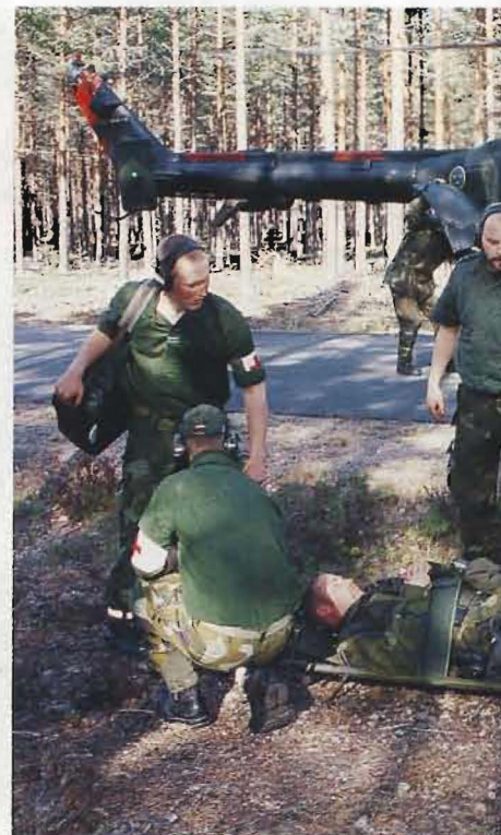
En skadad har just anlänt med helikoptern och sj