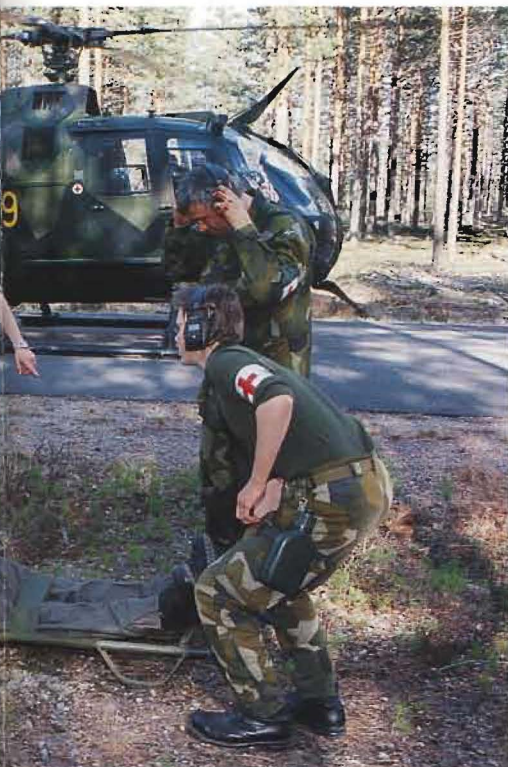
Personalen tar tag i båren.

Under Flygvapenövning 03 sysselsattes man inte enbart genom övningsmoment, drygt 90 sjukvårdsfall behandlades också. Dessbättre inga av allvarlig karaktär, utan mest smärre kläm- och sårskador och ryggont.