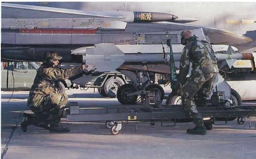
JA 37 Jaktviggen laddas med en jaktrobot typ RB 74 Sidewinder.

►►► kompanierna ska kunna verka härifrån och kan betjäna en rote över tiden. Det andra insatskompaniet skulle kunna omgrupperas till exempelvis Borlänge och verka autonomt därifrån.