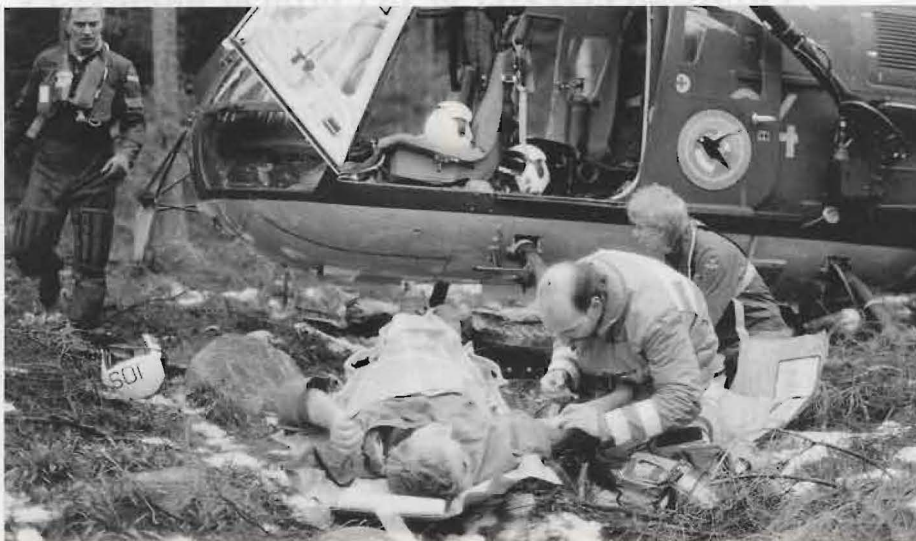
Det hände för ett år sedan. Ungefär en mil sydväst om Karlsborg. En rotvälta bröt lårbenet av en skogsarbetare. Ambulansen kunde inte ta sig fram. Via SOS i Falköping undsattes F6:s räddningshelikopter HKP 9B, vars sjukskötare här ses ge den skadade en smärtstillande injektion. Benet fixerades och patienten lades på vaccummadrass för lufttransport till sjukhuset i Skövde.

1) Härmed avses fjällräddning, uppdrag i samband med skogsbränder, oljeutsläpp, vådautlösta nödsändare och dylikt.