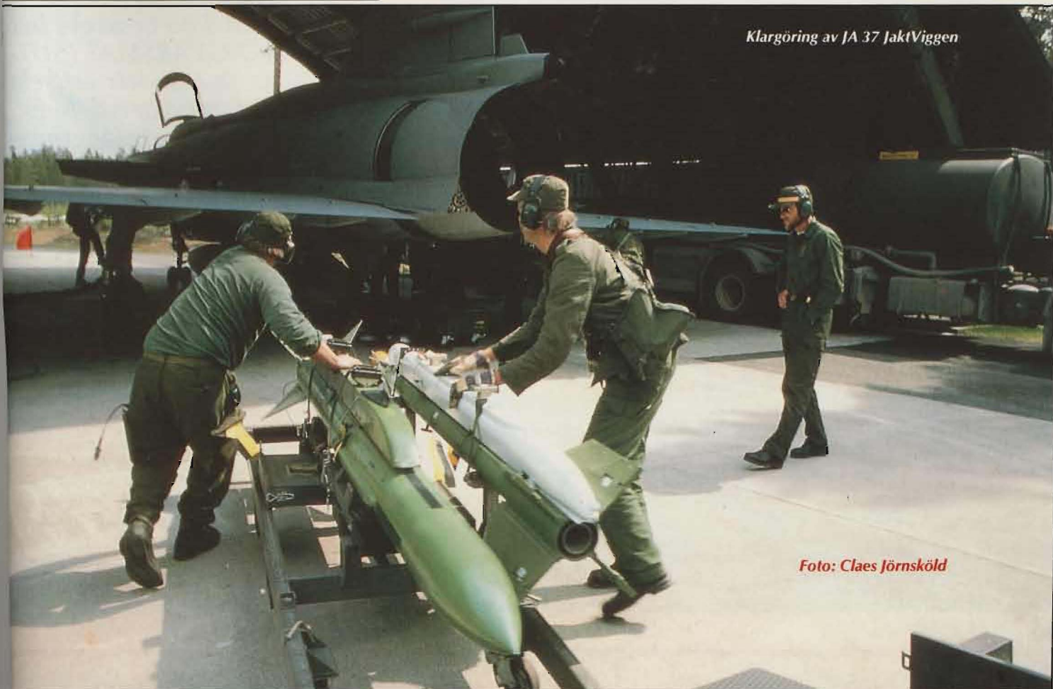
Klargöring av JA 37 JaktViggen

Brist på markstridsinstruktörer har på vissa förband inneburit svårigheter att bibehålla kvaliteten på värnpliktsutbildningen. Pensionsavgången och frivilligtjänstgörande personal har i likhet med föregående år utnyttjats för att täcka vissa vakanser – främst vid stationskompanierna. Även civil personal har anställts för att täcka vissa brister på militär personal. ■