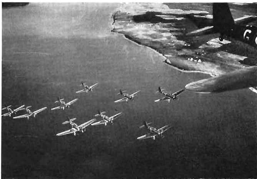
Jämtlands och Västgöta flyglottillfjör (F4 och F6) disponerade under den i artikeln behandlade delen av 1943 vardera något över ett 40-tal lätta bomb- (attack-) plan typ B 5 (Northrop B-A 1) av amerikansk typ, licensbyggda hos SAAB. 980 hk Nohab/SFA-byggda Mercury-motorer av brittisk Bristol-typ. Planets fart ca 330 km/tim. — Här en division (9 st enligt den äldre indelningen) över Storajön sedd från flygplan ovanför.

verksam insättande av våra jaktflyg i strid (jfr nedan),