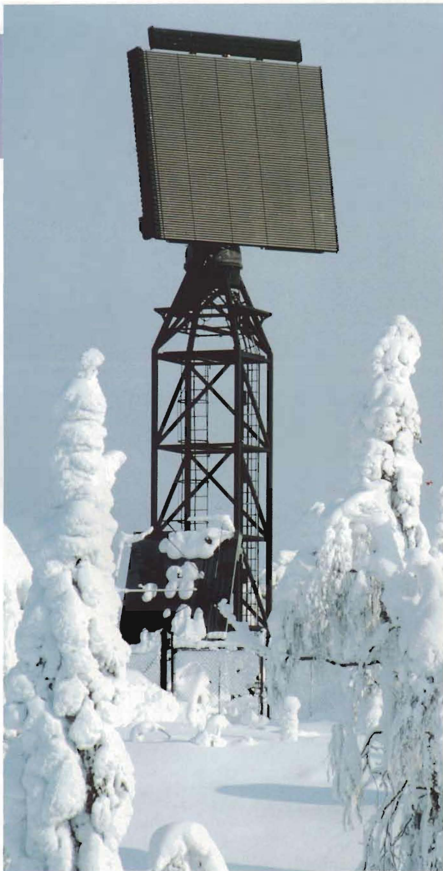
Radarn PS-860 är ett av Försvarsmaktens viktigaste sensorsystem i bevakningen av svenskt luftrum.