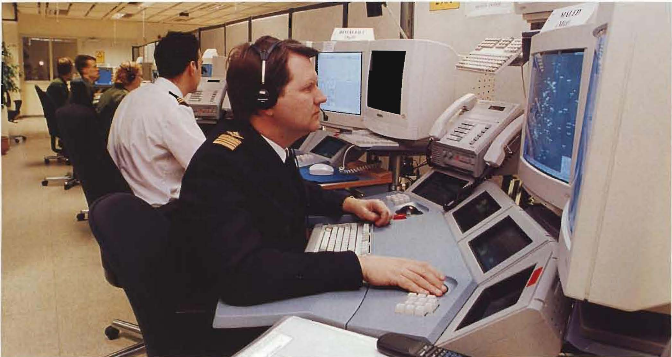
Strilbataljon 04 kallas Försvarsmaktens nya organisation för stridsledning och luftbevakningsförband.