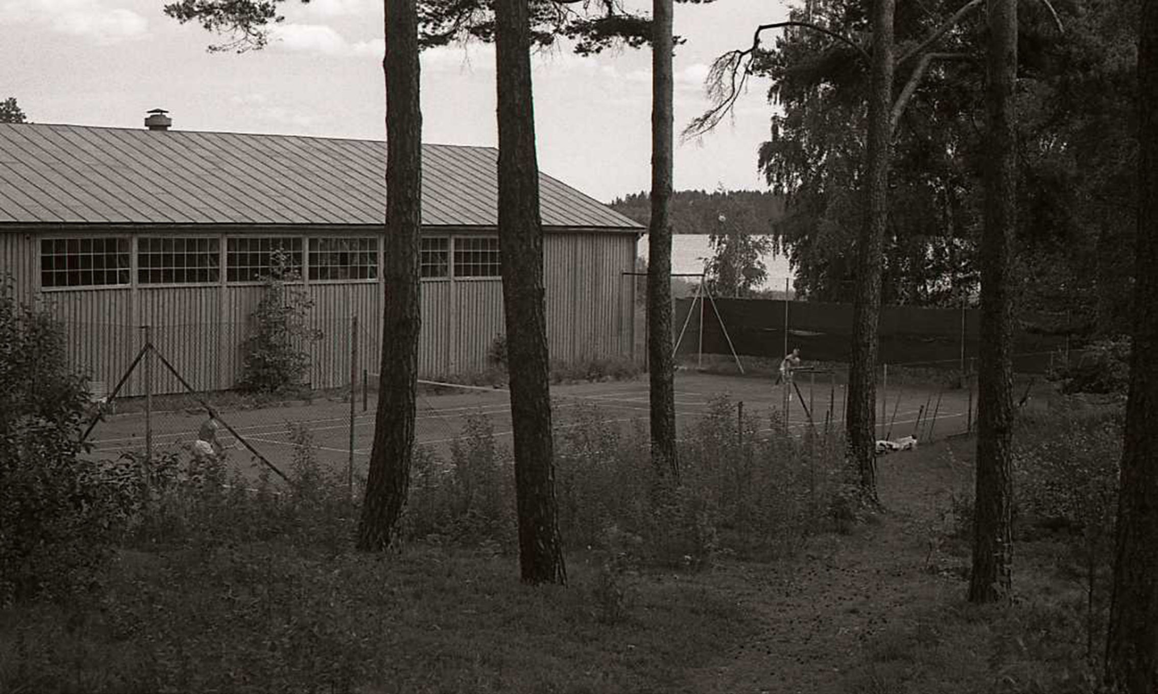
Bild 79. Den västra trähängaren Tennisbanan.