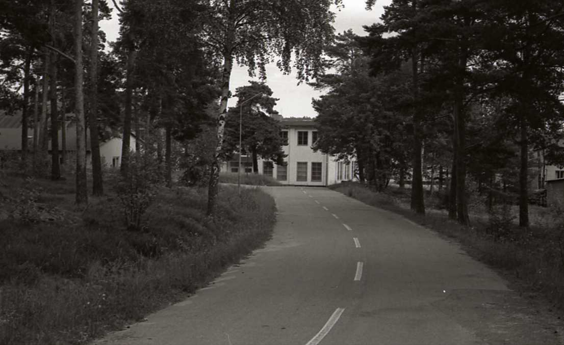
Bild 81. STRILS lokaler. Sammanbyggda med hangar 81 södra gavel.