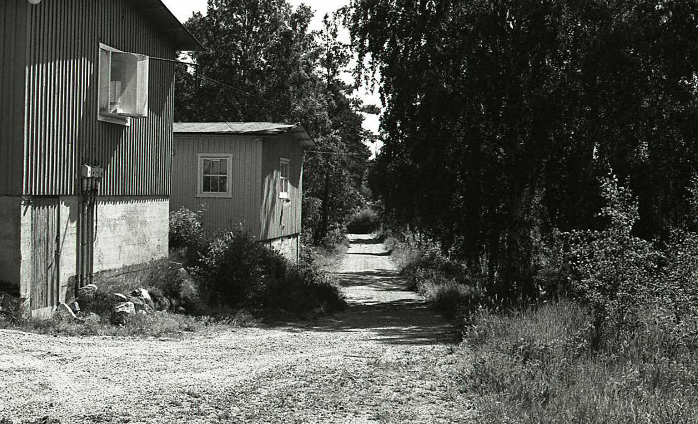
Bild 33. By 10 Skolhuset och vattentornet.