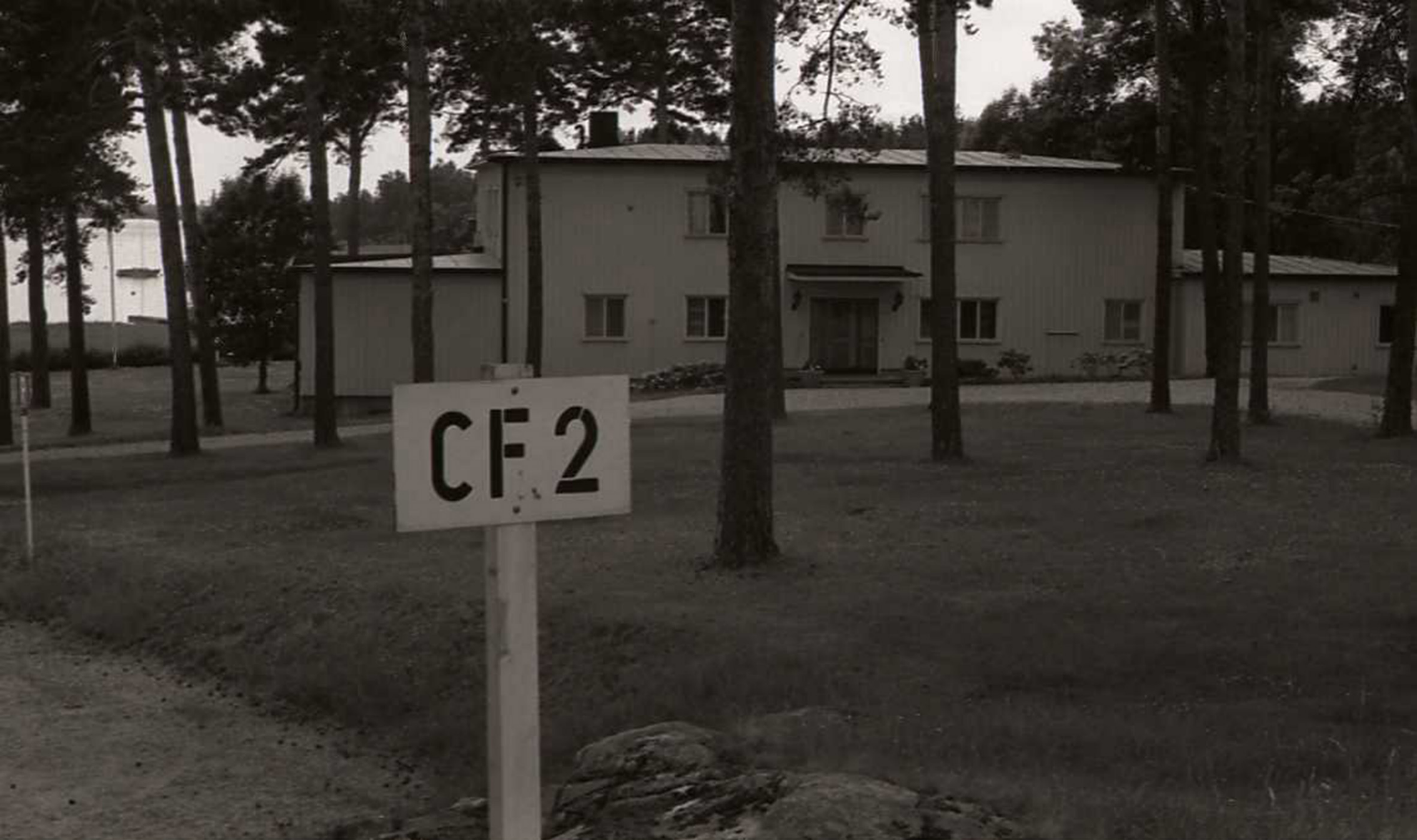
Bild 88. CF2 Parkering Offmässen.