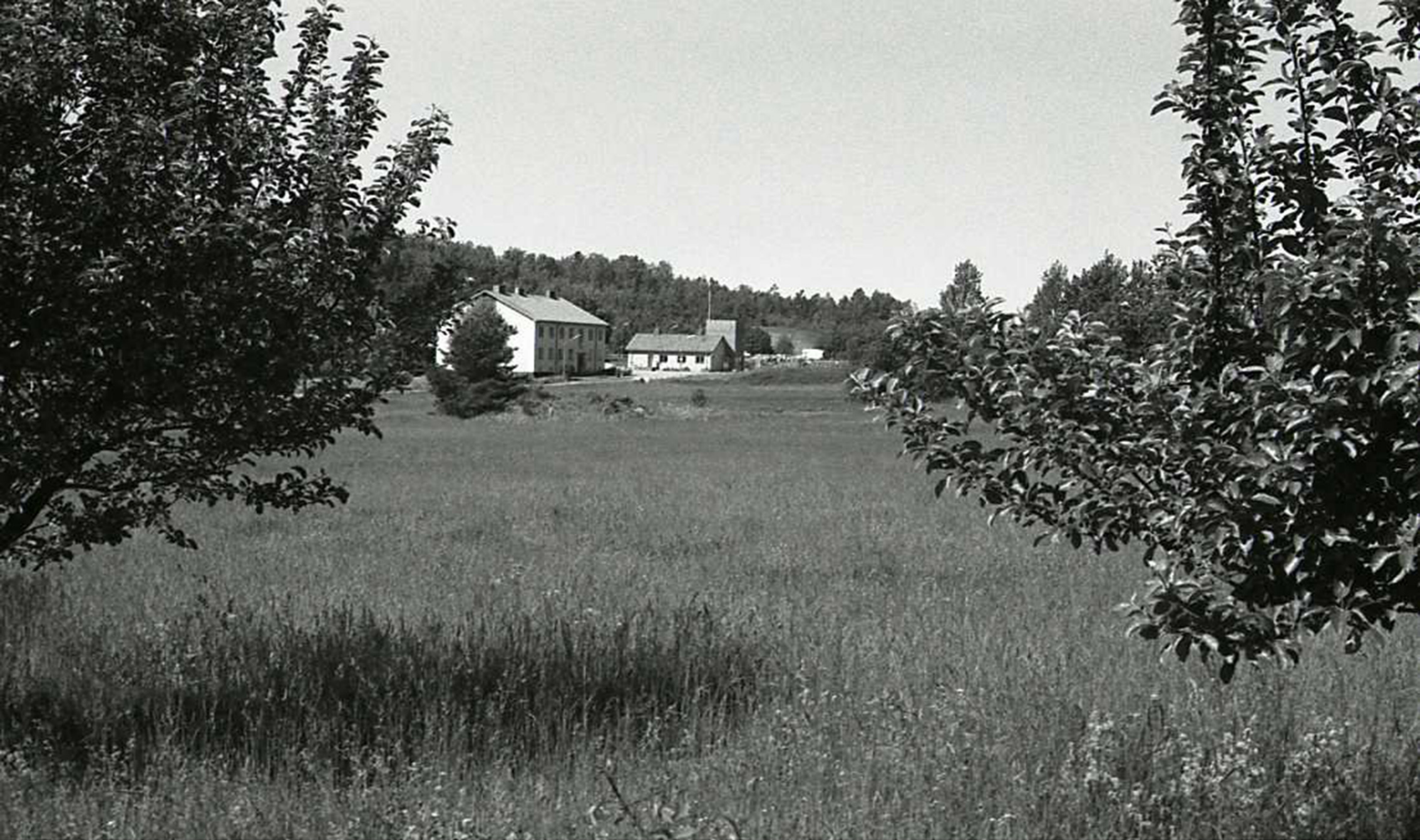
Bild 48. Kasern 8. Vakten.