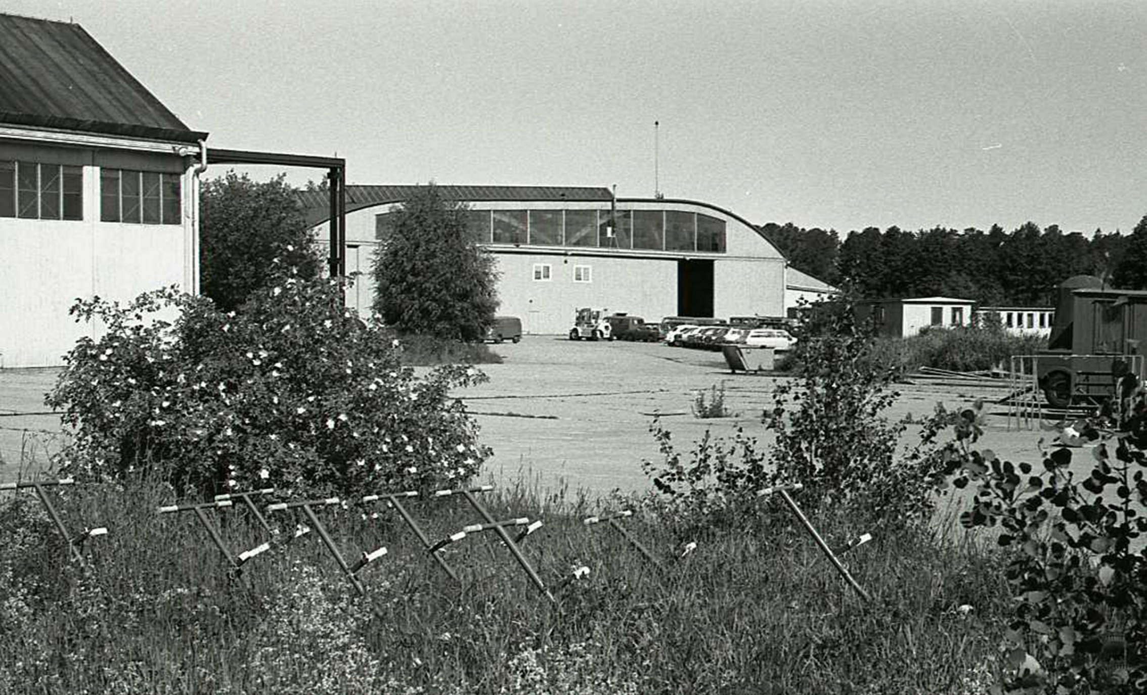
Bild 19. Hangar 82. Avd 6.