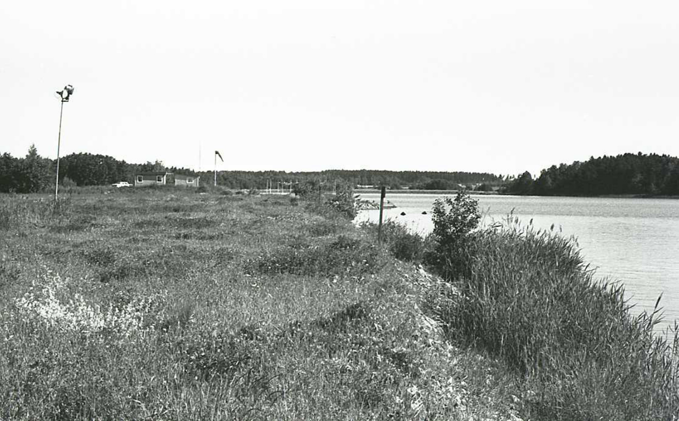
Bild1. Igenvuxna stranden Täby sjöflygklubbs hus. Gamla högtalaranläggningen.