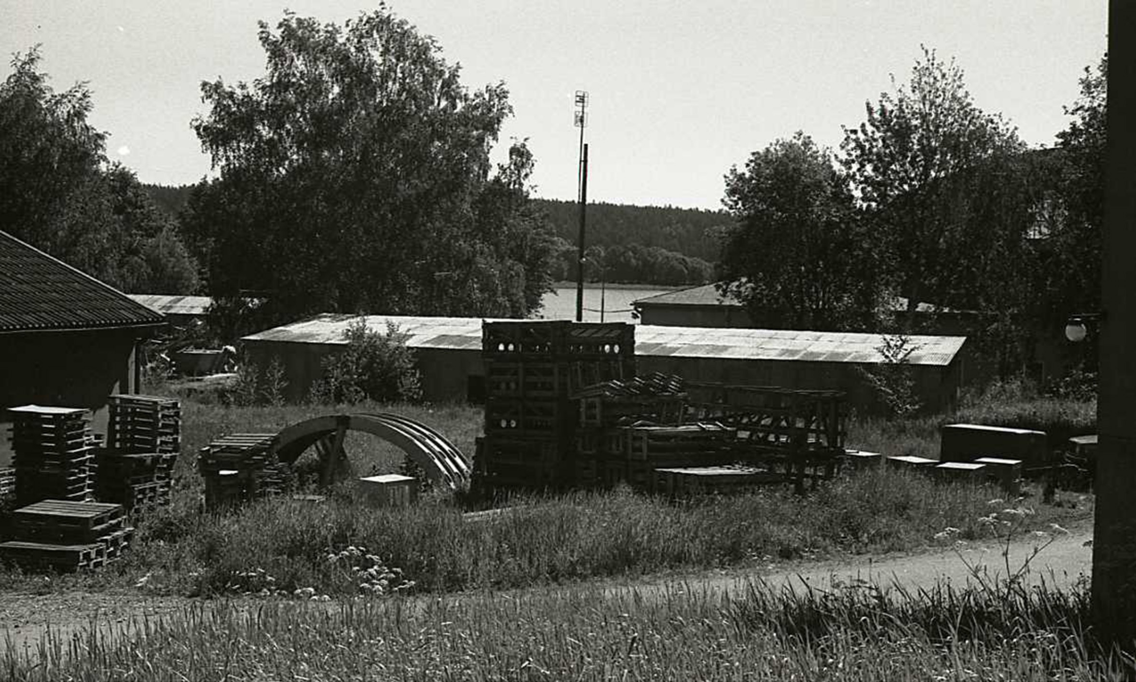
Bild 27. Mot öster. Flygmaterieförrådet t v och avd 6 t h.