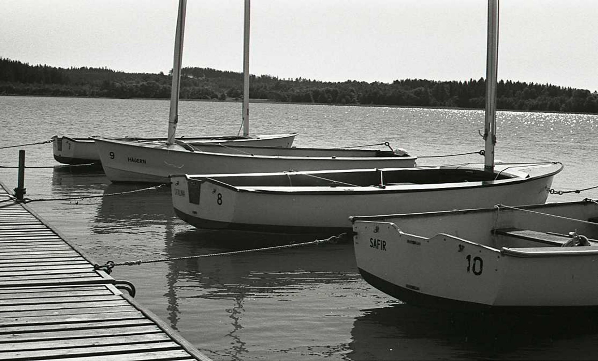
Bild 21. Trissjollar.