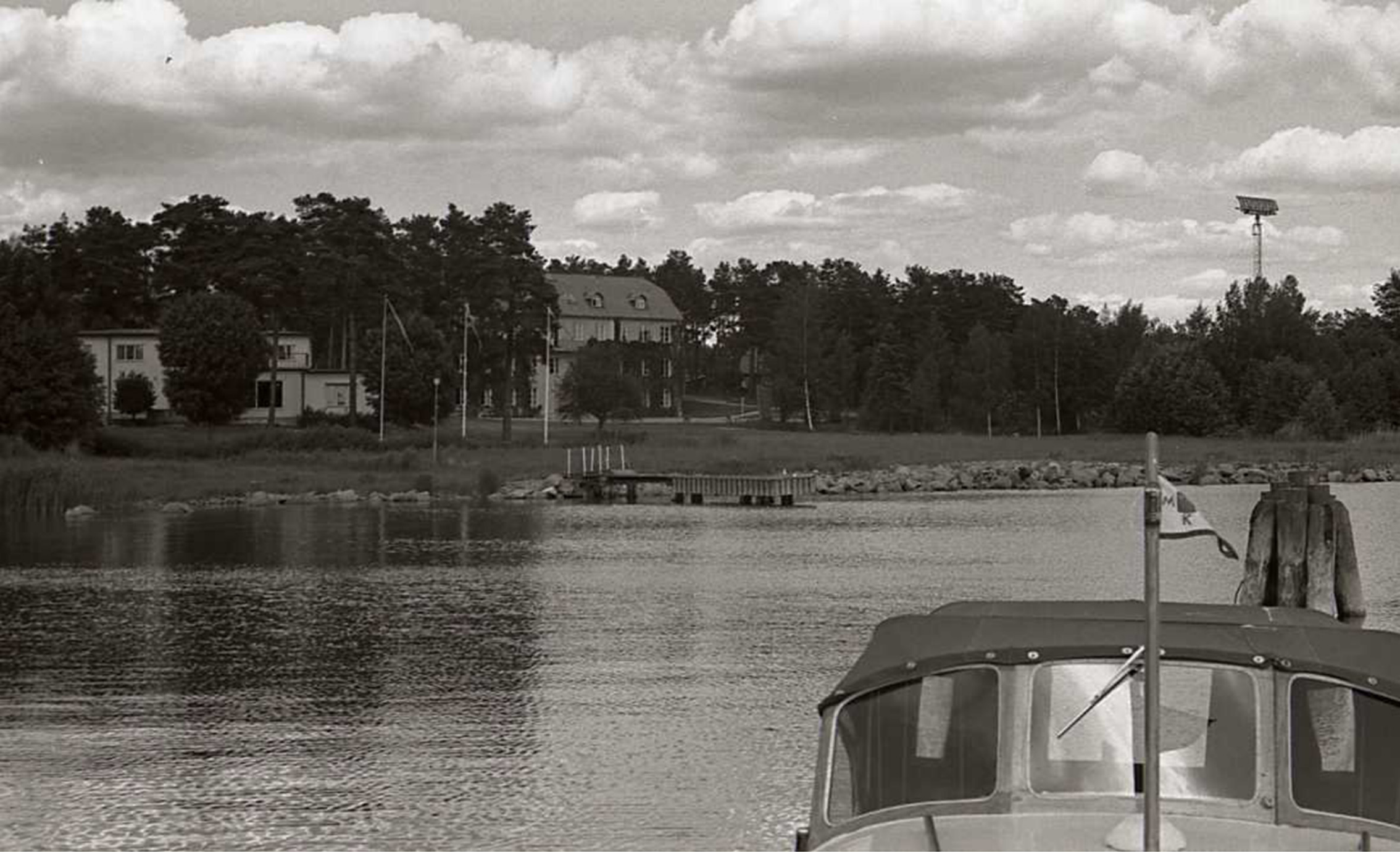
Bild 75. Offmässen Kanslihuset.