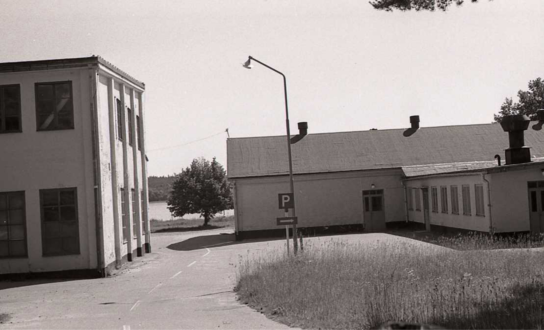
Bild 62. STRILS lokaler.