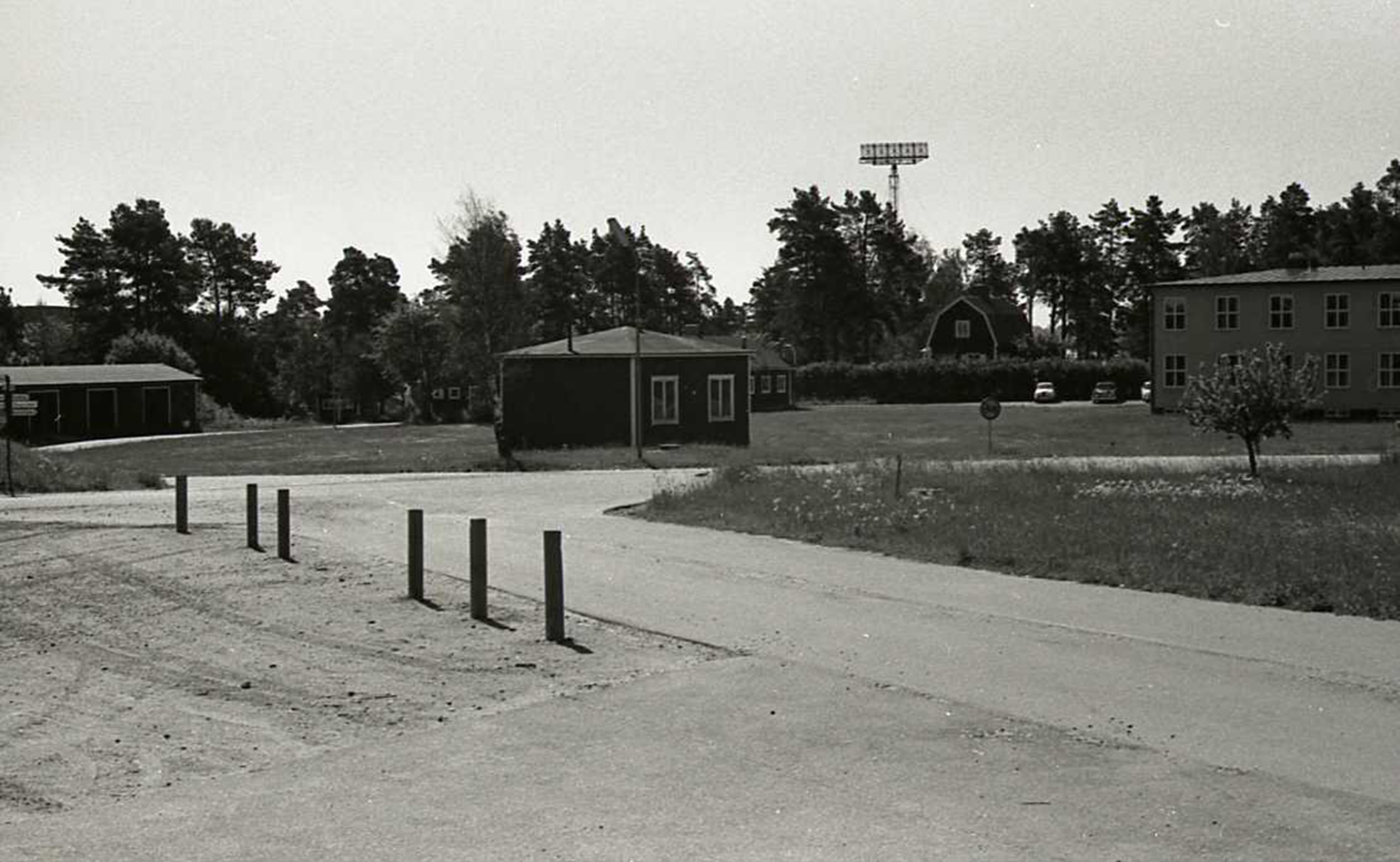
Bild 35. Skolhuset by 10 . Kubikenborg.