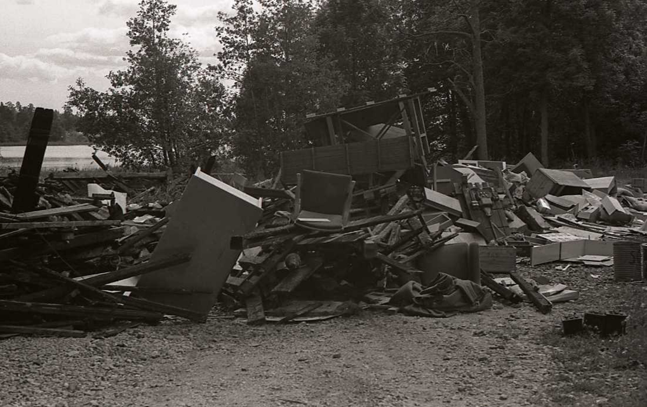
Bild 68. Eldplatsen.