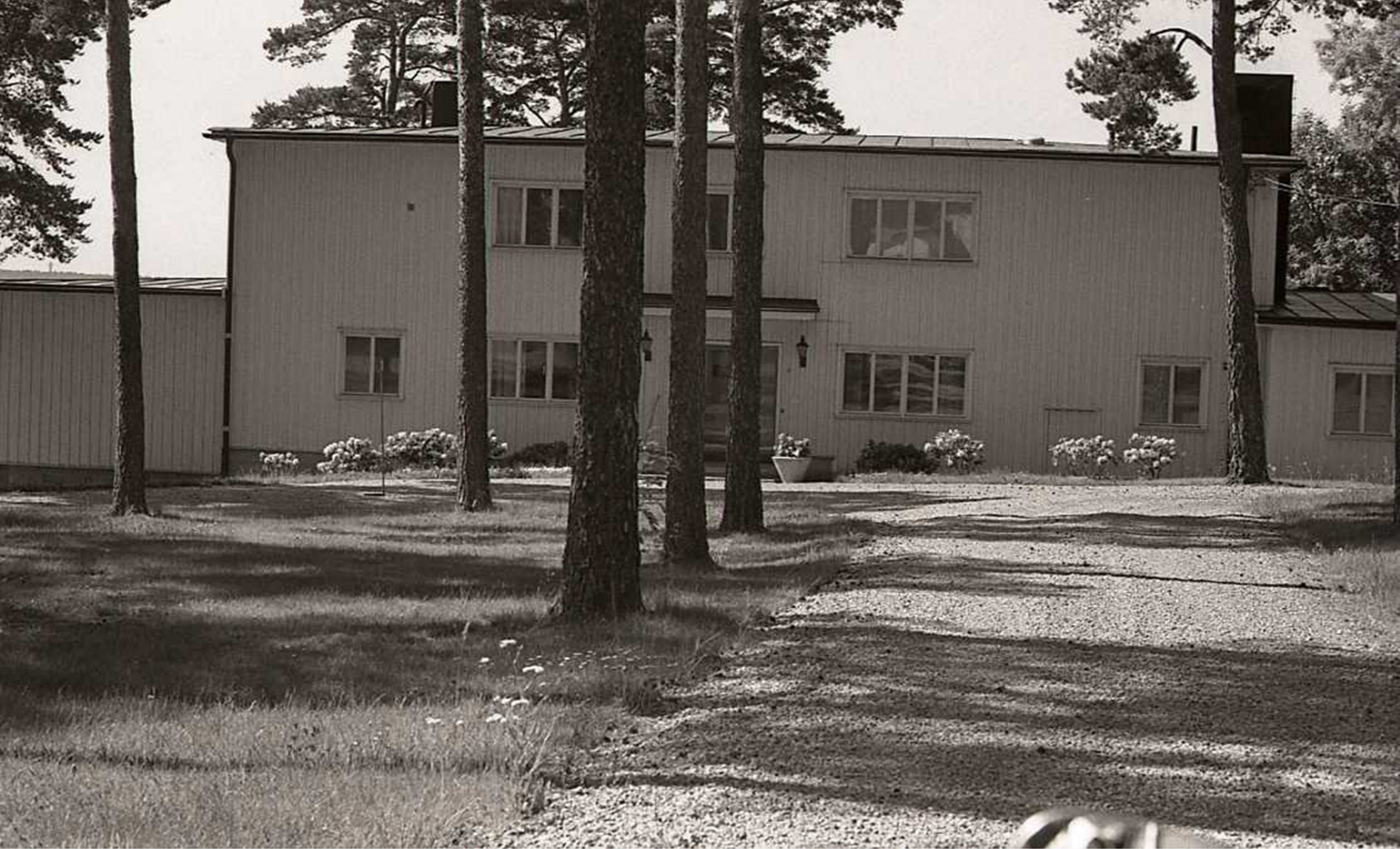
Bild 58. Offmässen Entren.