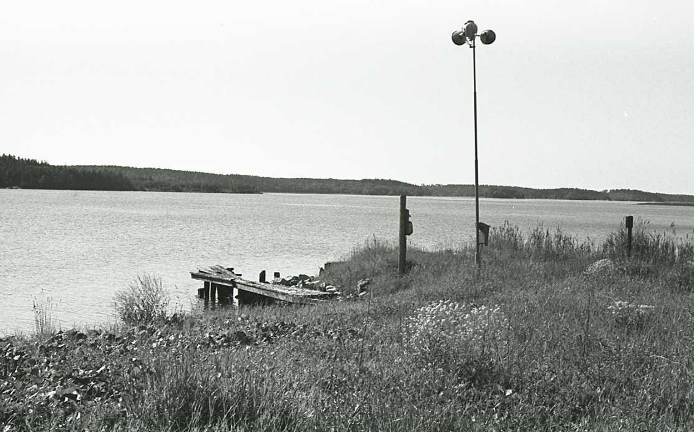
Bild 2. Igenvuxna stranden. Gamla högtalaranläggningen.