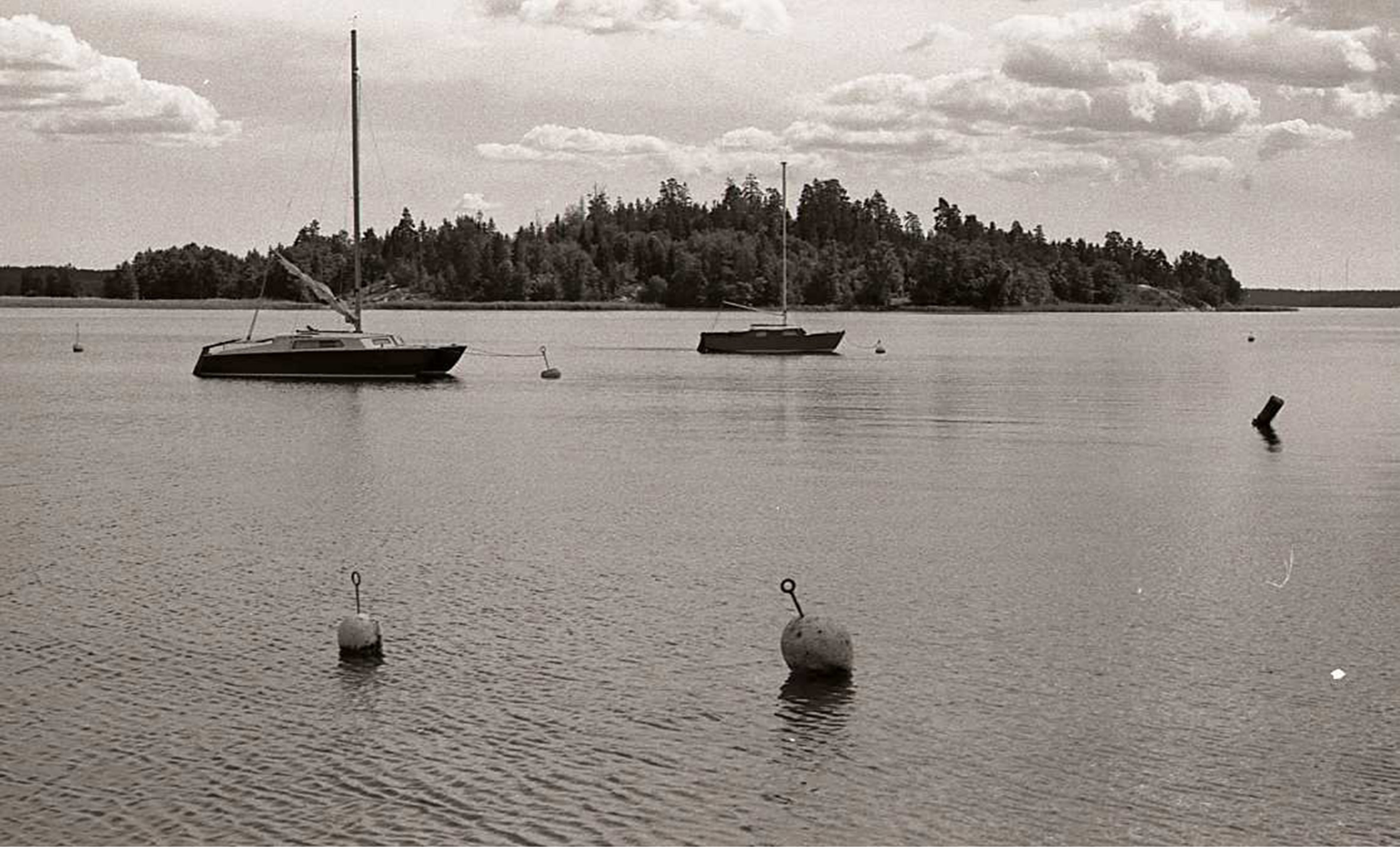
Bild 73. Tornön.