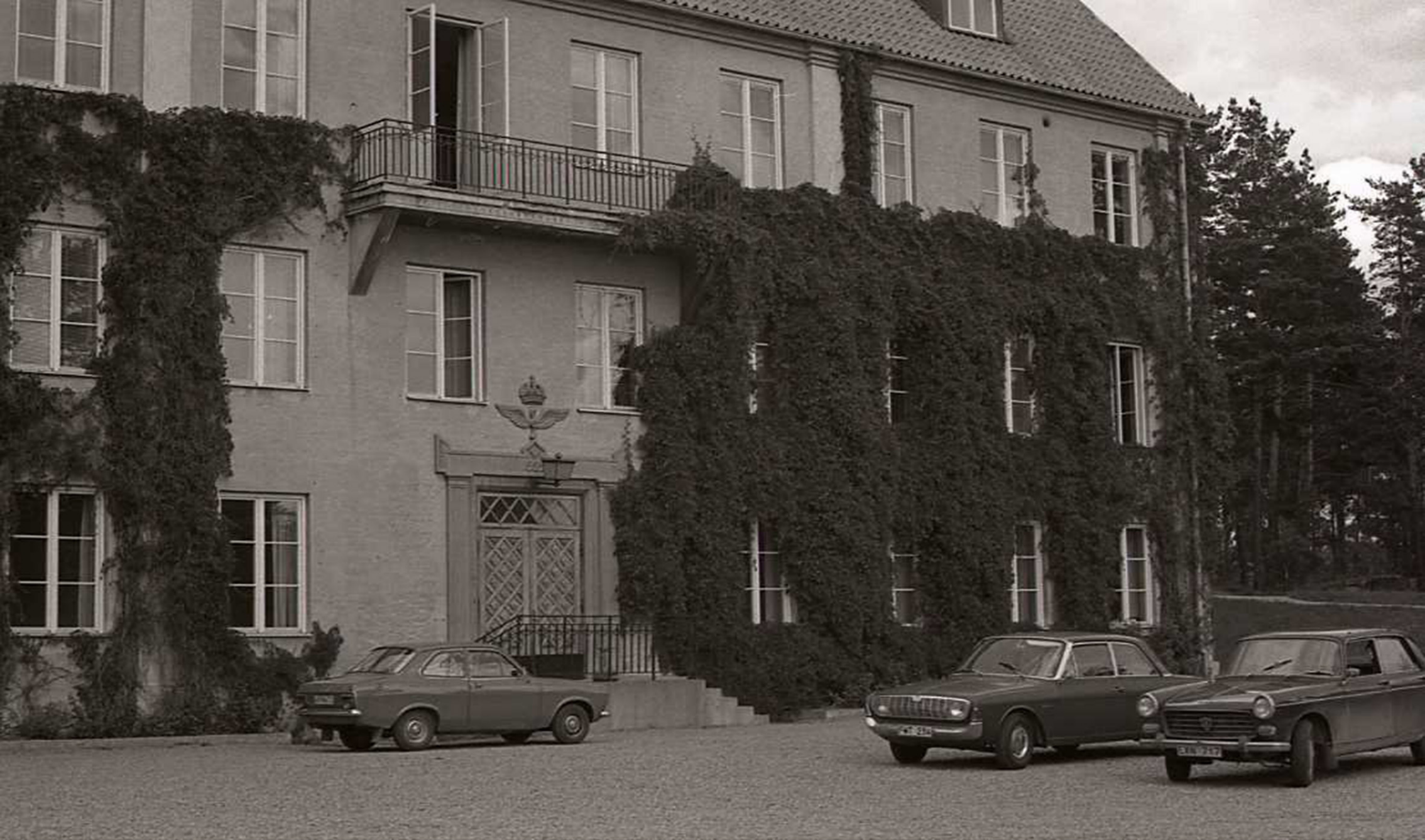
Bild 92. Kanslihuset från söder.