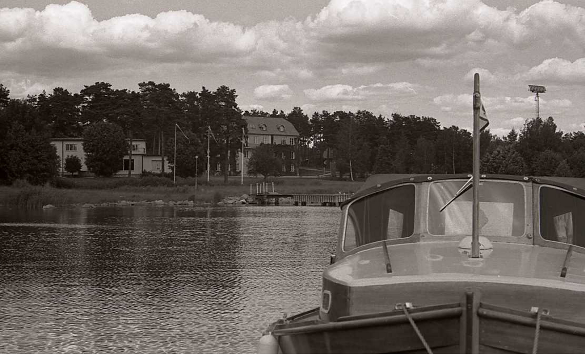
Bild 74. Offmässen Kanslihuset.