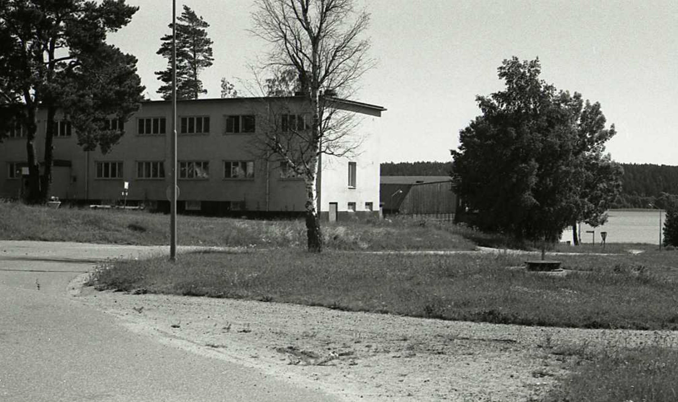
Bild 47. Kasern 21.