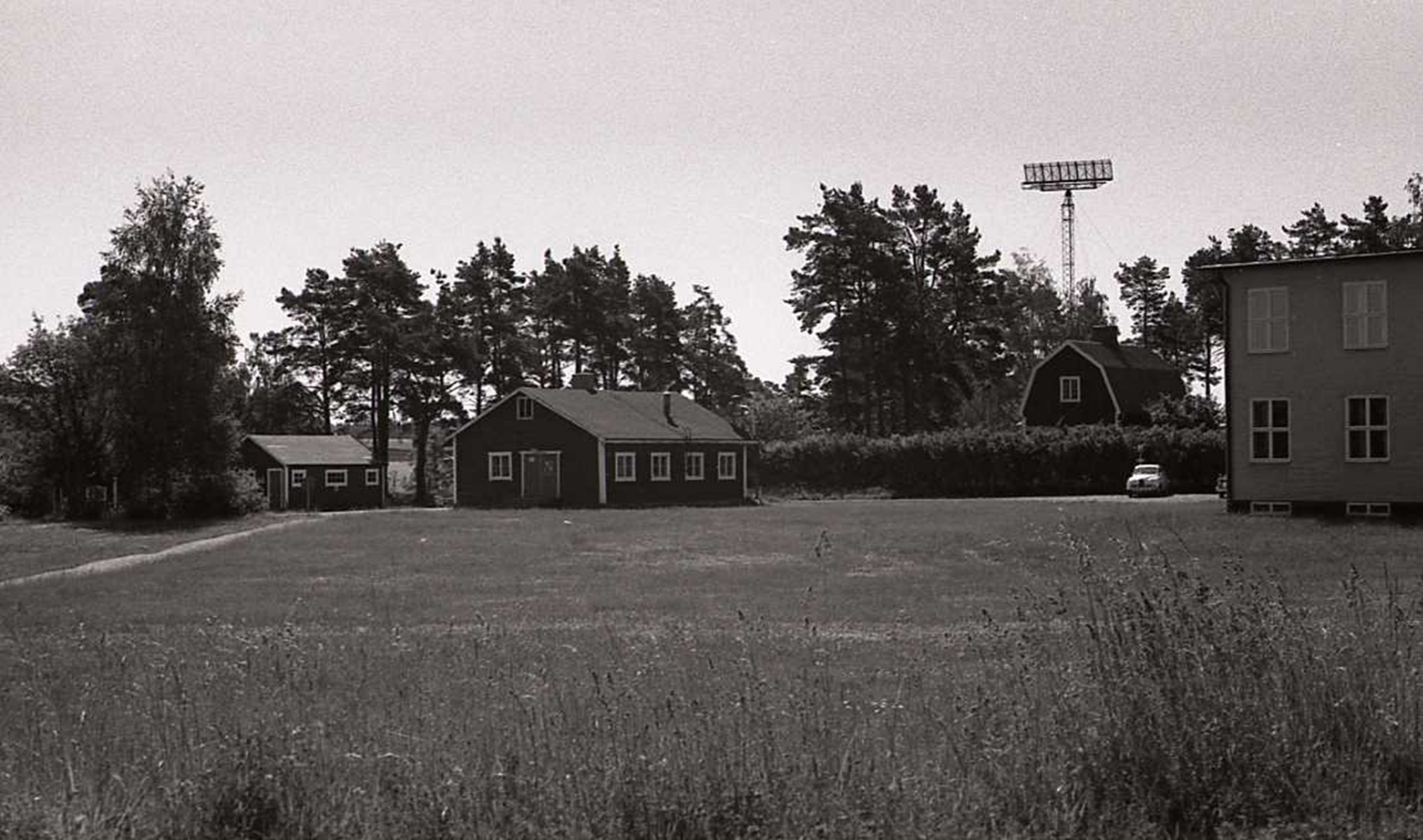
Bild 50. Snickeriverkstaden. Förvaltarvillan. Skolhuset.