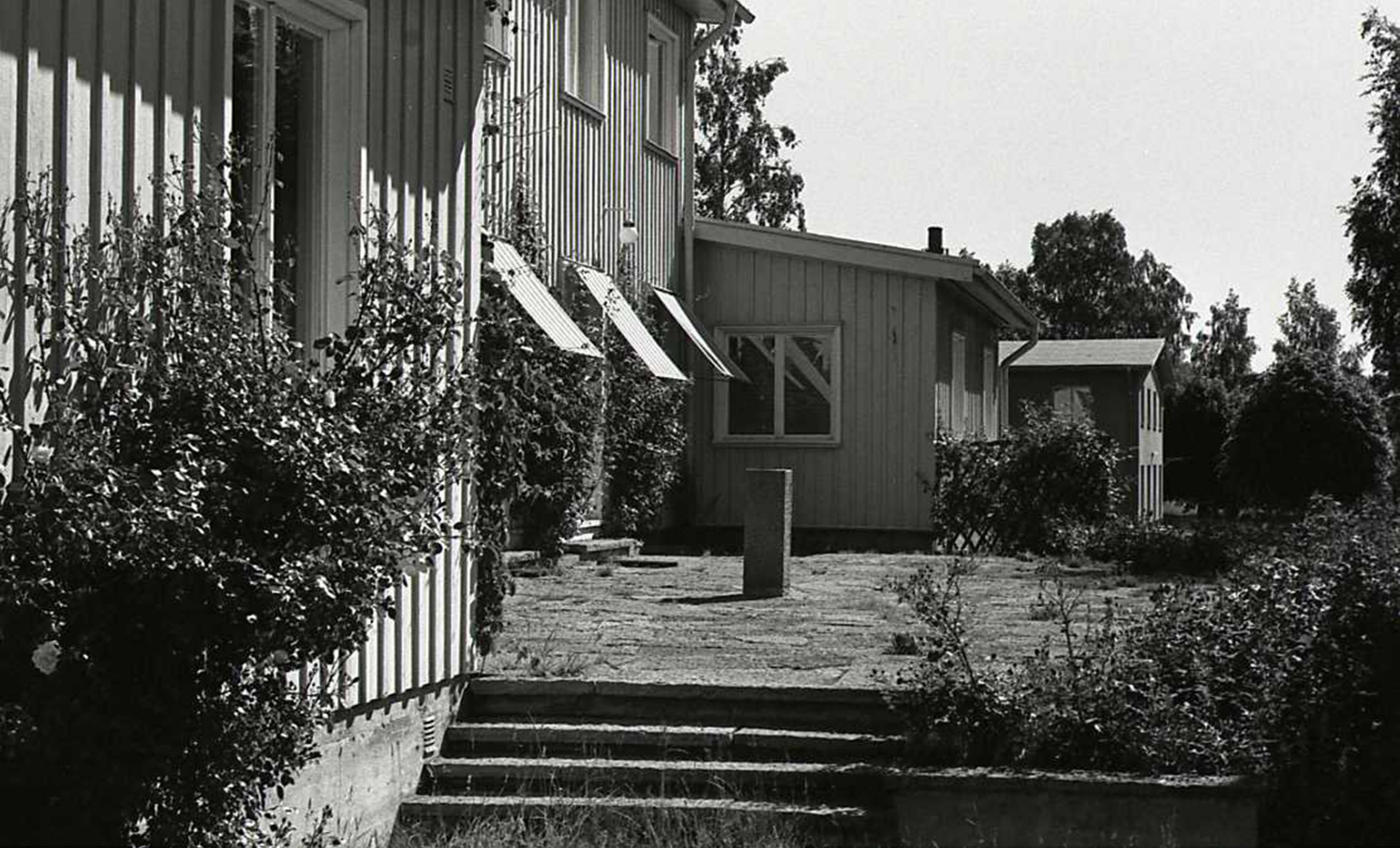
Bild 29. Offmässen mot söder.