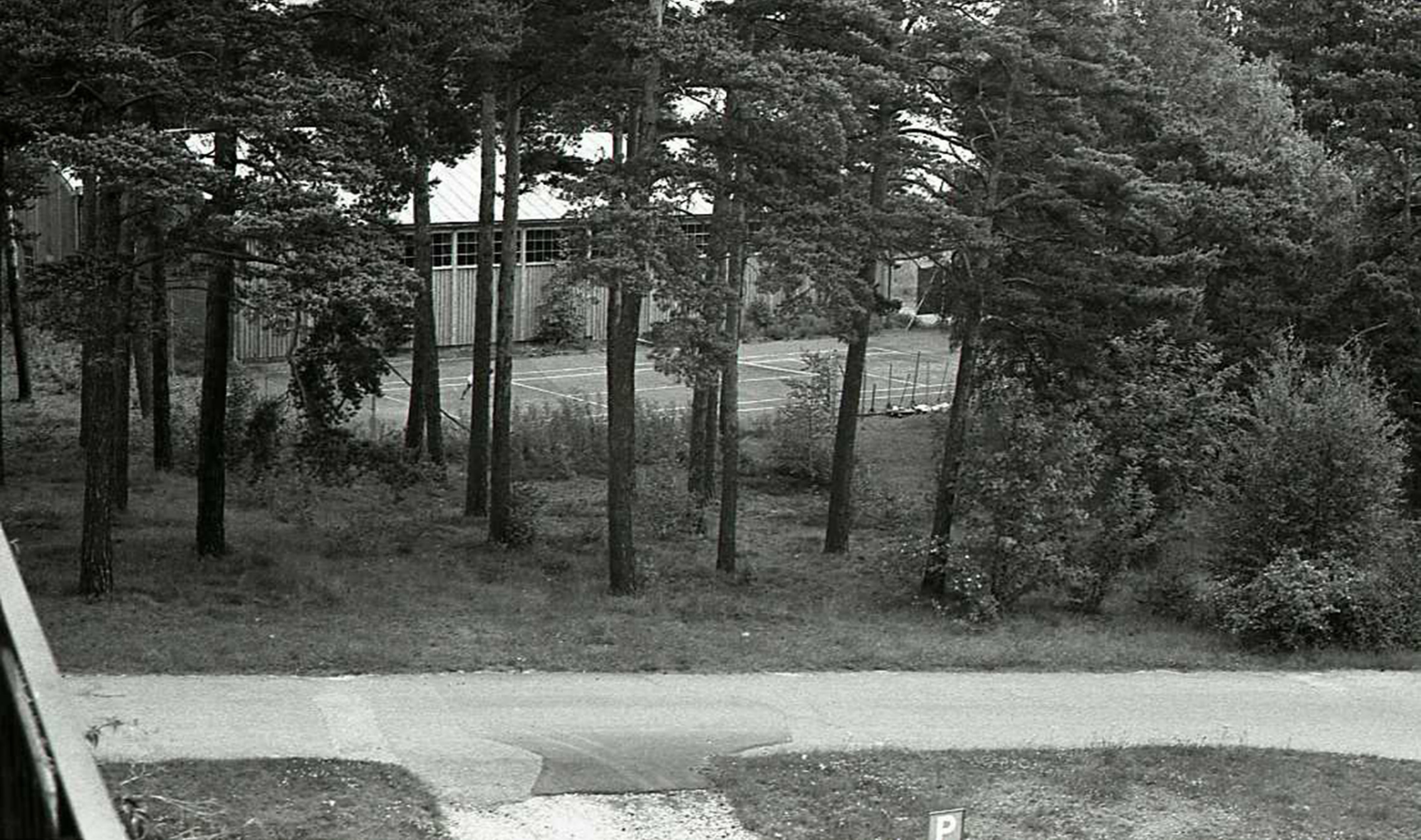
Bild 91. Den västra trähangaren Tennisbanan.