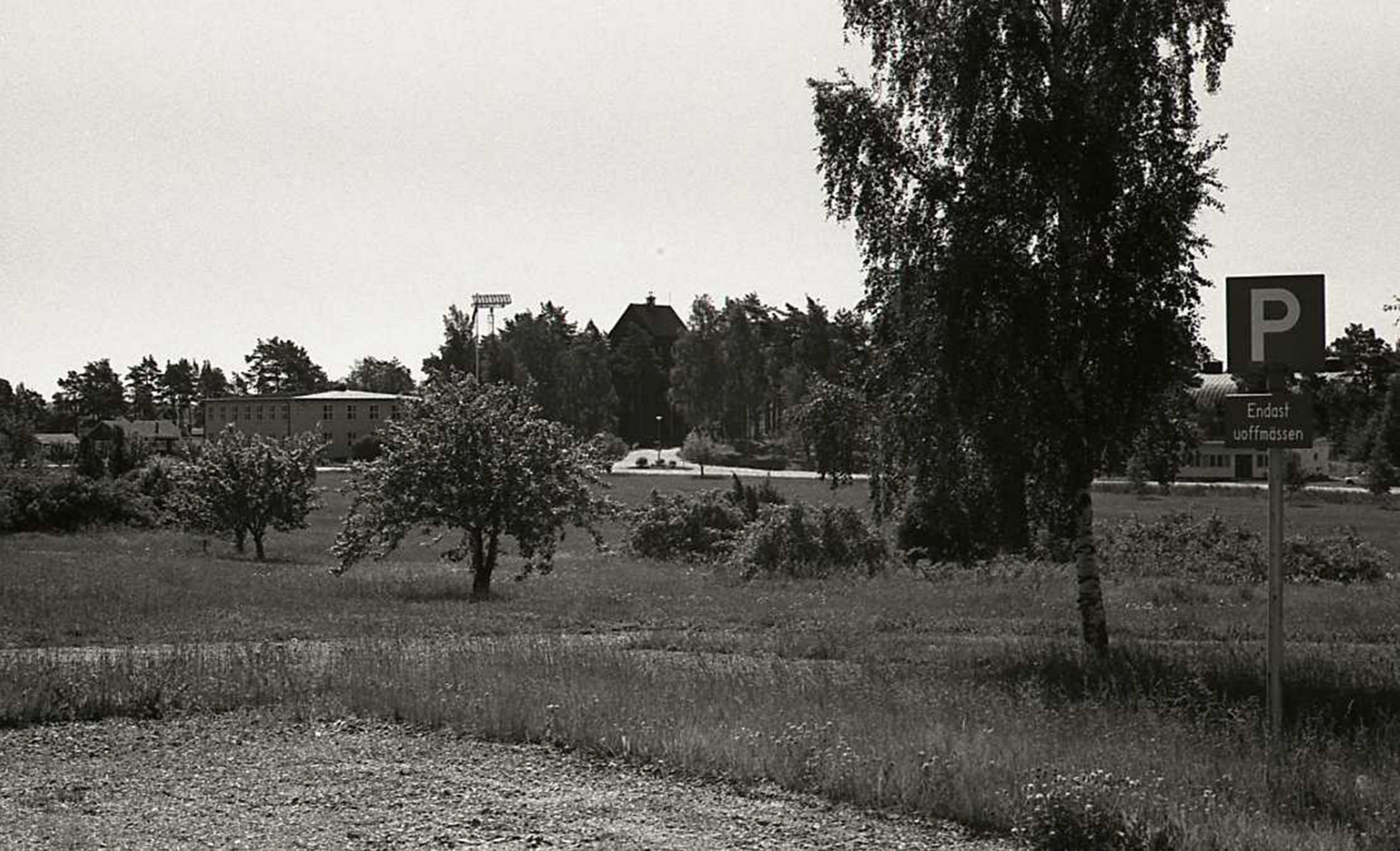
Bild 30. By 10 Skolhuset och vattentornet.