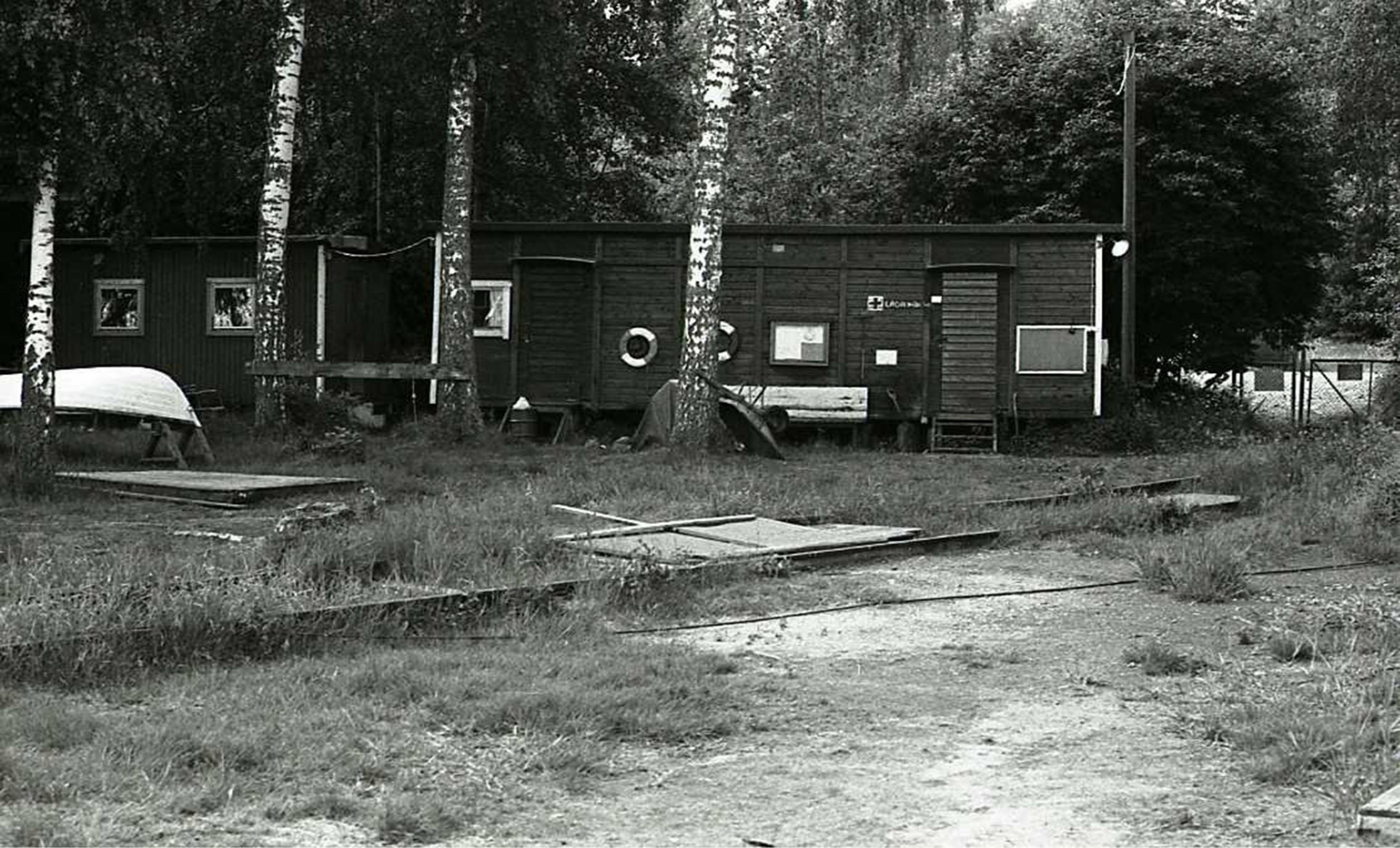
Bild 72. F2 båtklubb.