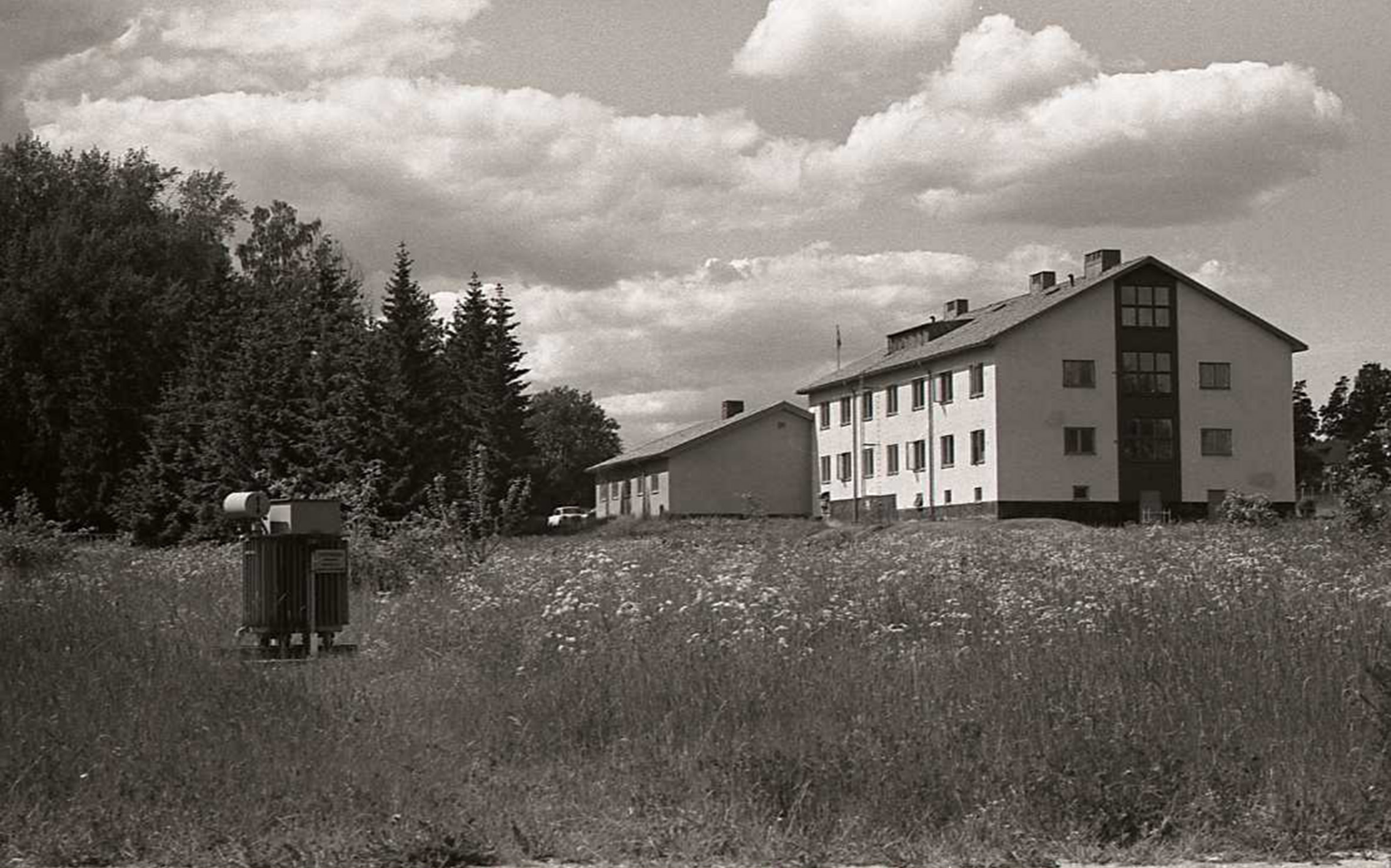
Bild 66. Kasern 8 Brandstationen.