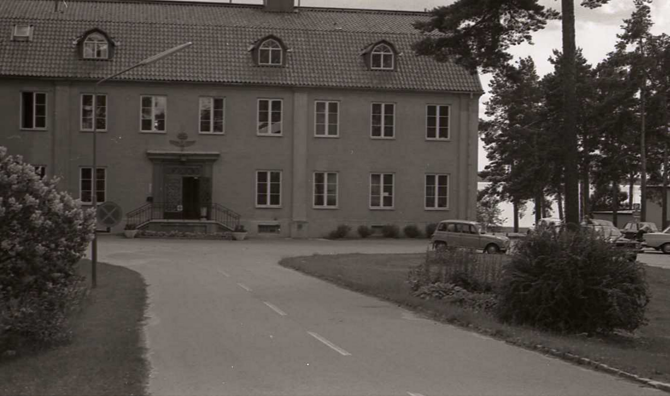
Bild 87. Kanslihuset.