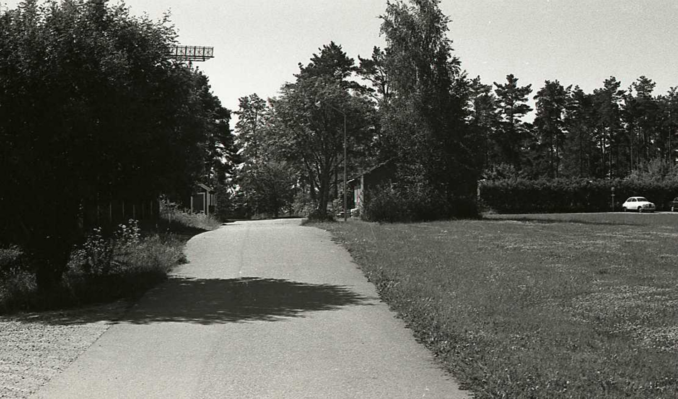
Bild 45. Snickeriverkstan delvis skymd t h.