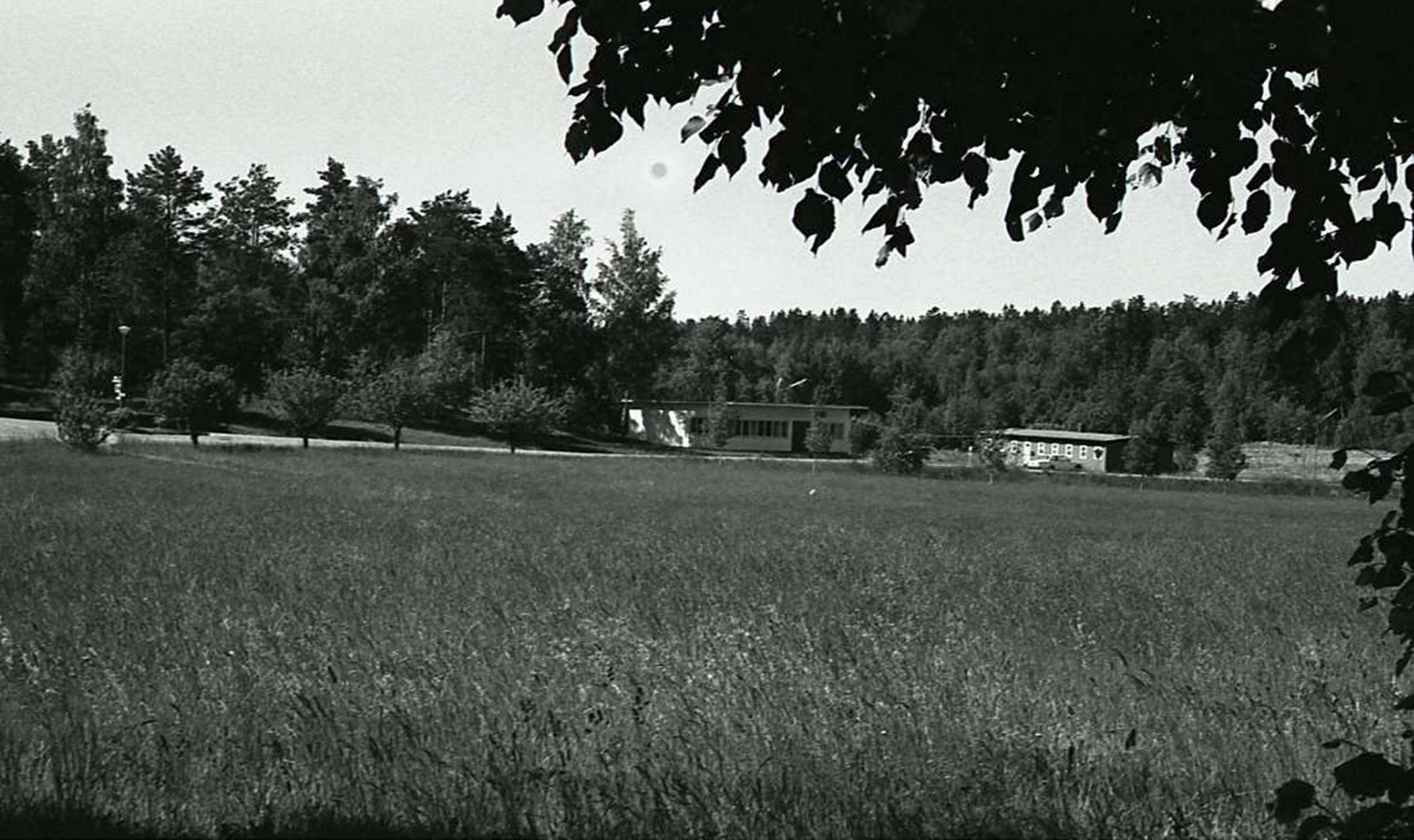
Bild 42. Biblioteket. Barack 34.