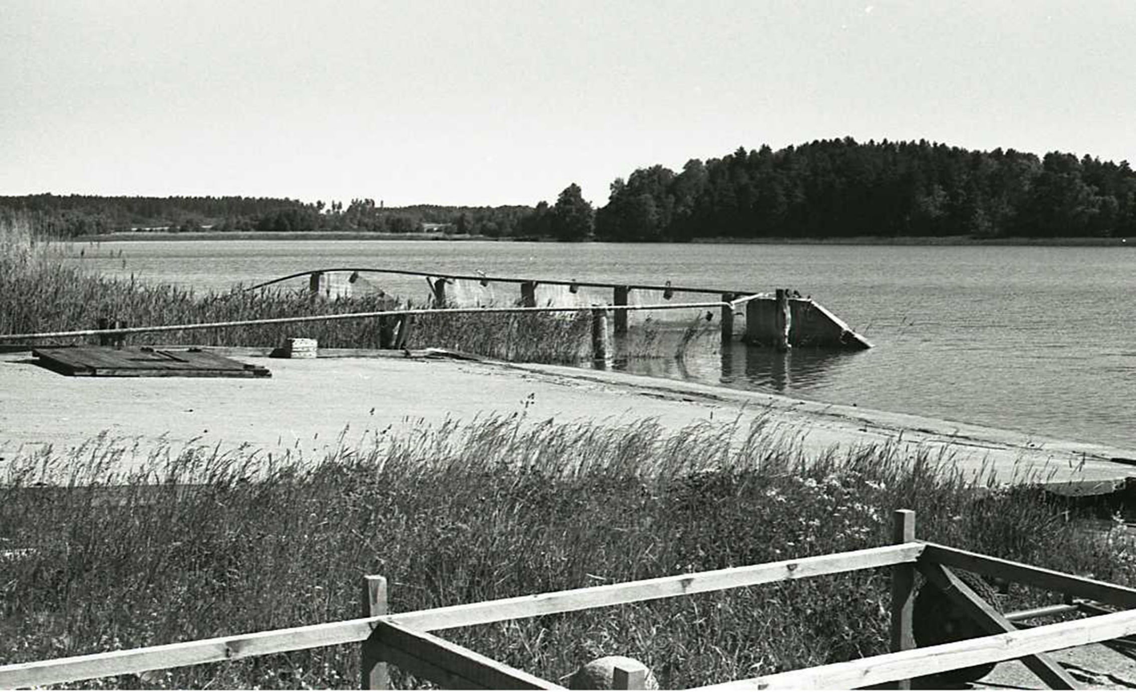
Bild 13. Slipen.