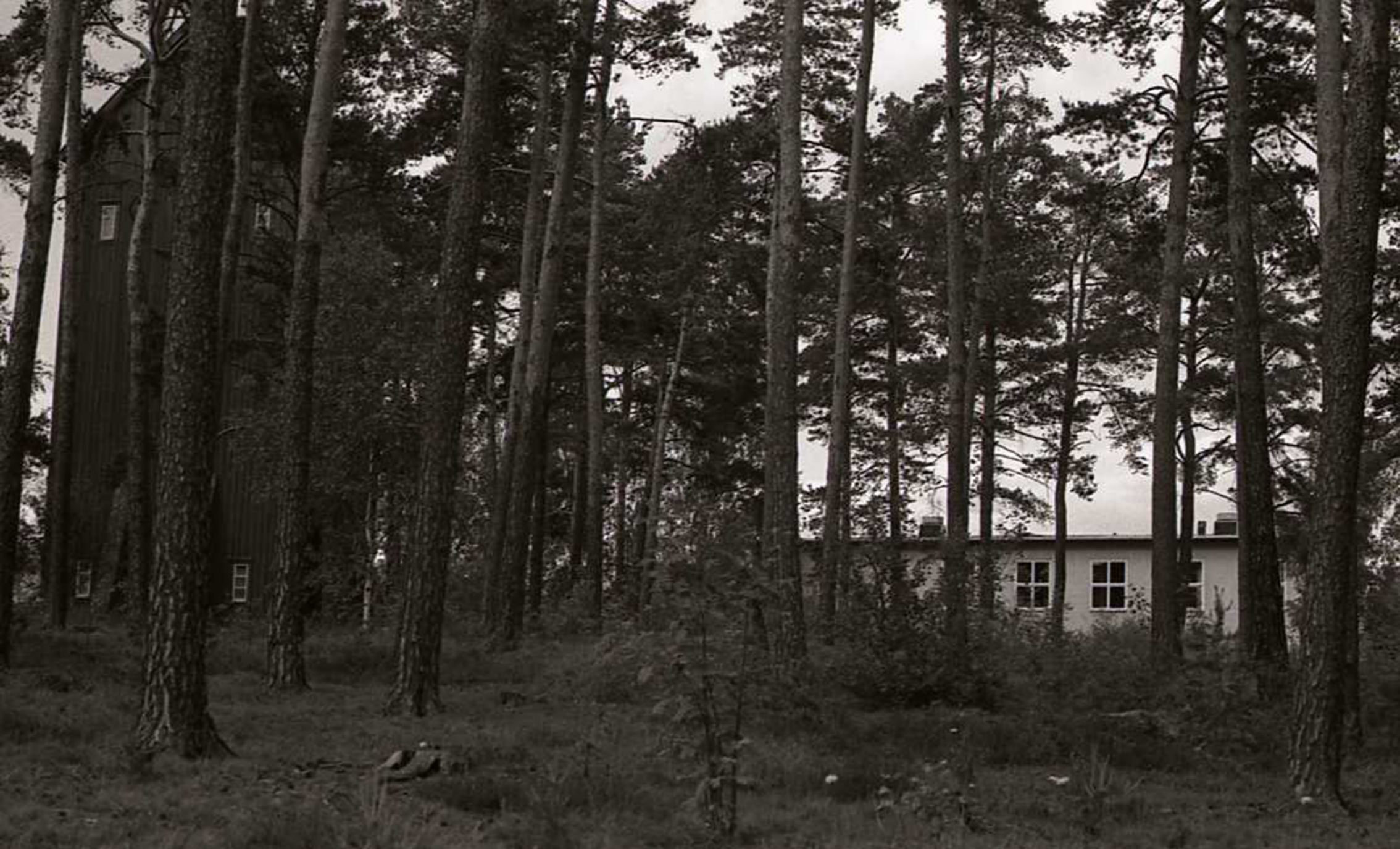
Bild 83. Vattentornet Skolhuset Från söder.