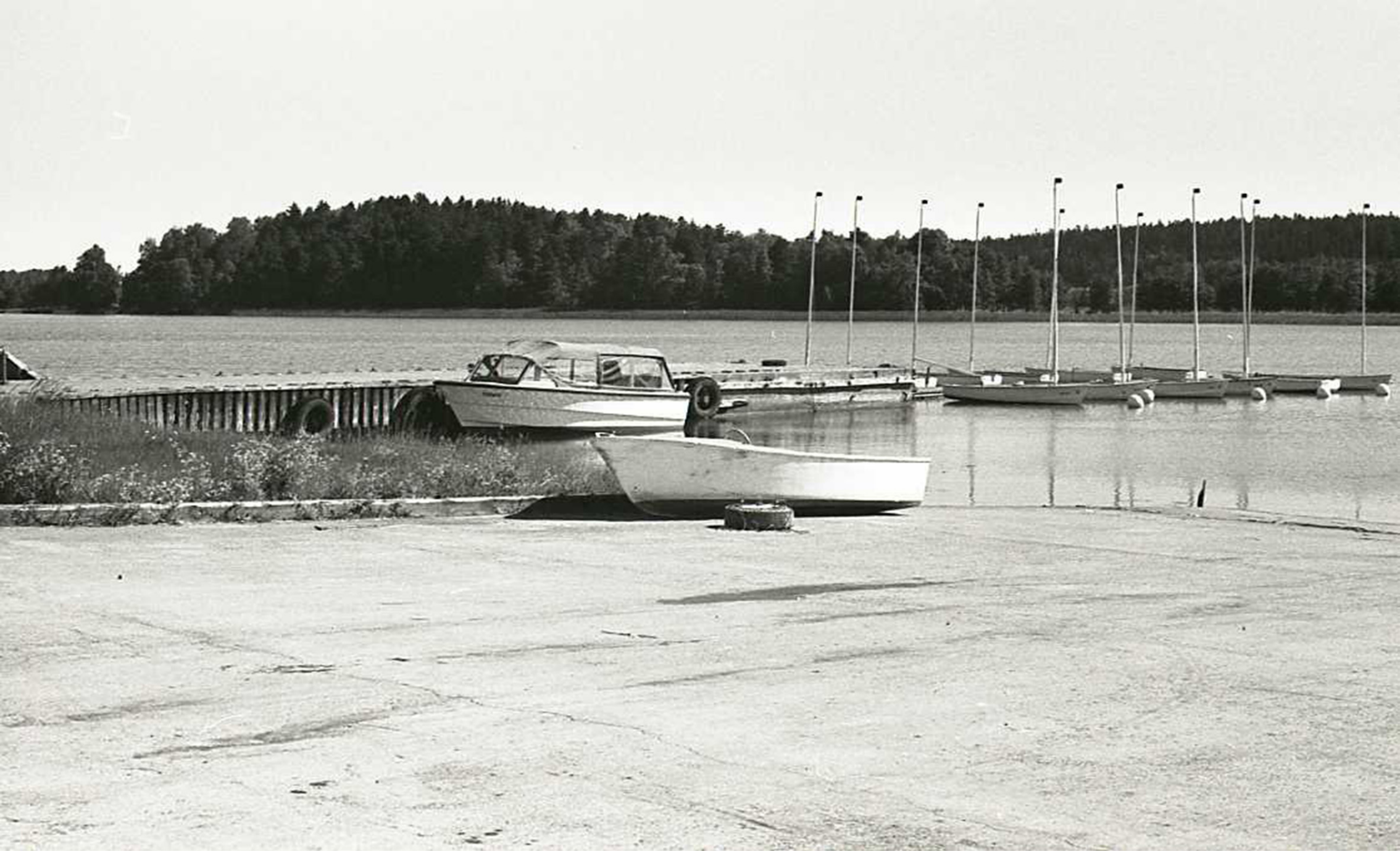
Bild 14. Slipen.