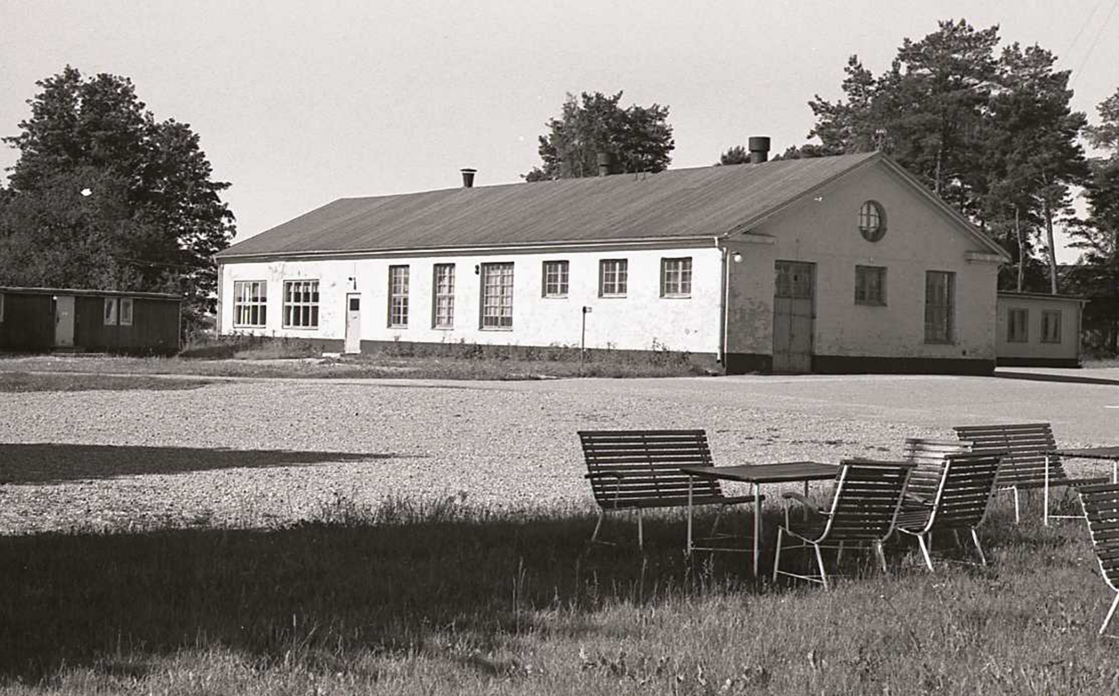
Bild 5. Gamla värmecentralen. Sen vapenverkstad. Slutligen STRILS lektionssalar.