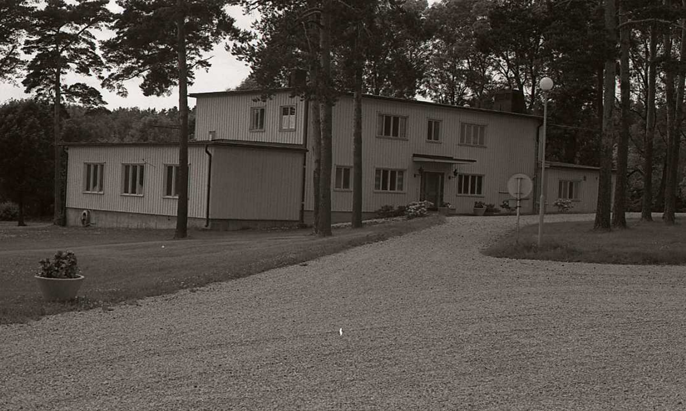
Bild 78. Offmässen.