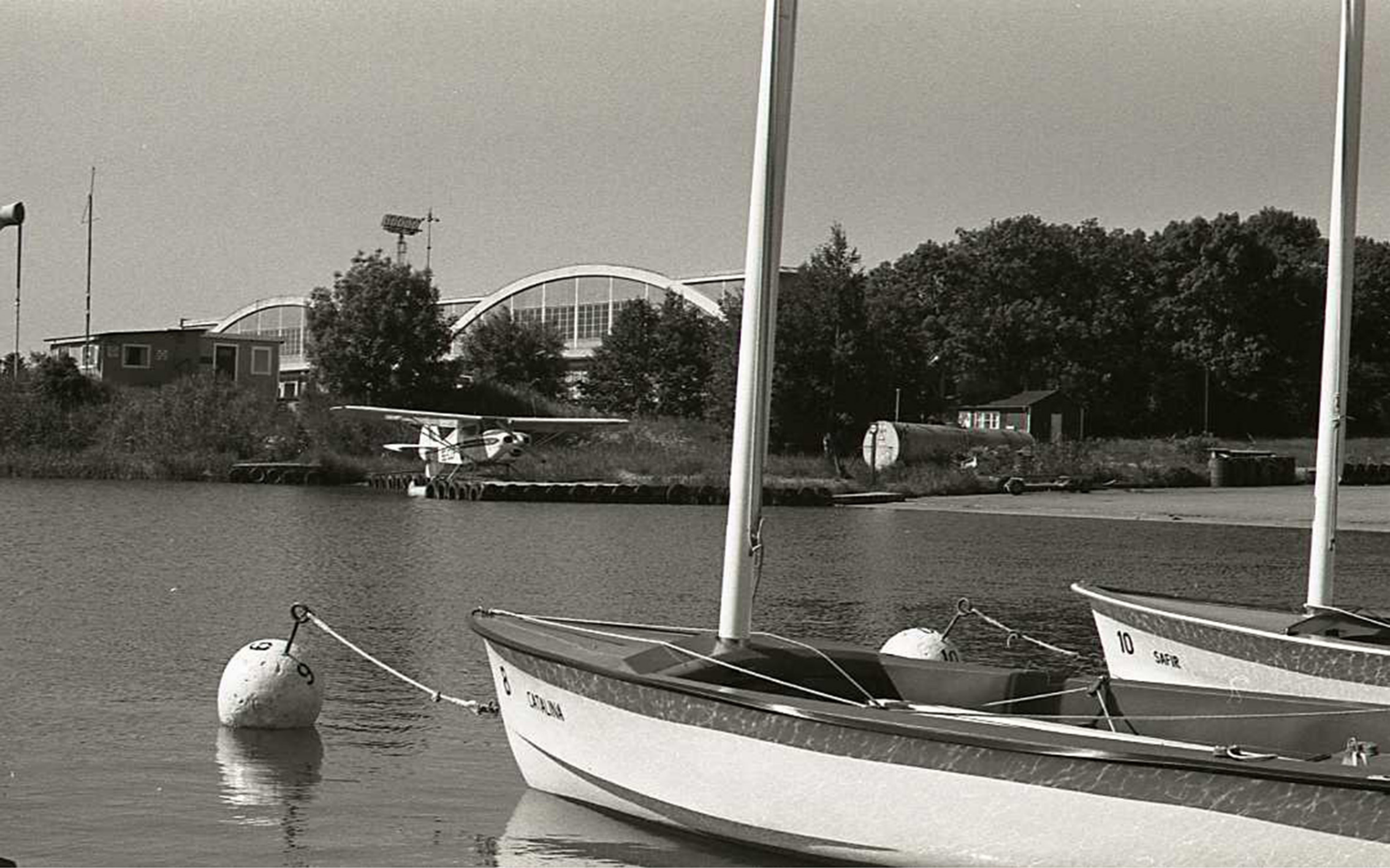
Bild 22. Hangar 81. F2 PJ-21 för STRILS utbildning.