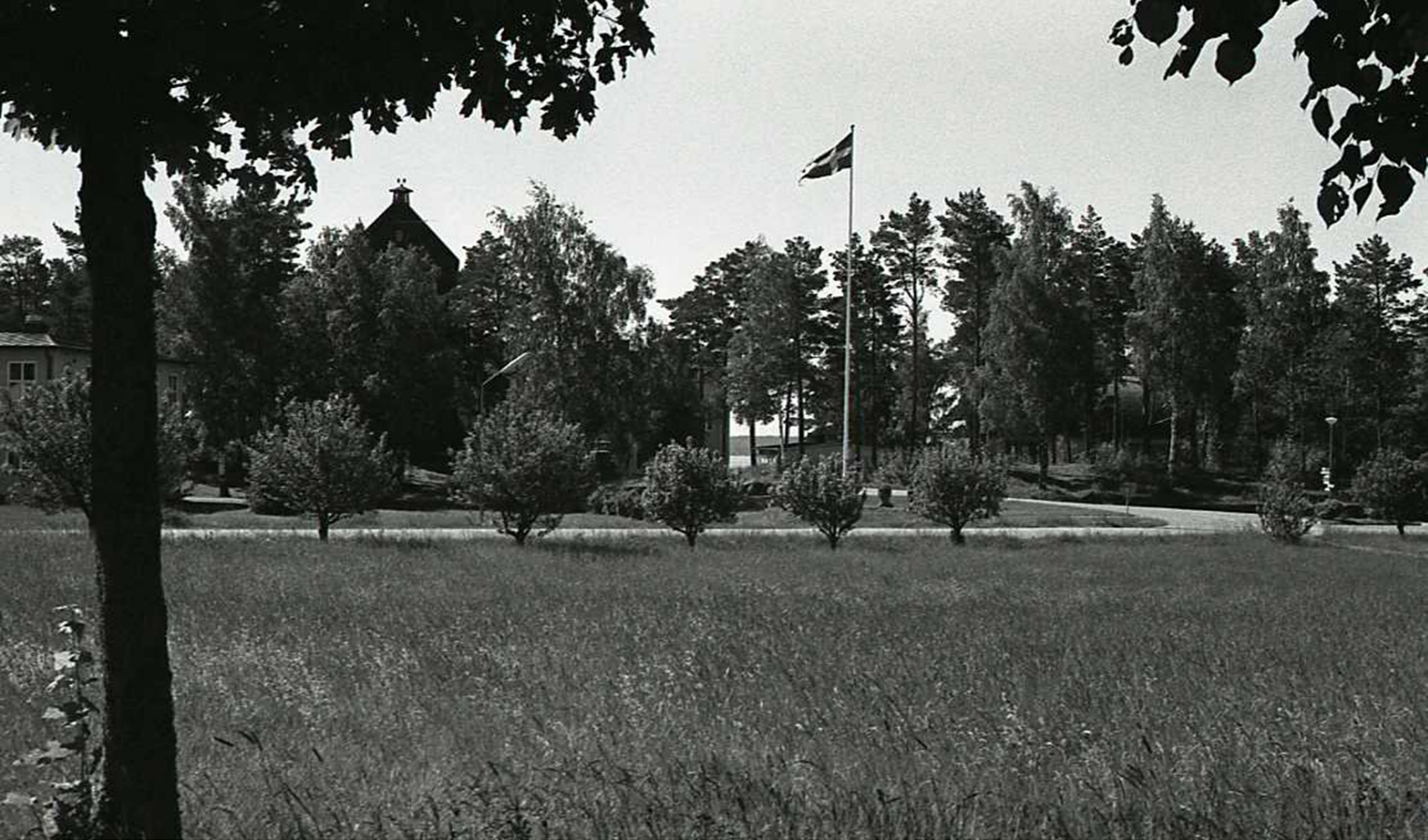
Bild 43. F2 fana . Här halades den 30 juni 1974.