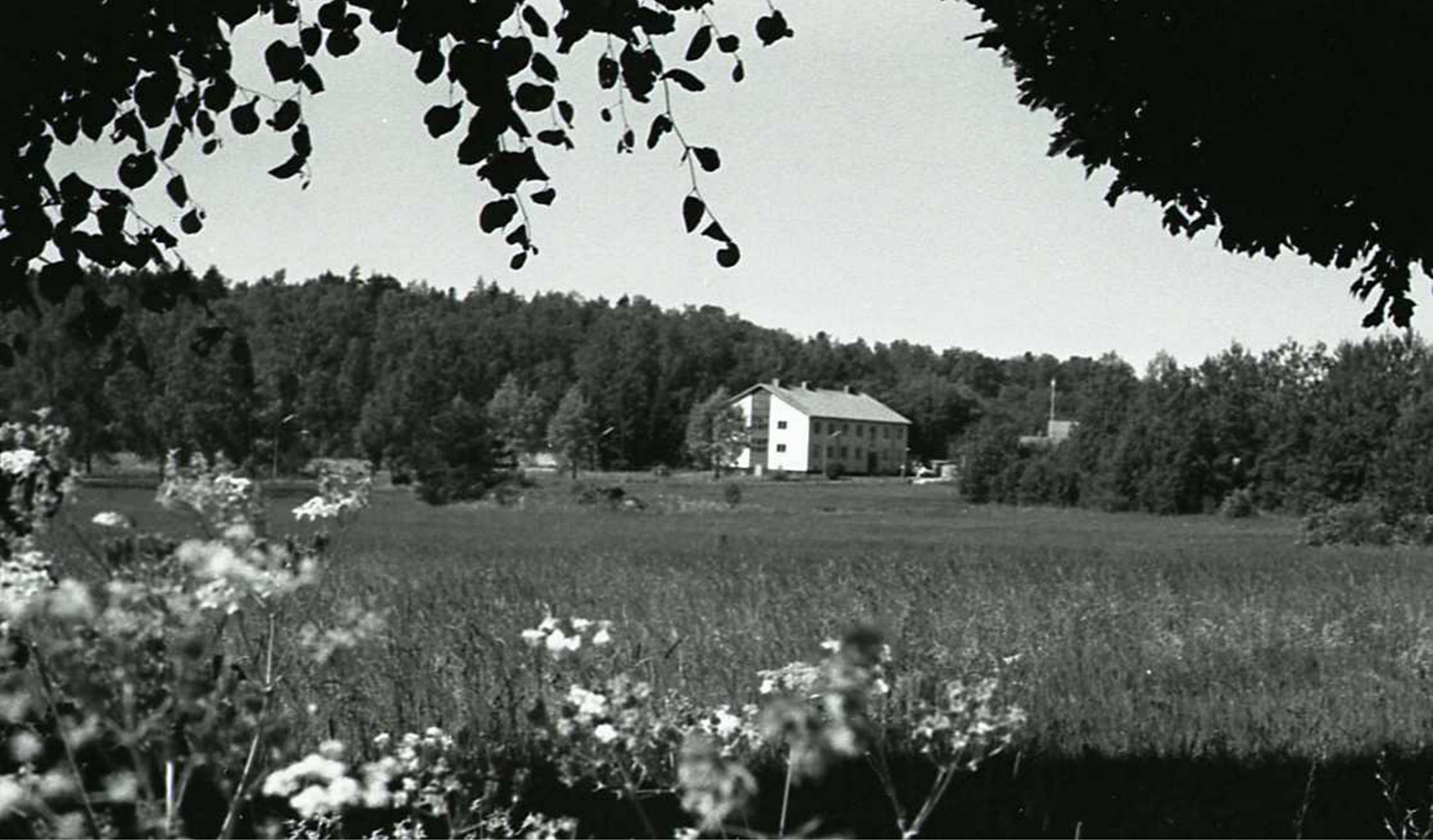
Bild 41. Kasern 8. Vakten.