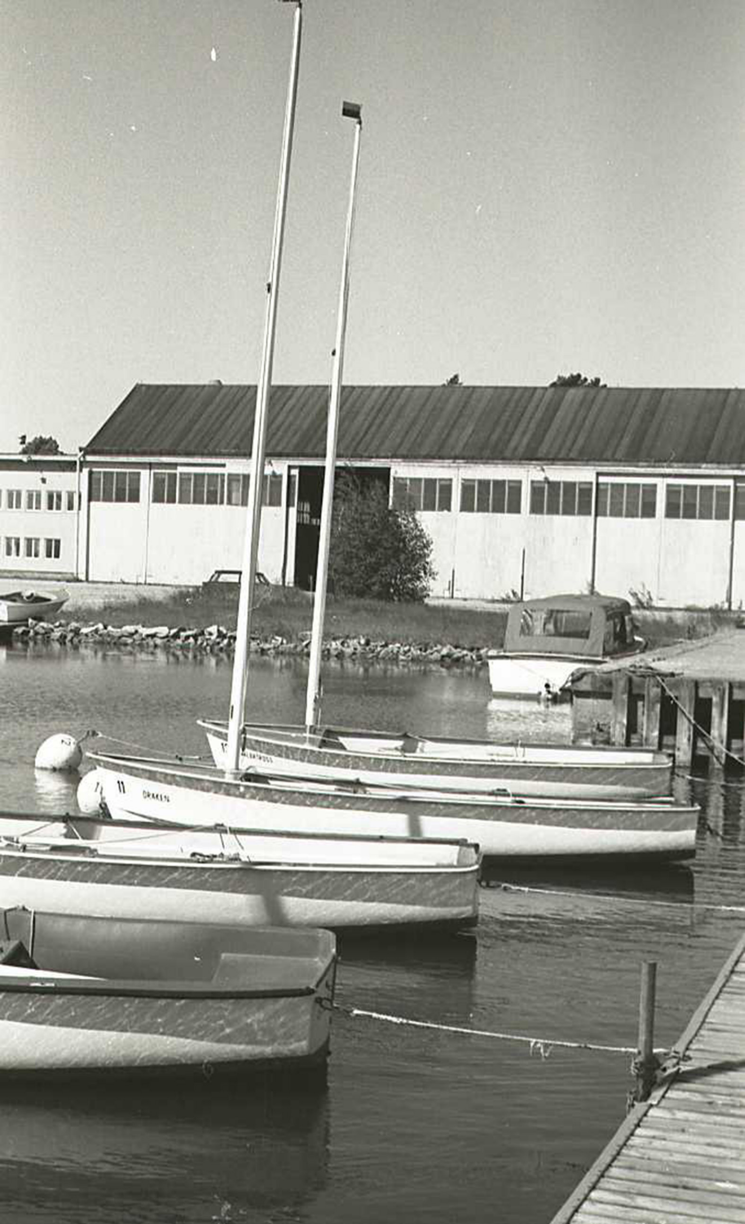
Bild 12. Hangar 82. F2 Trissjollar.