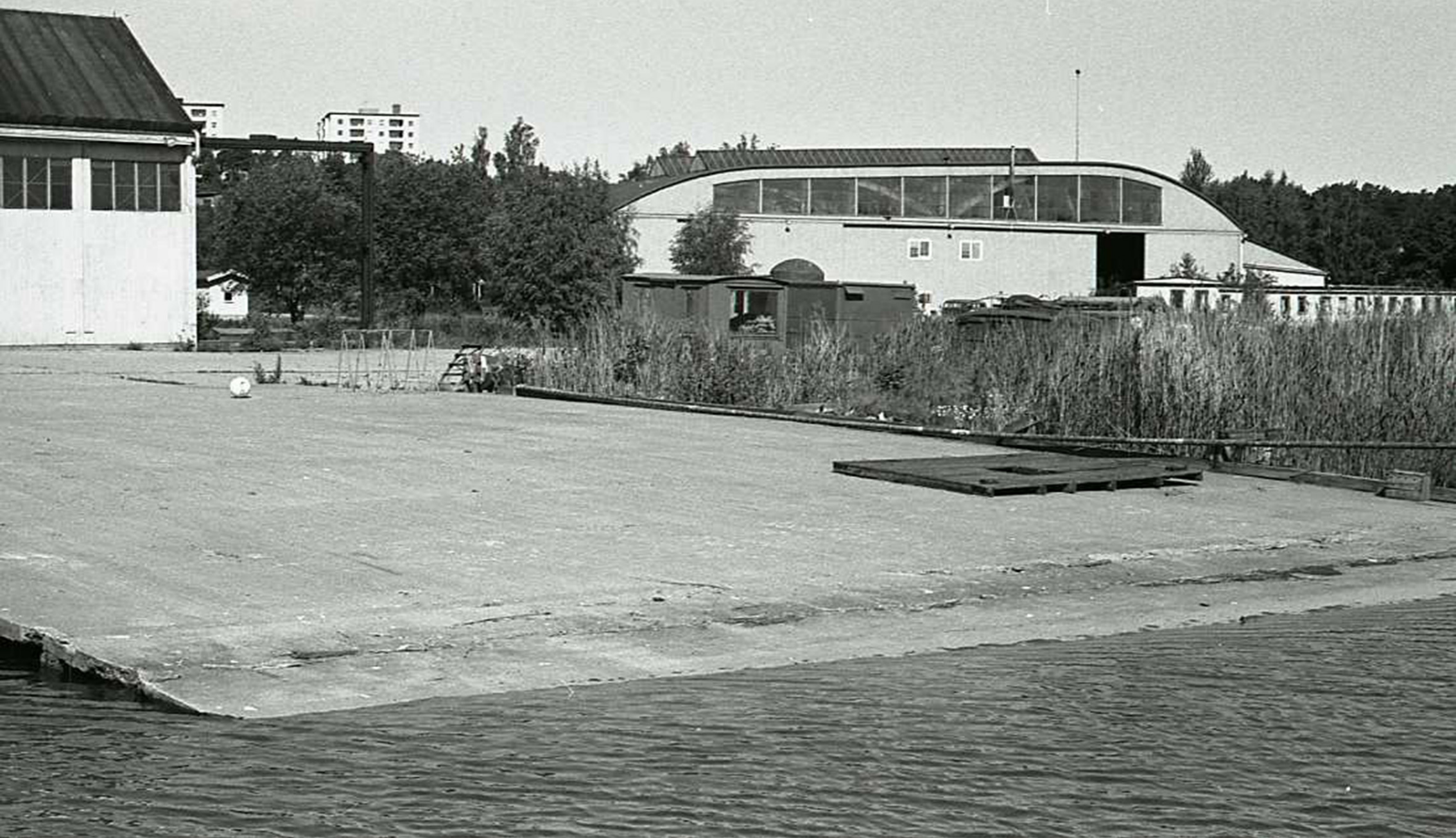
Bild 20. Hangar 82. Avd 6.