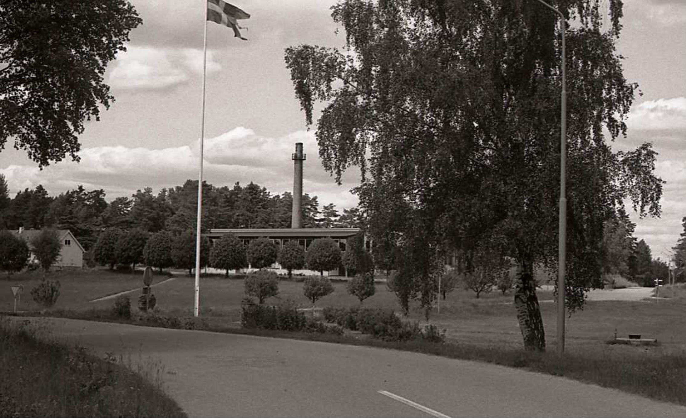
Bild 86. Matsalen Personalbostäder t v.