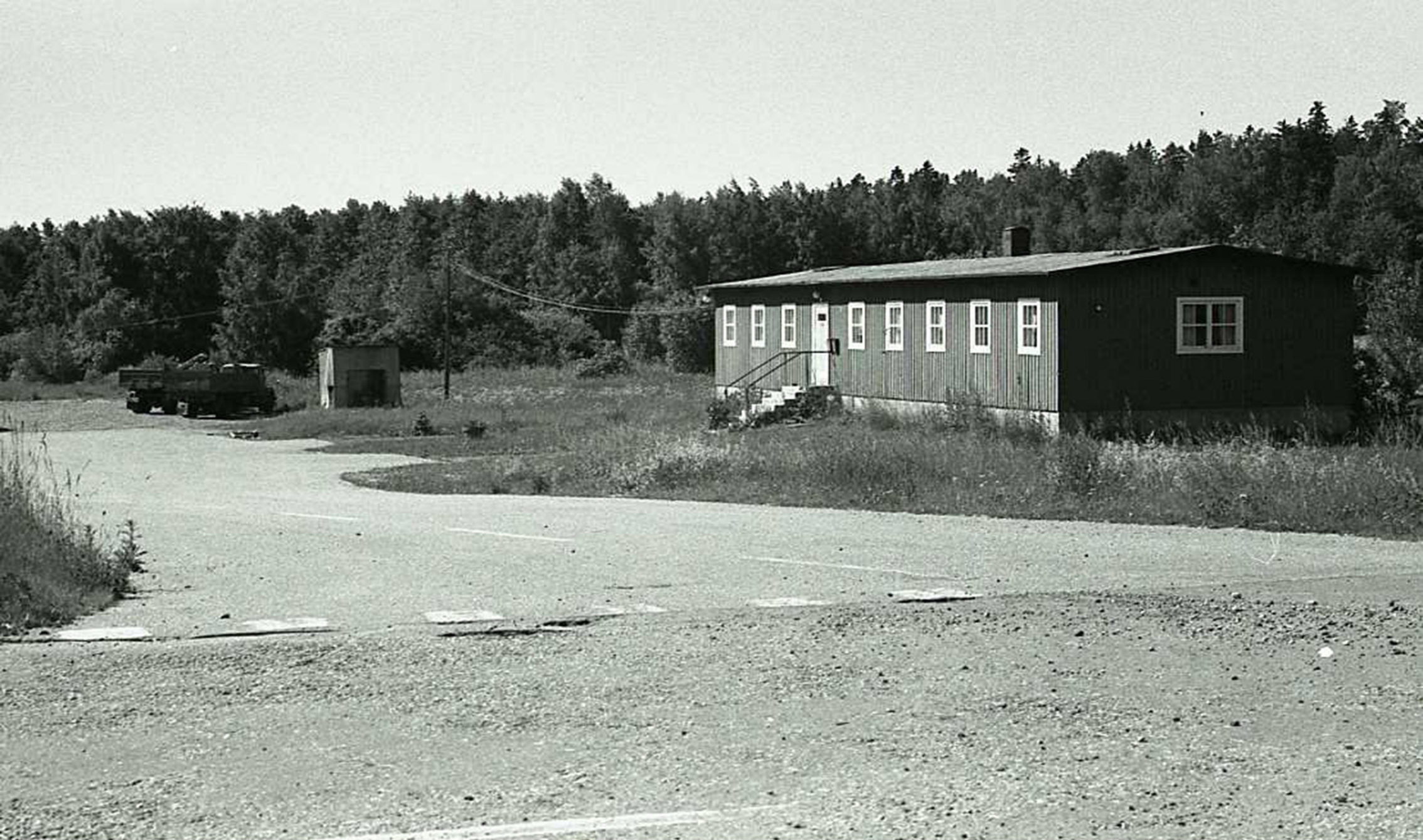
Bild 51. Barack 34.