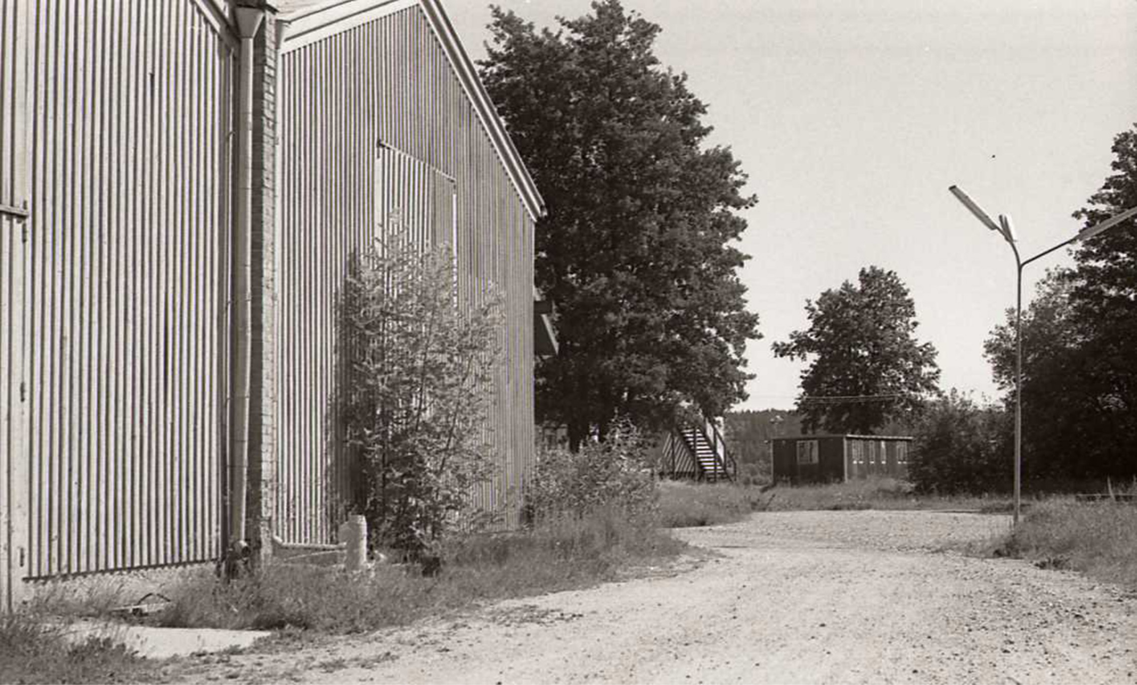
Bild 60. Gamla trähangarernas gavlar mot söder.