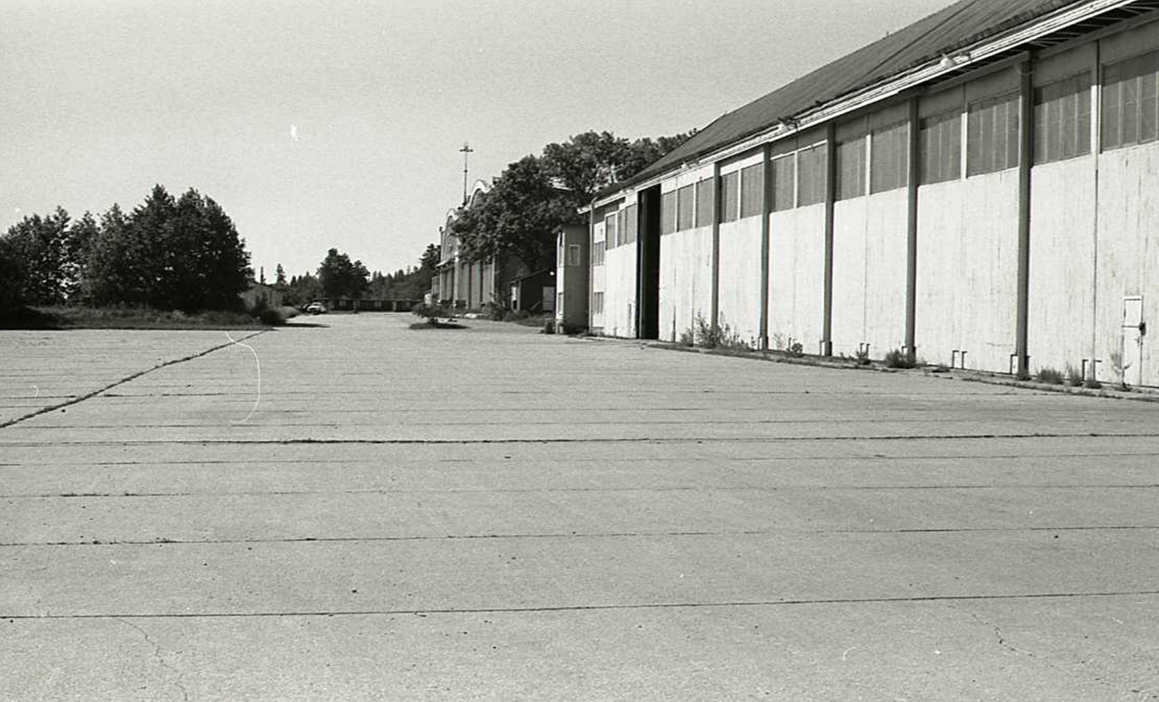
Bild 18. Hangar 81. Klar 1929. FTTS barack 36 (B36) framför. På plattan startade sportflygplan efter byte till hjul från pontoner.