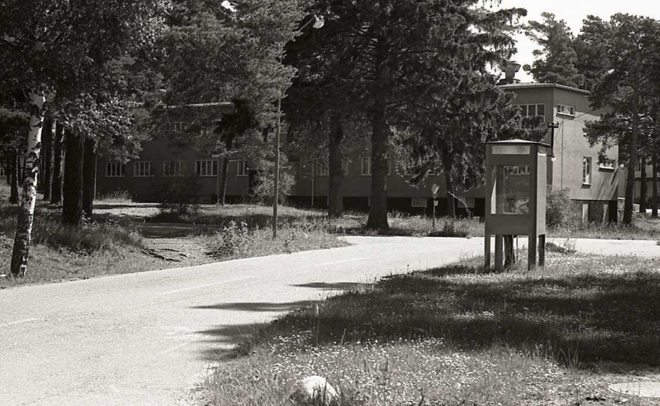
Bild 37. Kasern 23. Telefonkiosk.