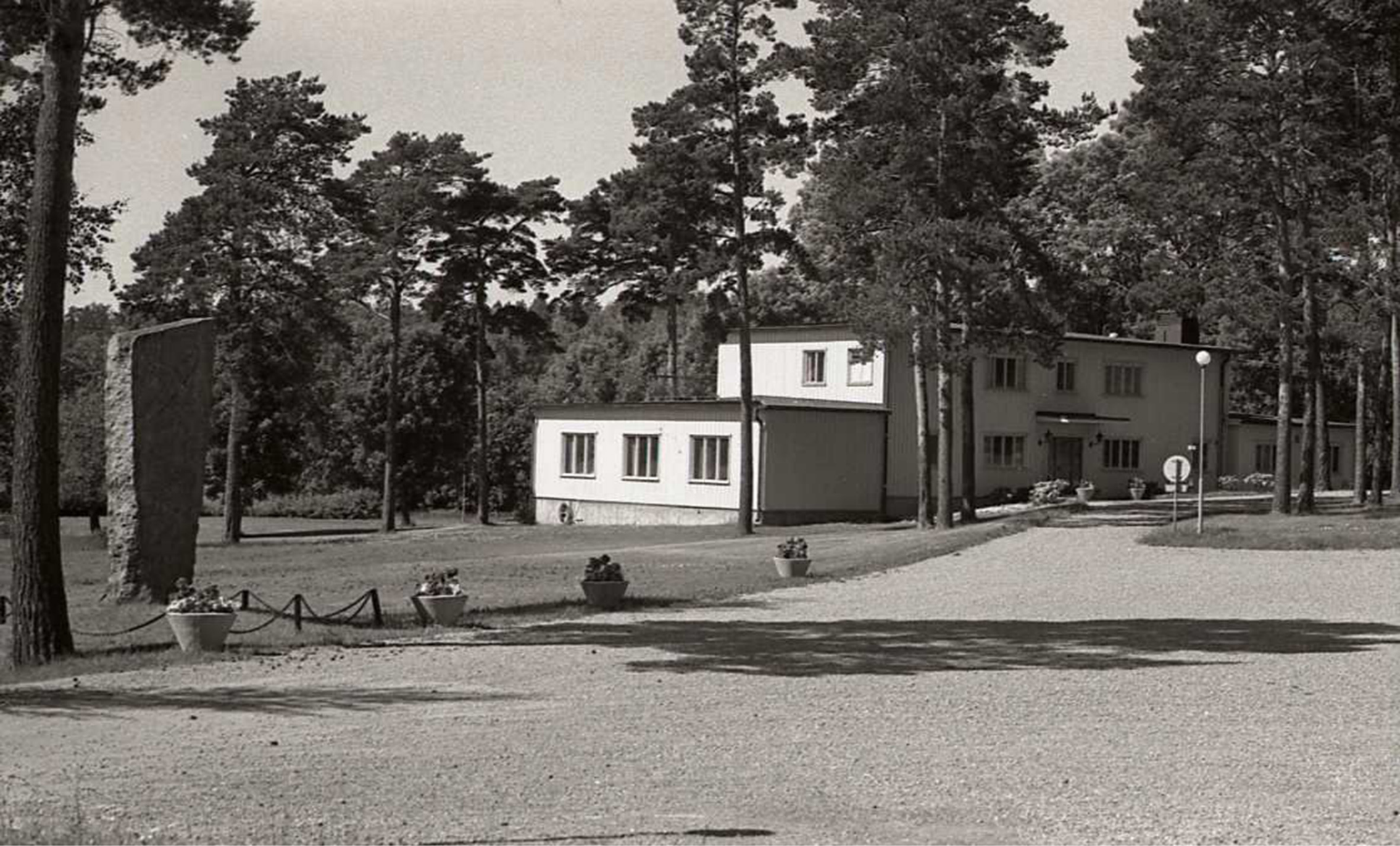
Bild 61. Minnessten och offmässen.