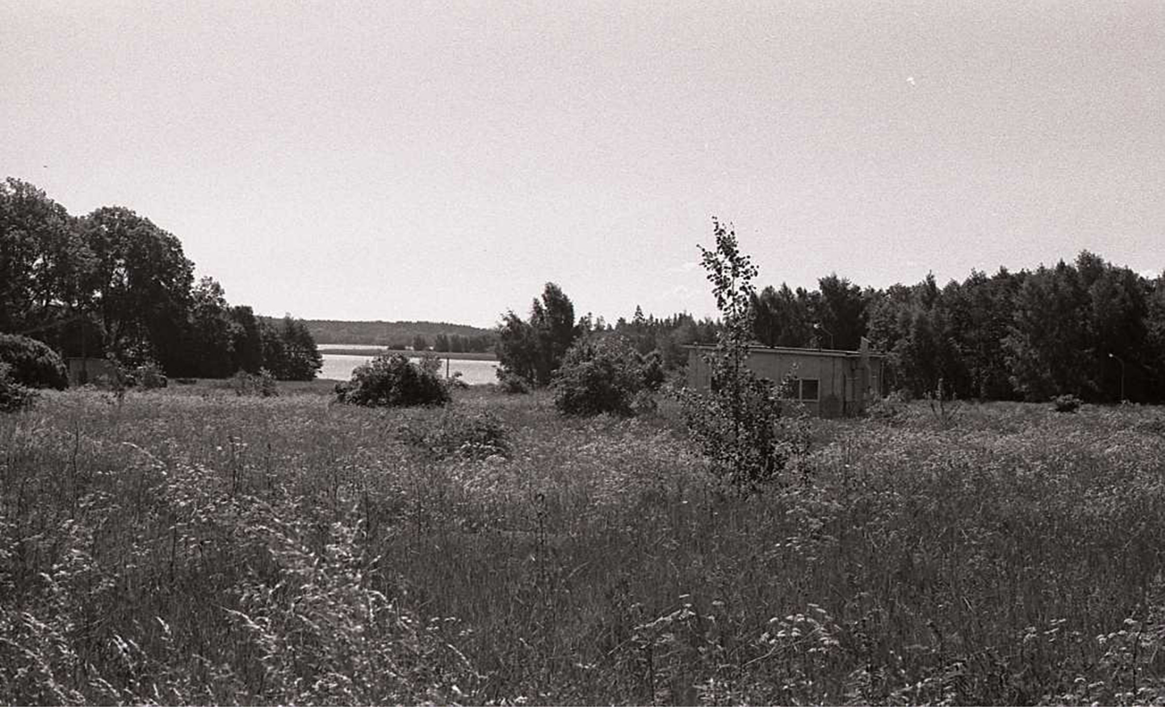
Bild 55. Radiostationen.