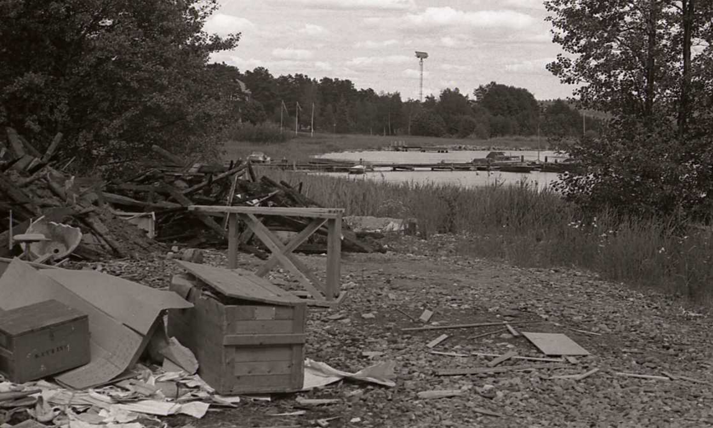
Bild 69. Eldplatsen.