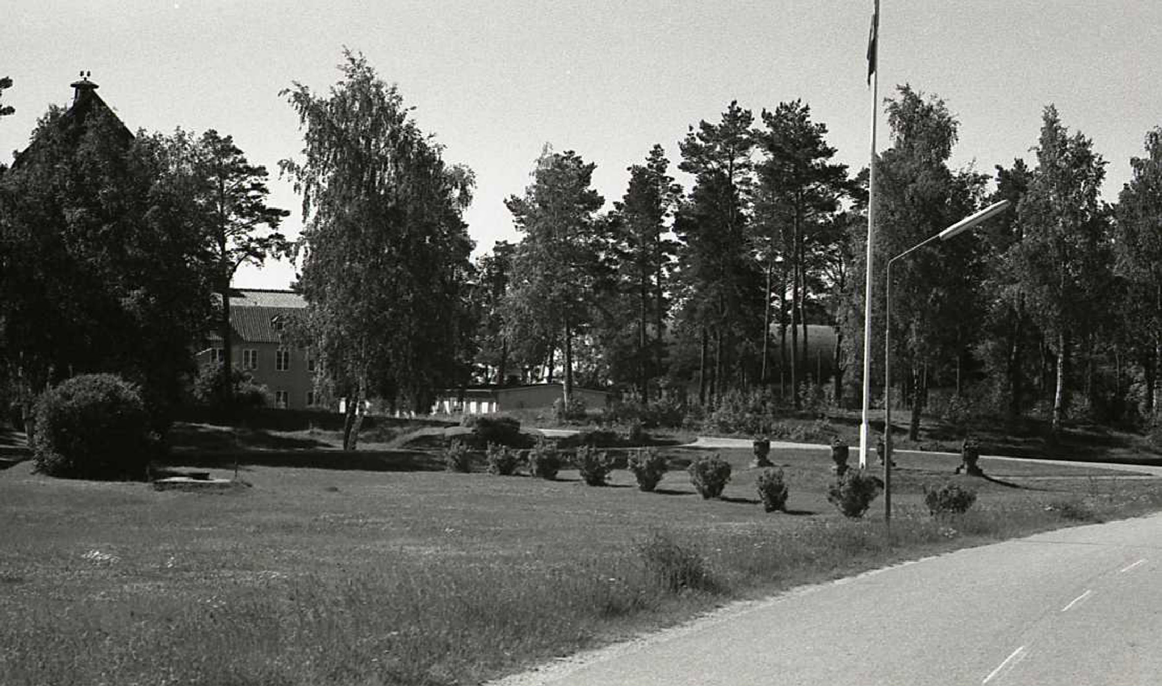
Bild 49. Vattentornet Kanslihuset FTTS barack Gymnastiksalen.