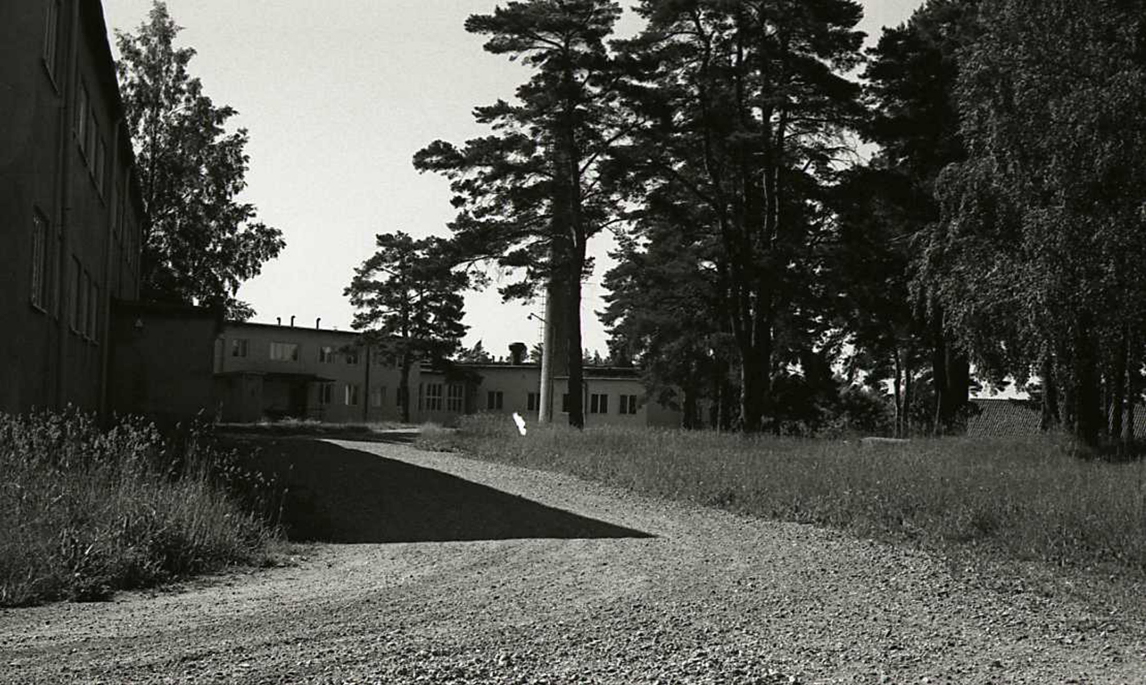
Bild 24. Baksidan av matsalen. Sedd från norr.