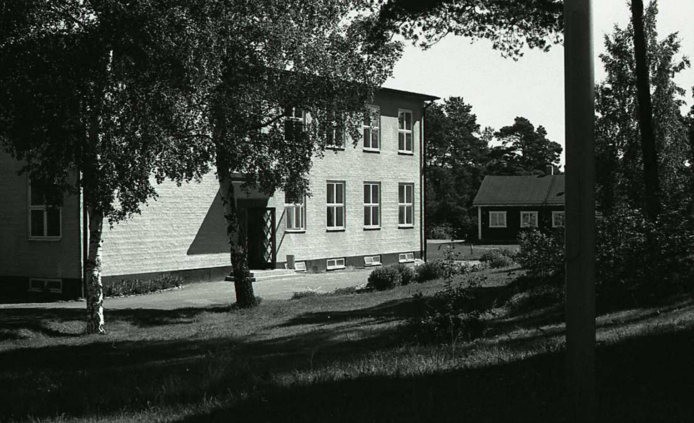
Bild 57. Skolhuset By 10.