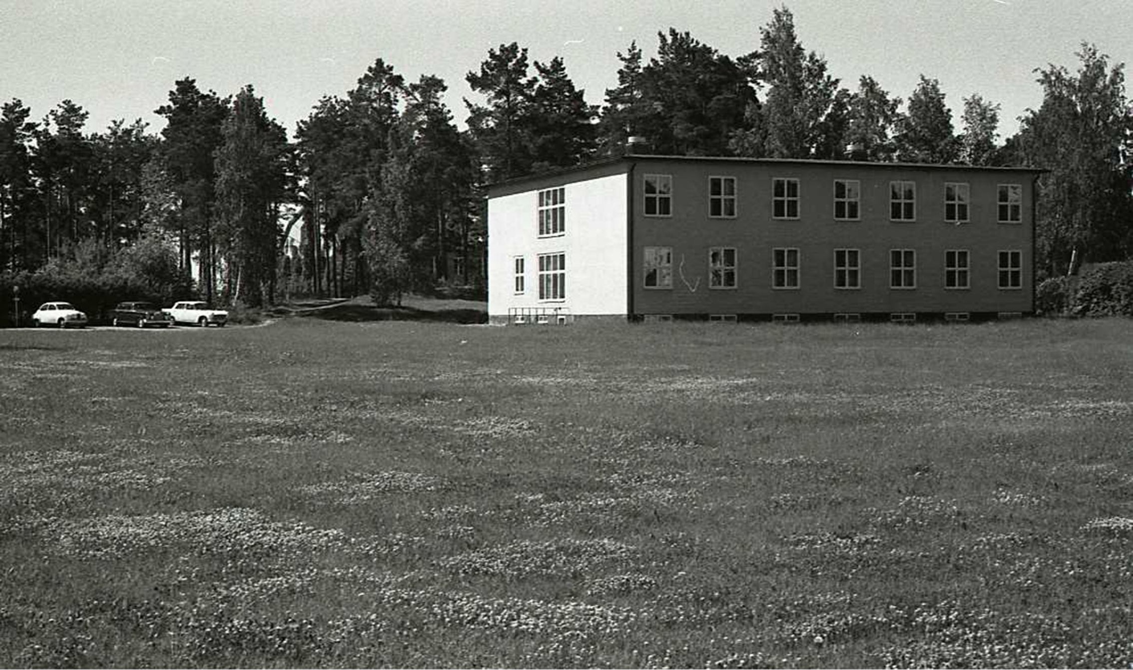
Bild 46. Skolhuset By 10.