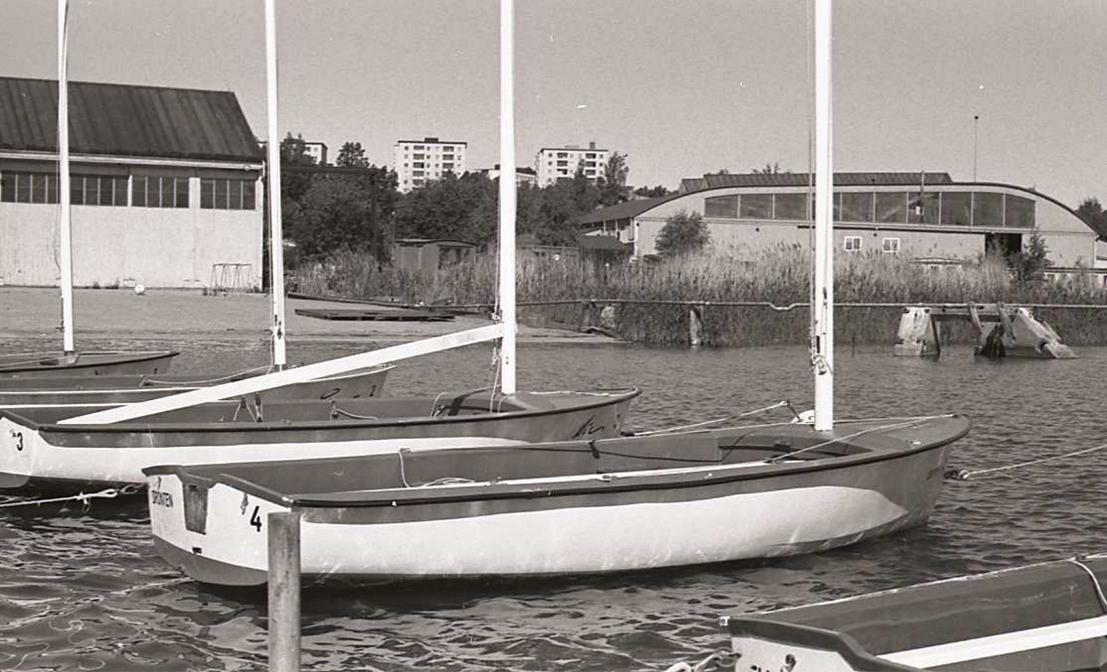
Bild 11. Hangar 82 Avd 6. F2 Trissjollar.