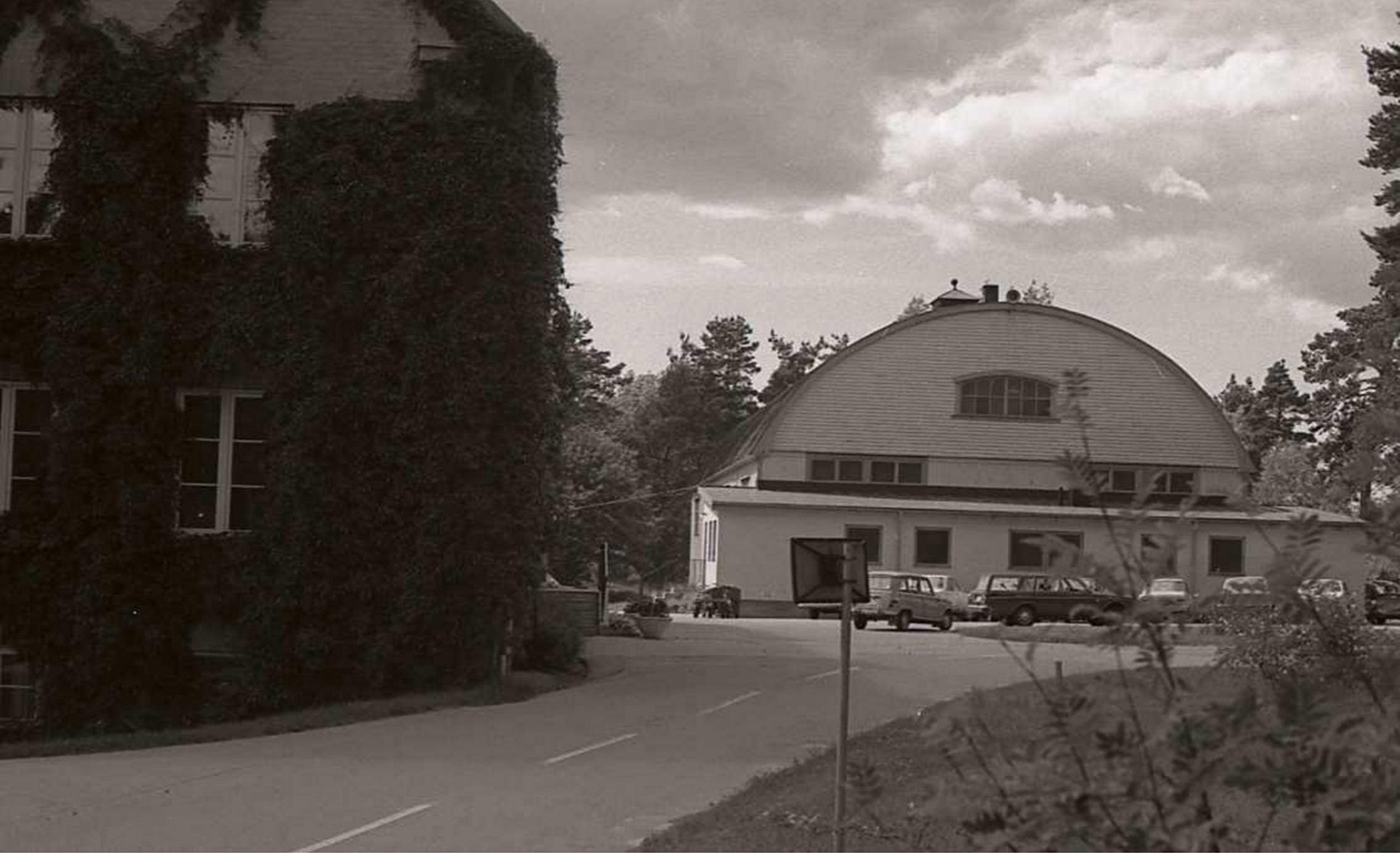
Bild 84. Kanslihuset Gymnastiksalen.