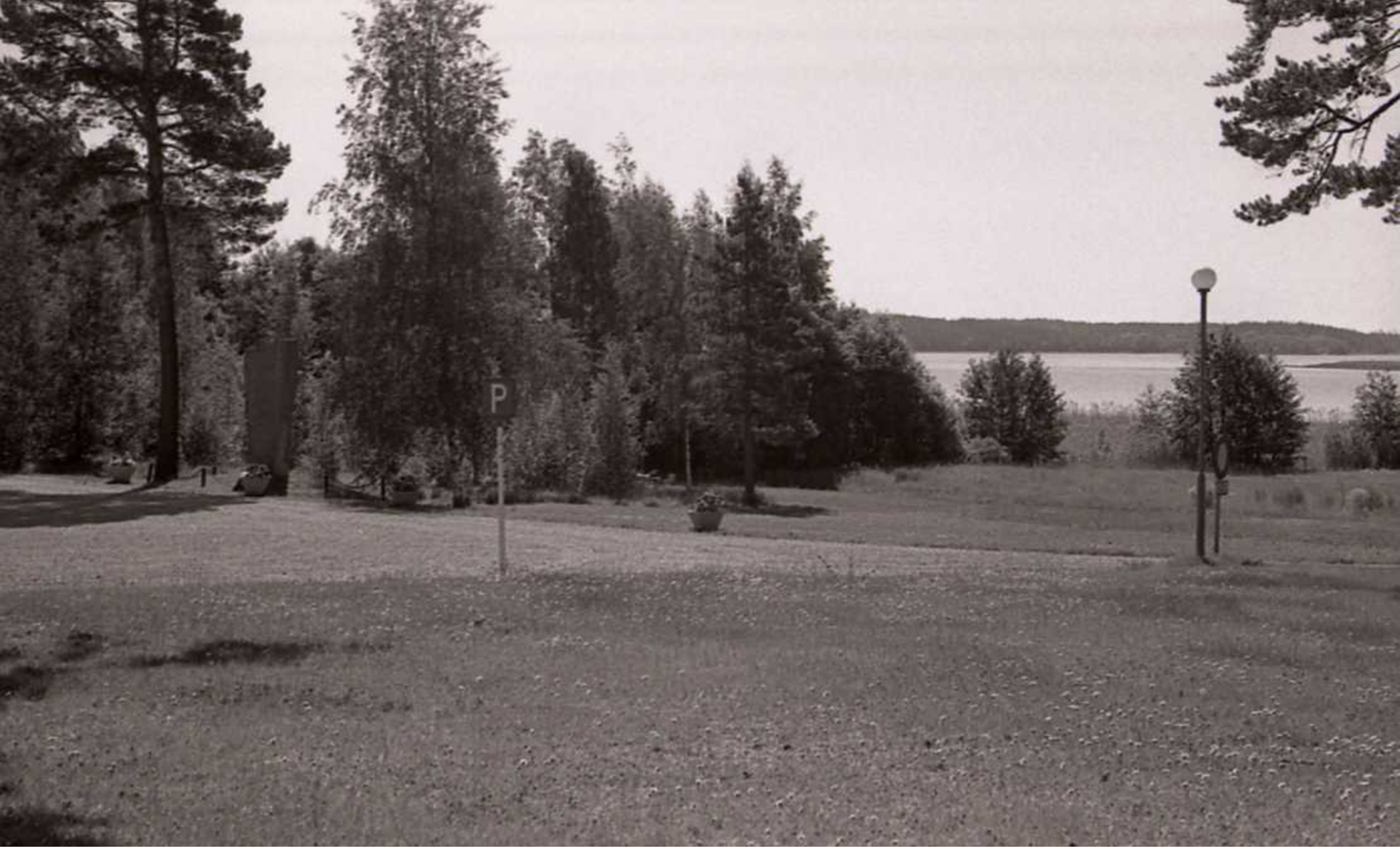
Bild 59. Minnesstenen Parkeringen söder kanslihuset.