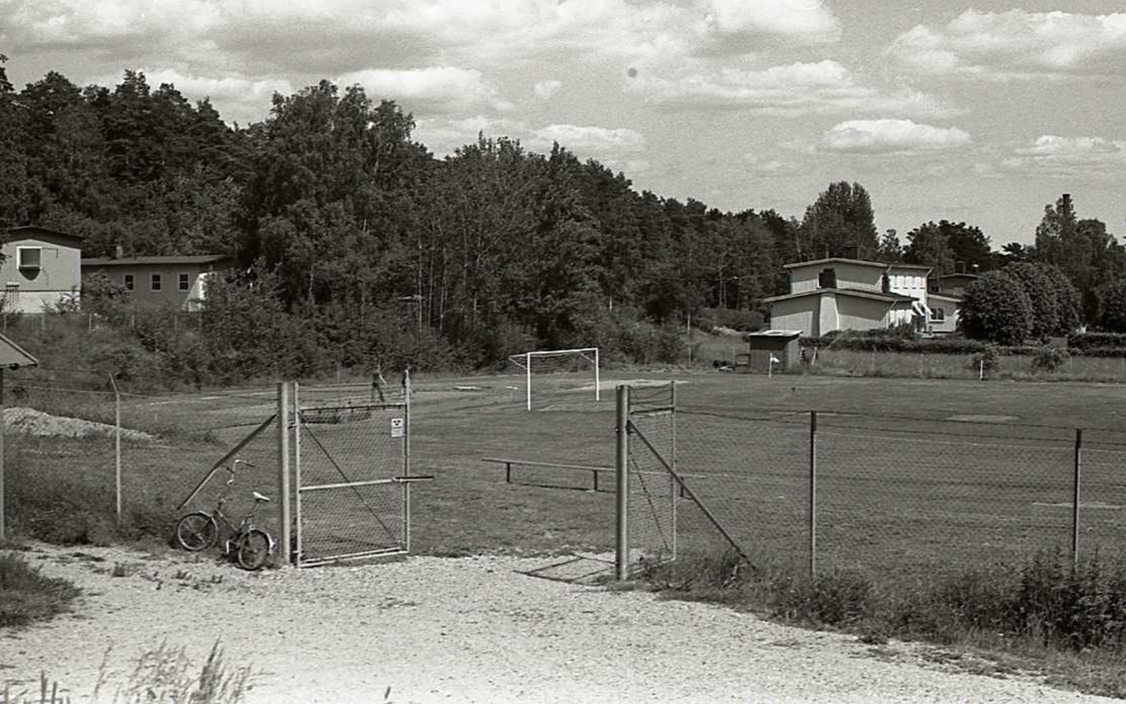
Bild 65. FTTS två baracker vid motorvägen F2 IP Uoffmässen.