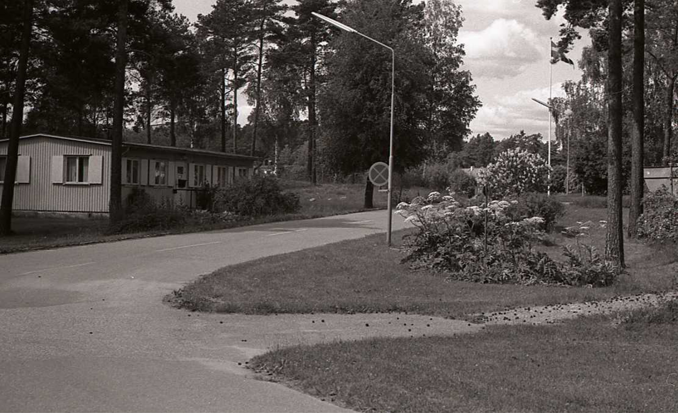
Bild 85. FTTS barack.