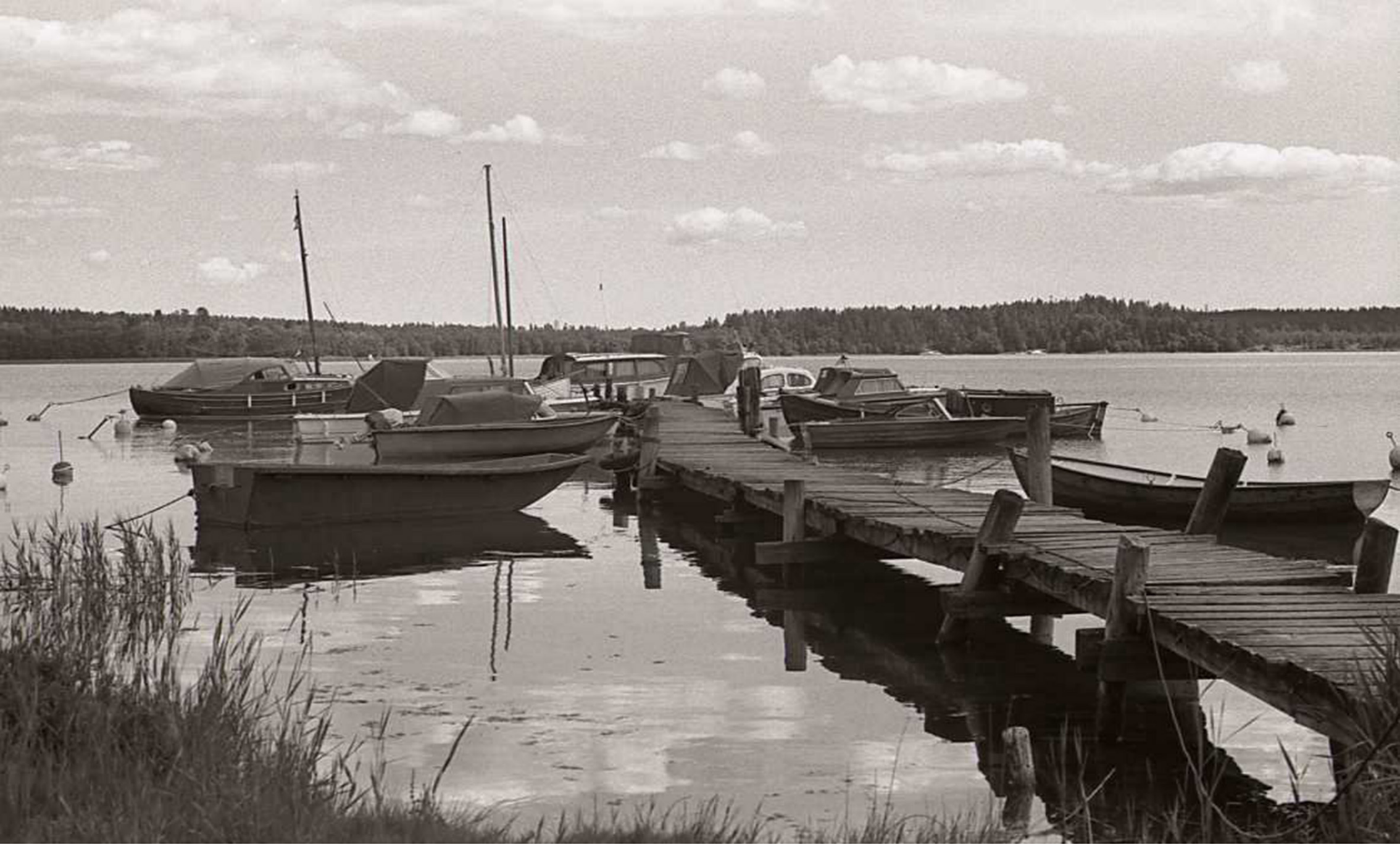
Bild 71. F2 båtklubb.