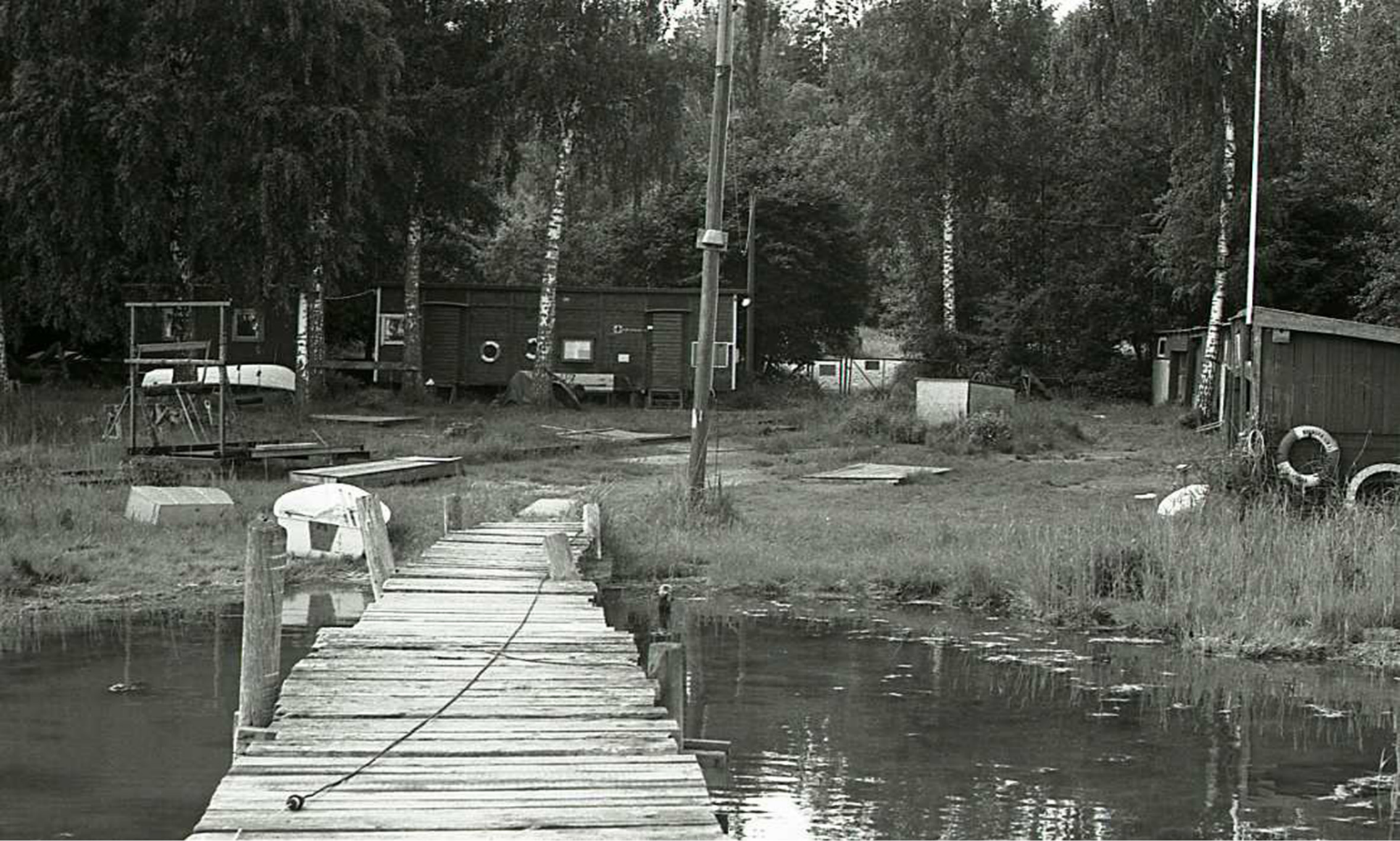
Bild 76. F2 båtklubb.