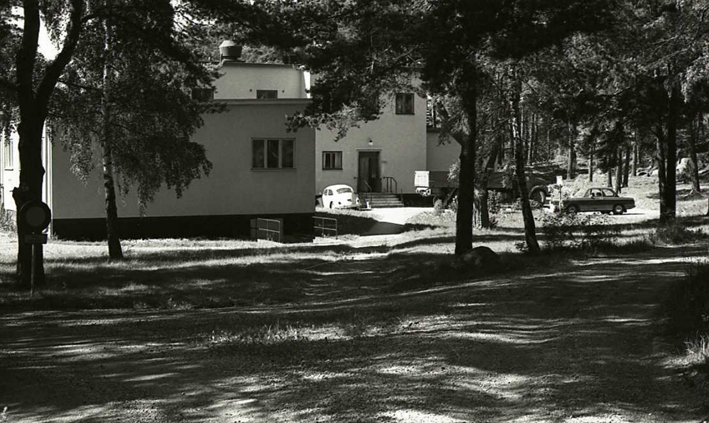
Bild 23. By 51. Sjukavdelningen.