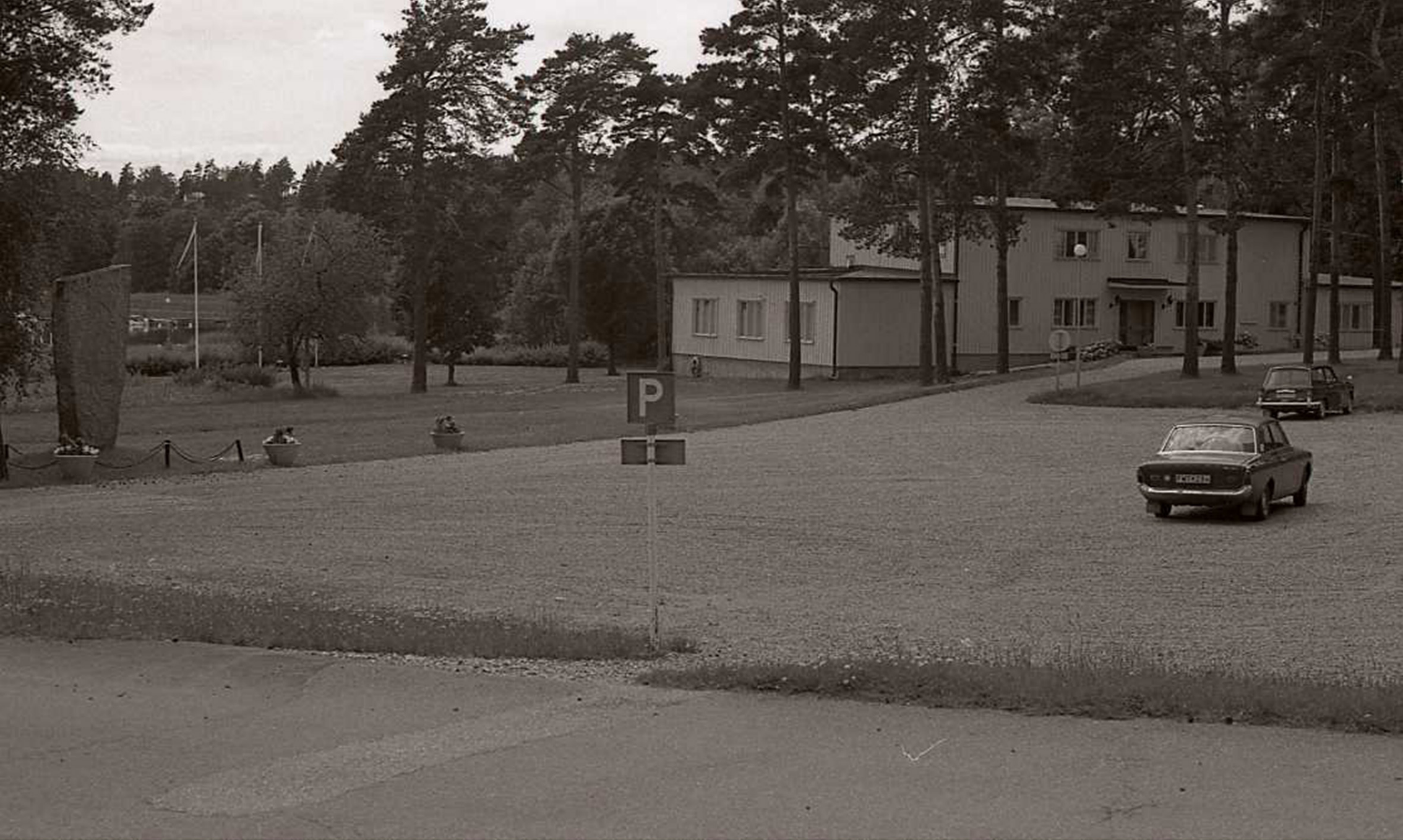
Bild 80. Minnesstenen Parkeringen söder kanslihuset Offmässen.