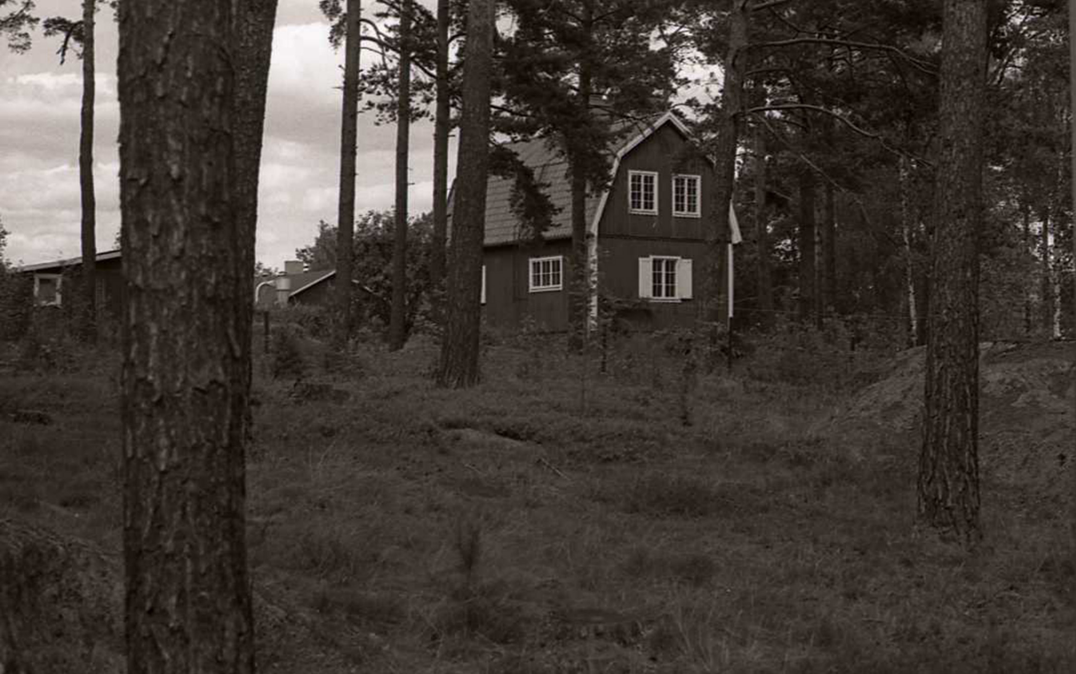
Bild 82. Förvaltarvillan.