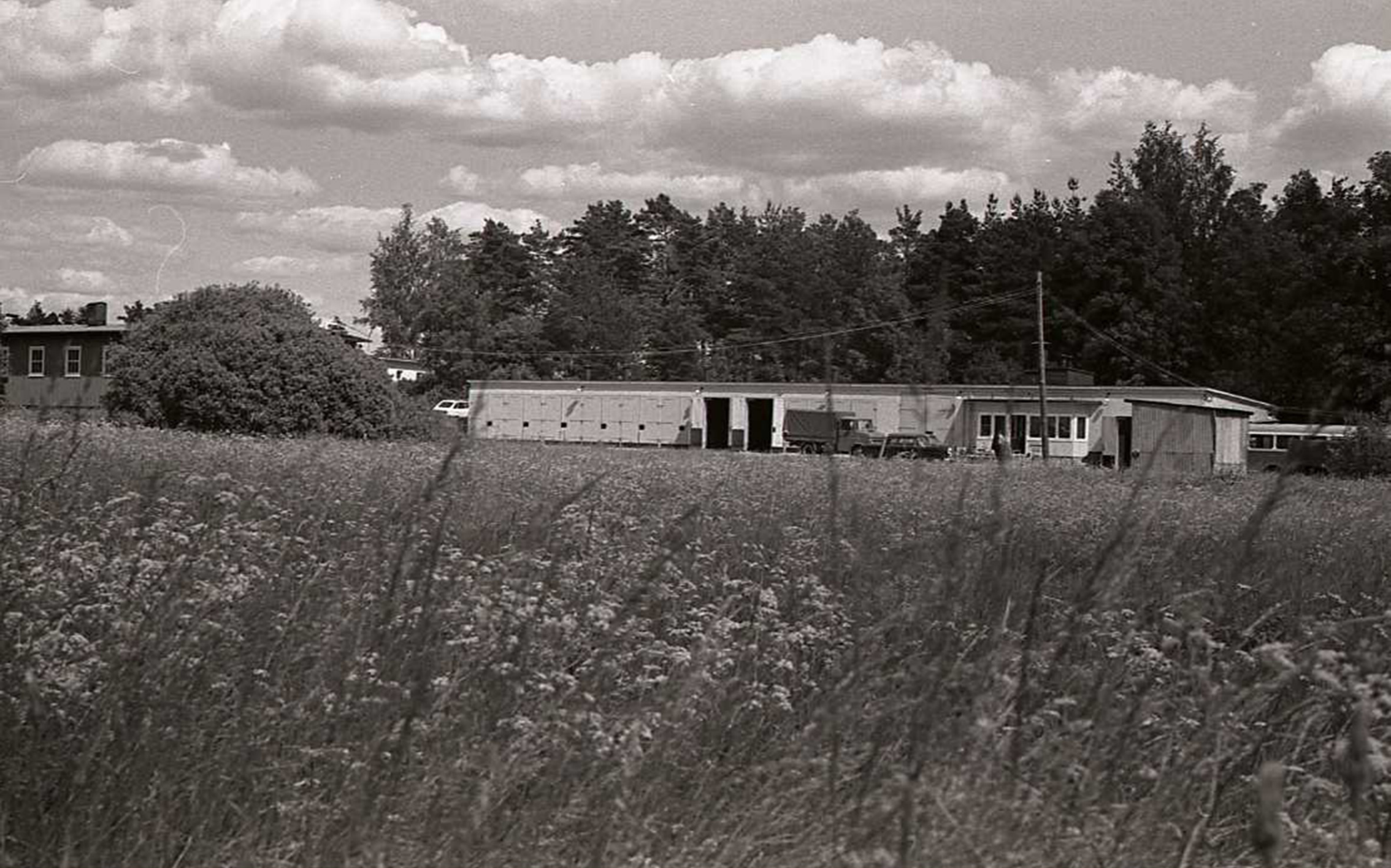
Bild 67. Barack 34 KörC.