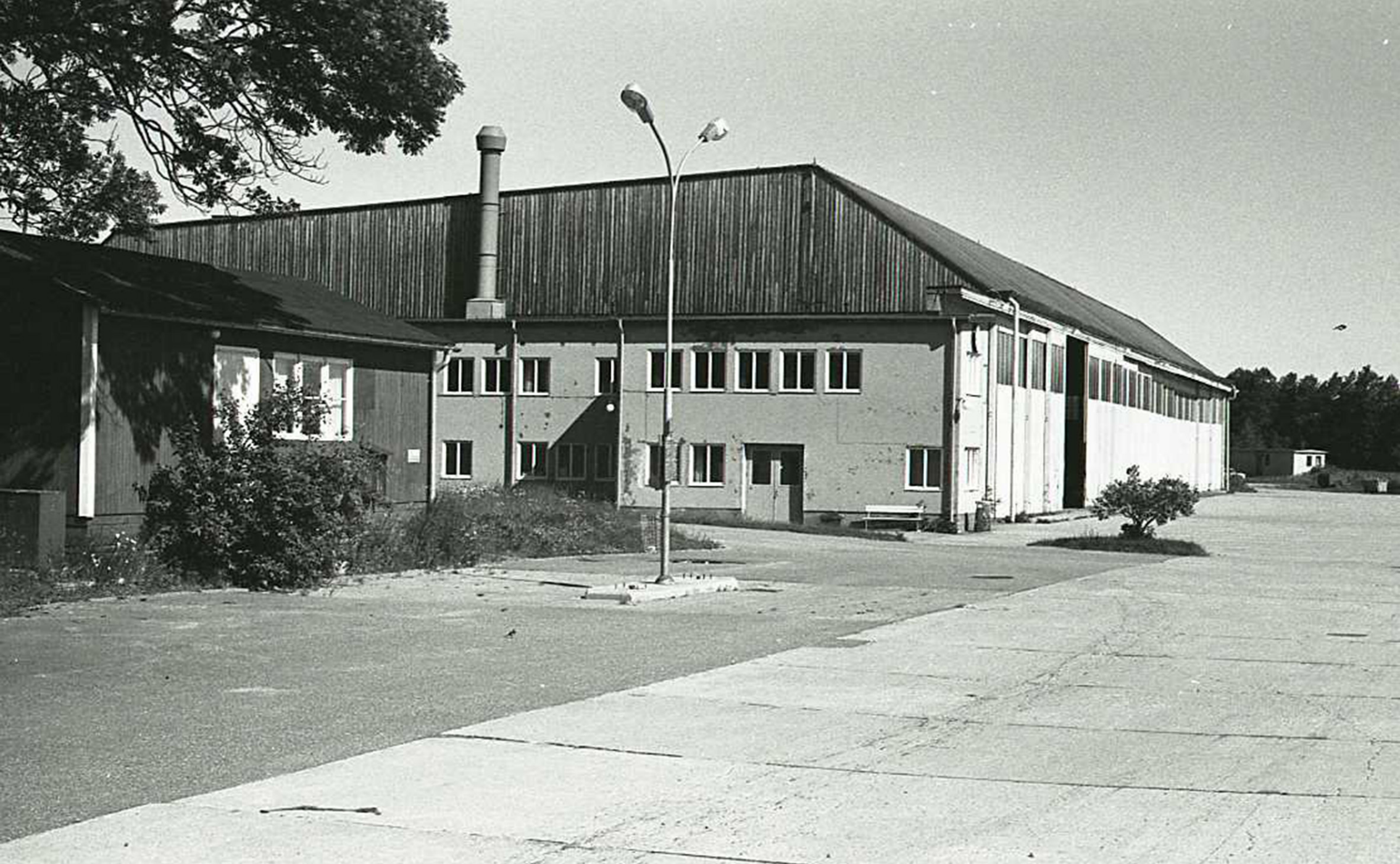
Bild 8. Hangar 82. Bensin station.