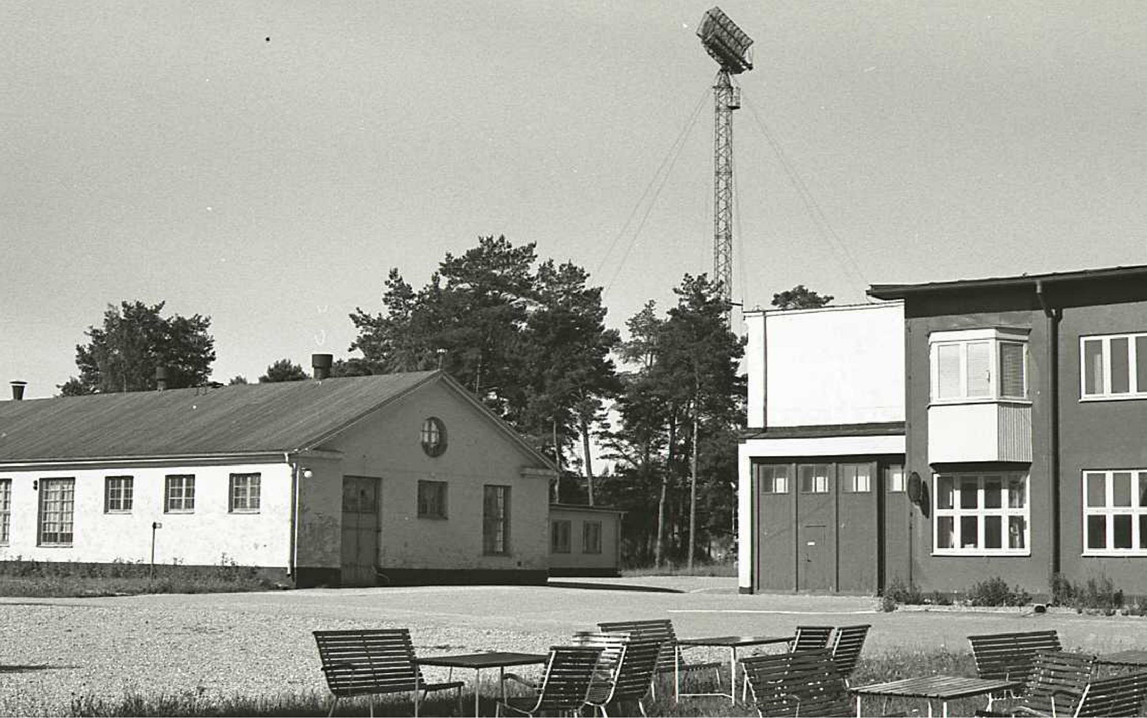
Bild 6. Gamla värmecentralen. Sen vapenverkstad. Slutligen STRILS lekt-salar. Simulator byggn. STRILS lärare.