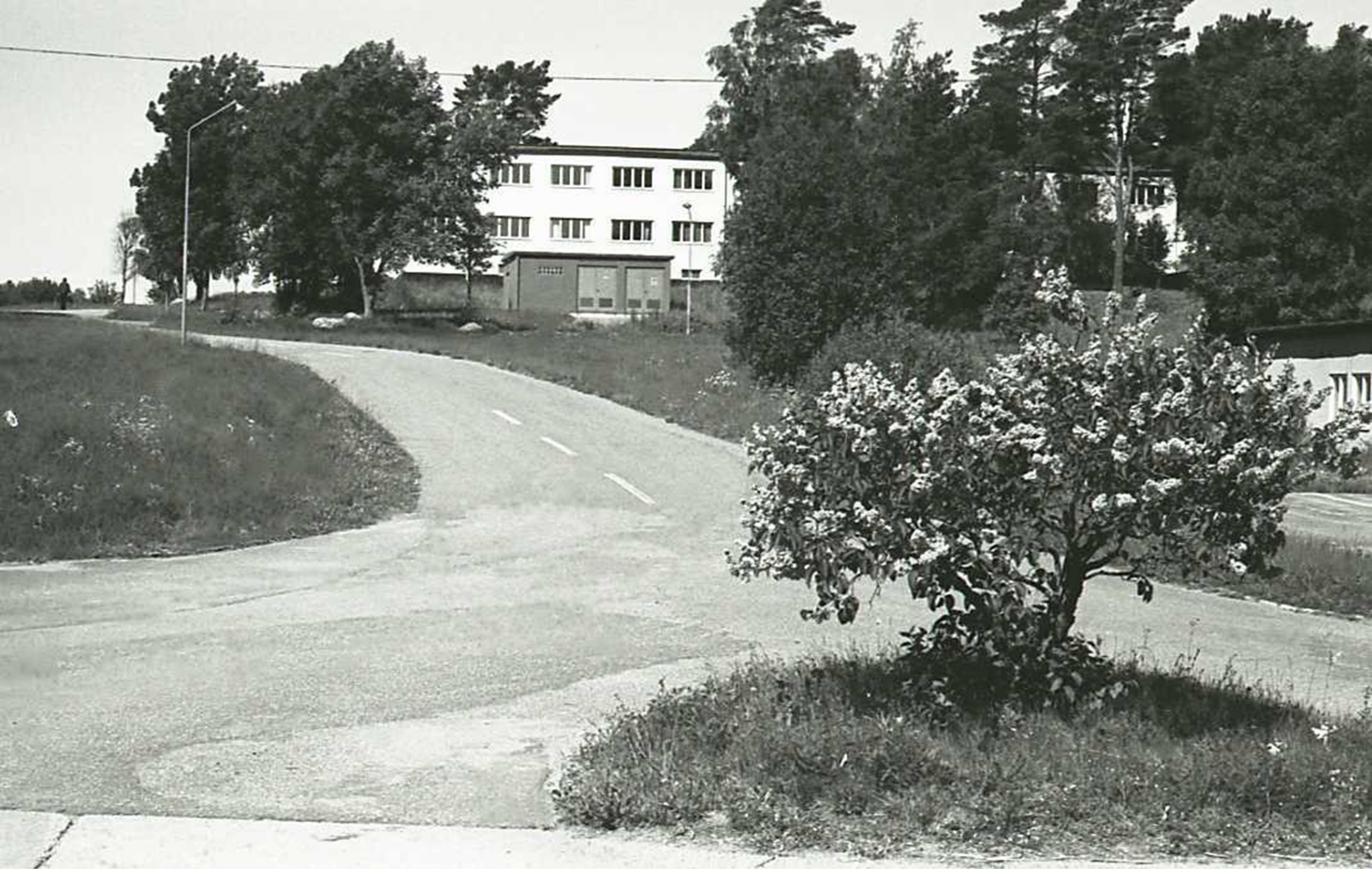
Bild 15. Kasern 21 i bakgrunden.