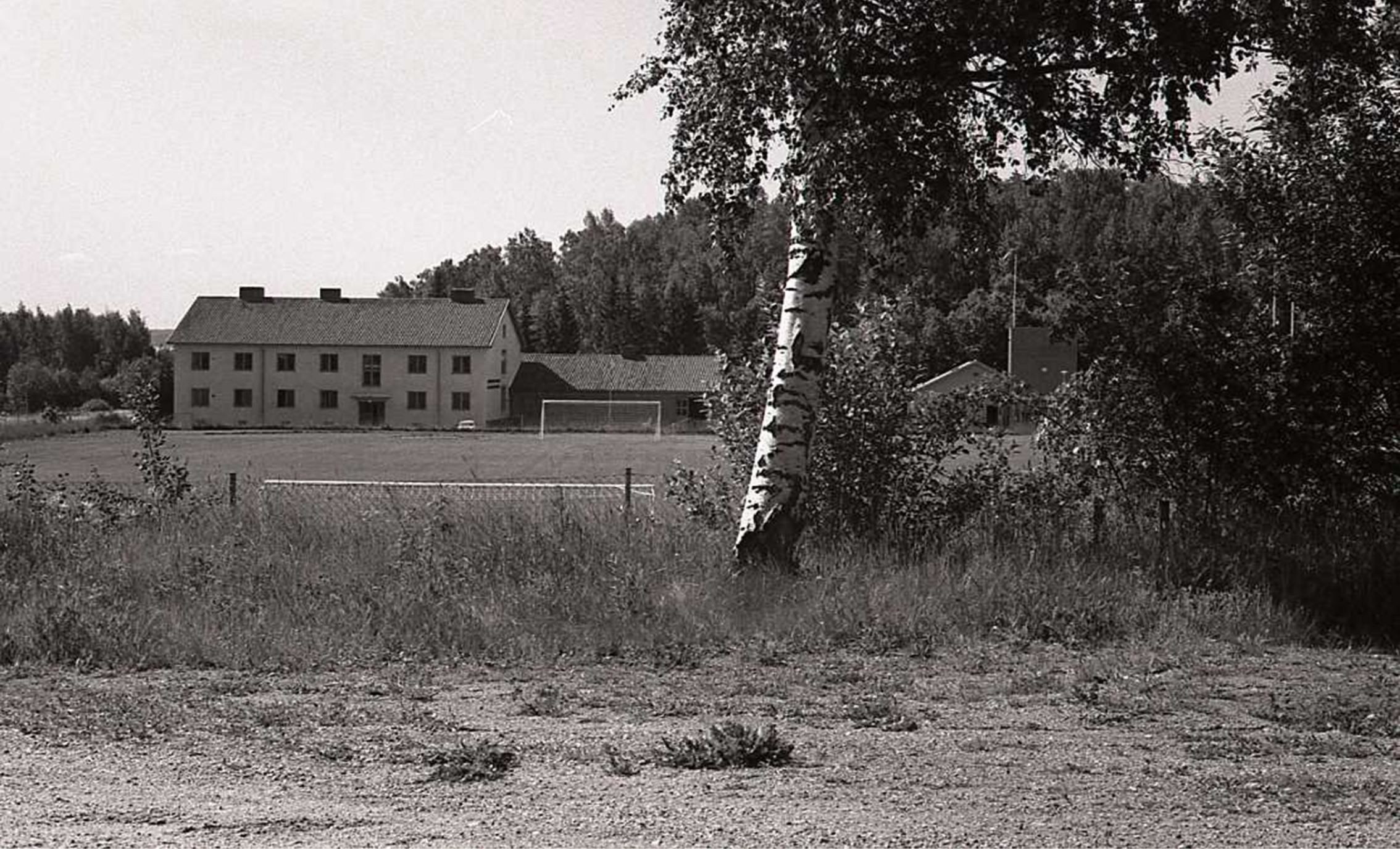
Bild 34. Kasern 8. F2 IP.