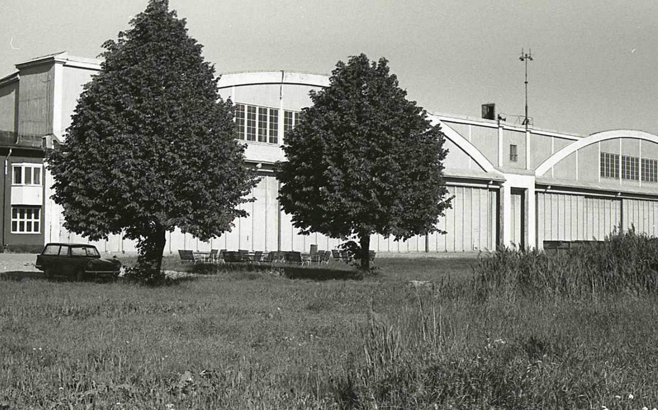
Bild 4. Hangar 81.