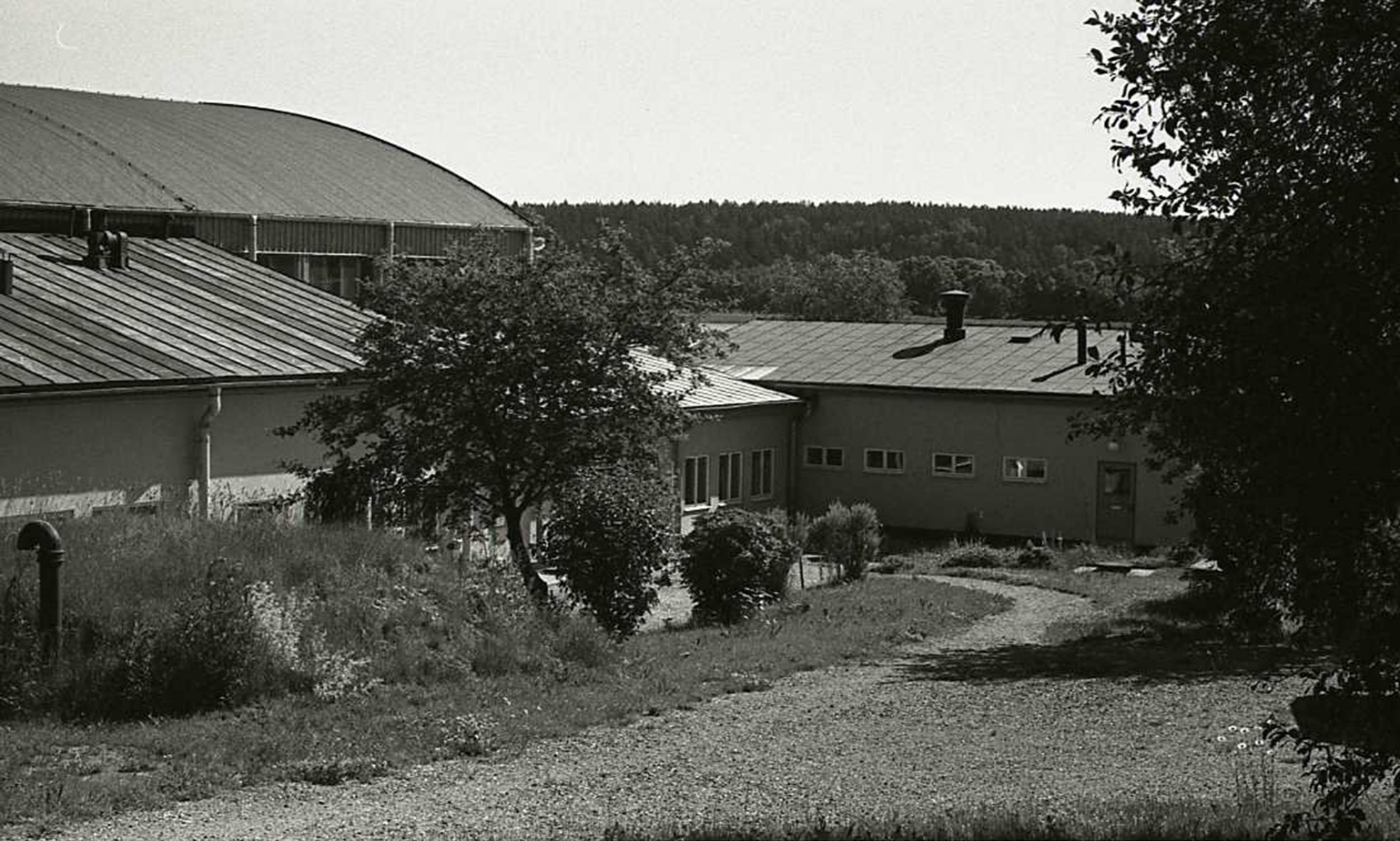
Bild 26. Avd 6 mot öster. Hägernäsviken i bakgrunden