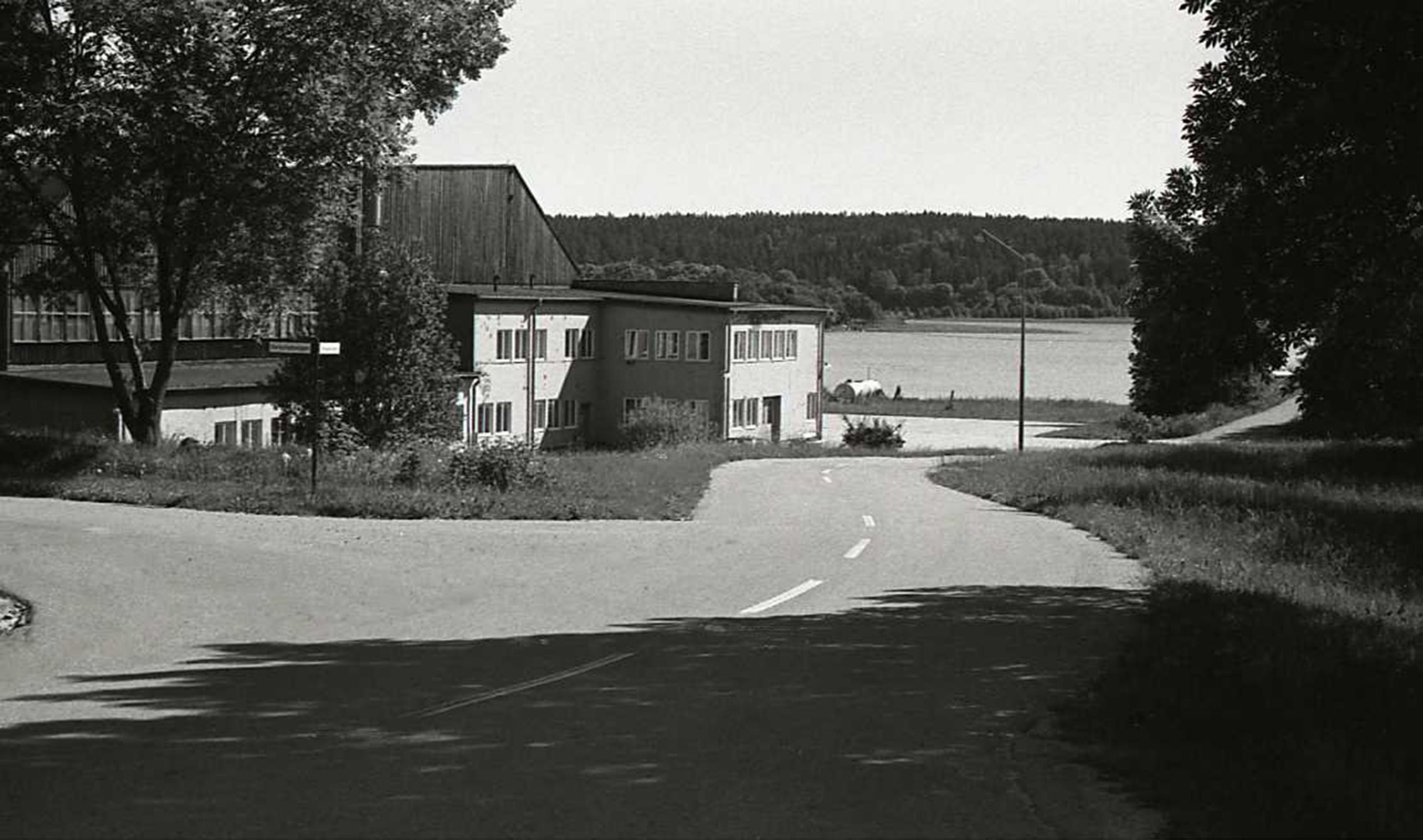
Bild 44. Catalinavägen. Hangar 82 t v.