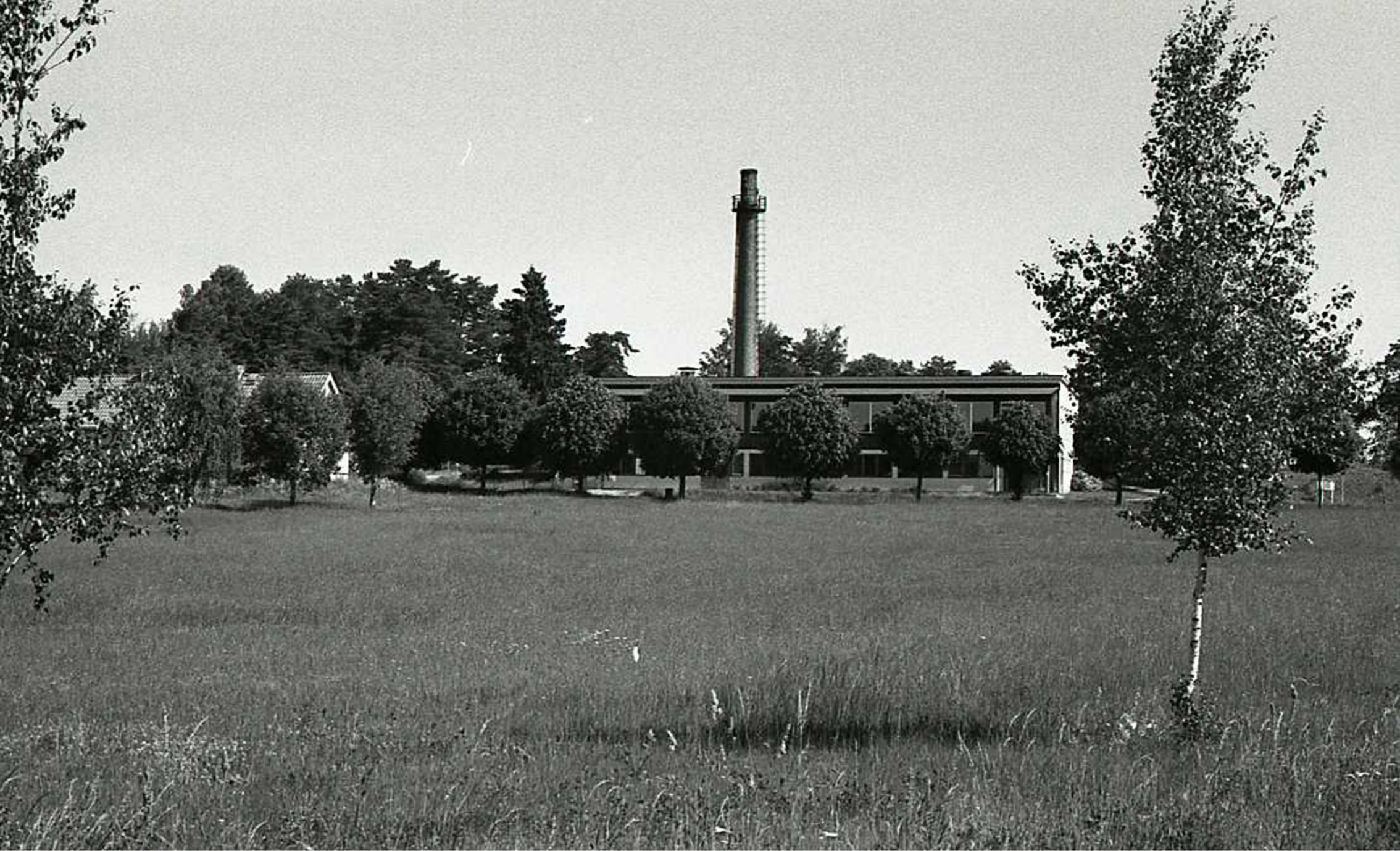
Bild 56. Matsalen Personalbostäder t v.