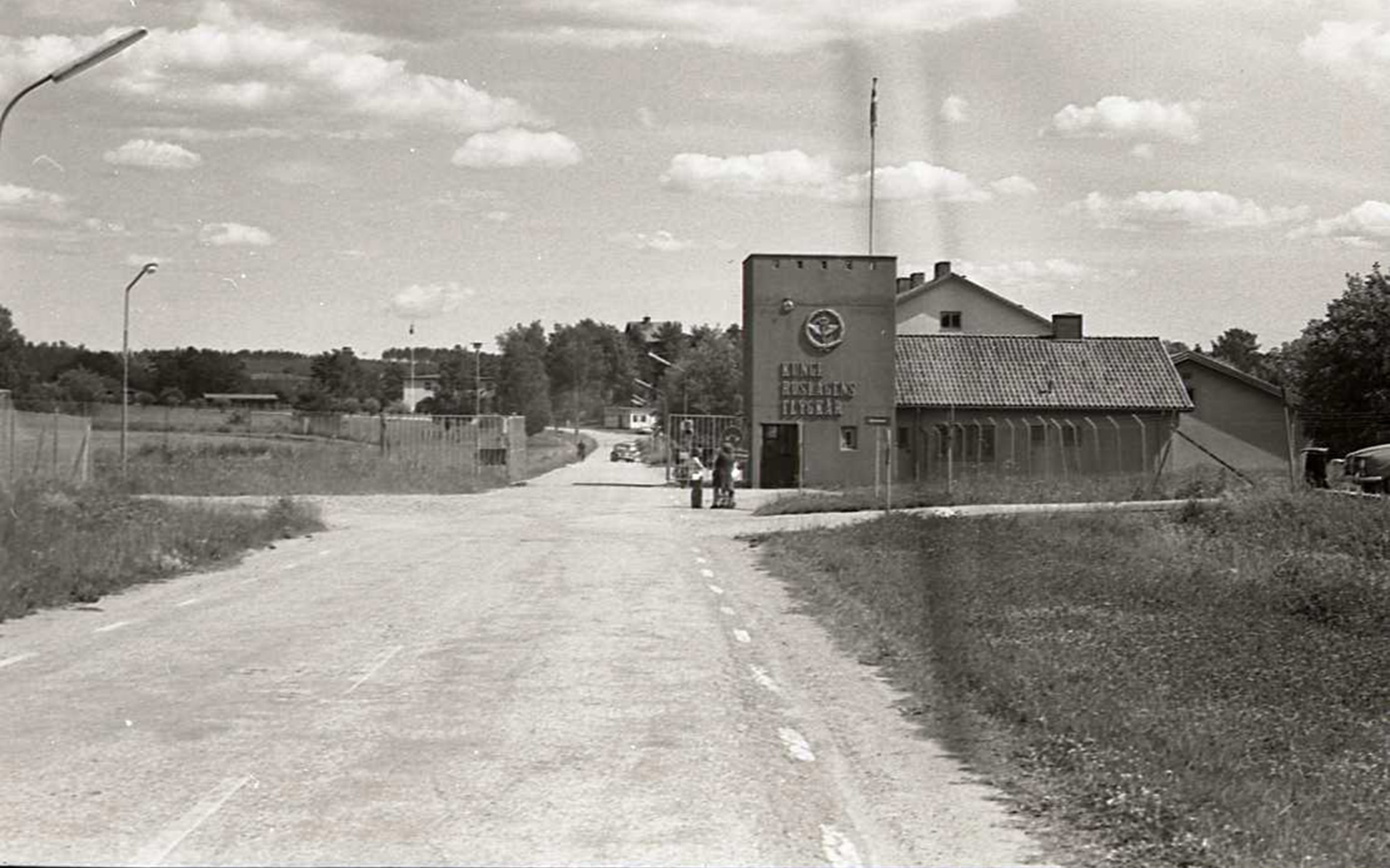
Bild 63. Vakten.