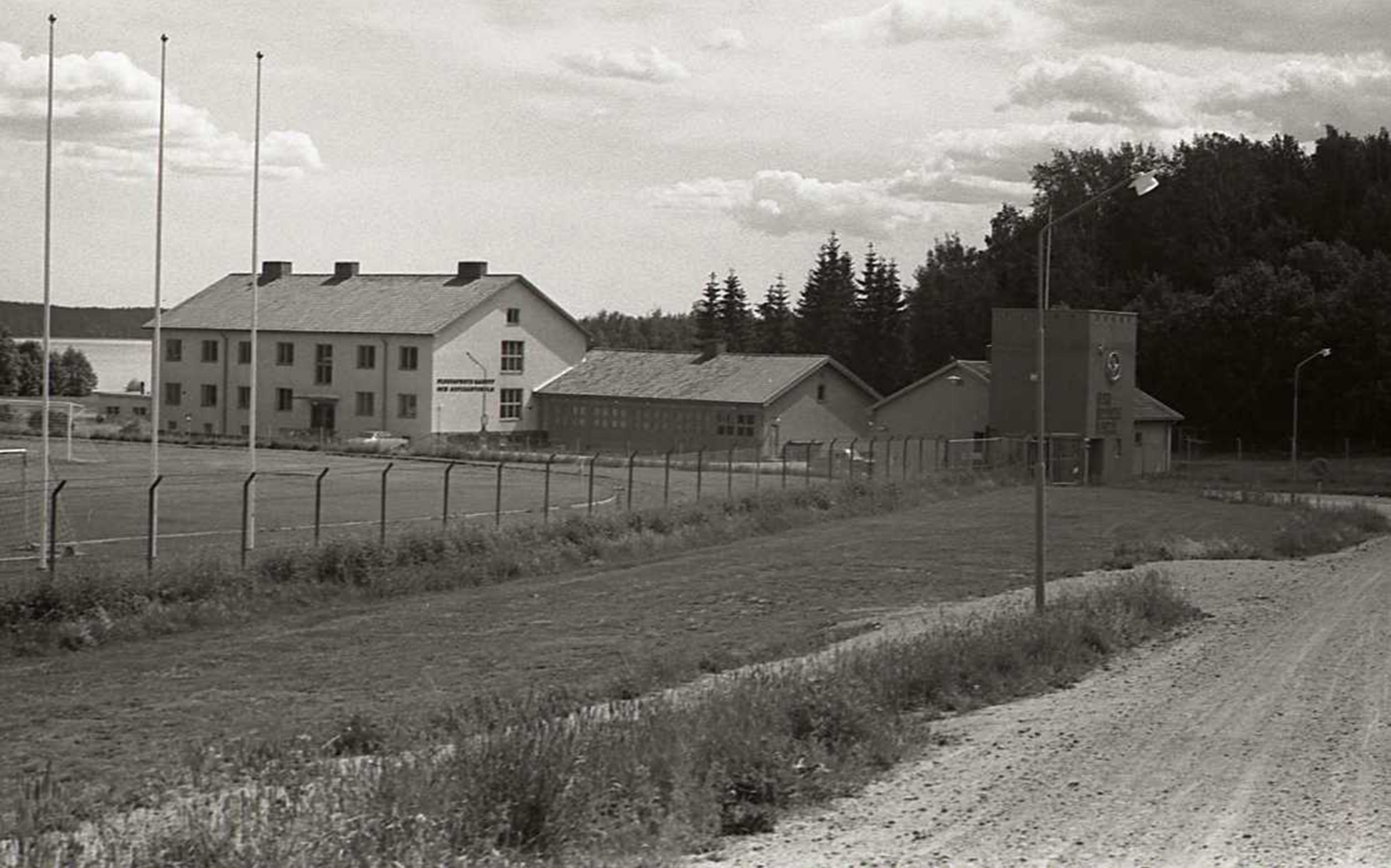
Bild 64. Kasern 8 Brandstationen Vakten.