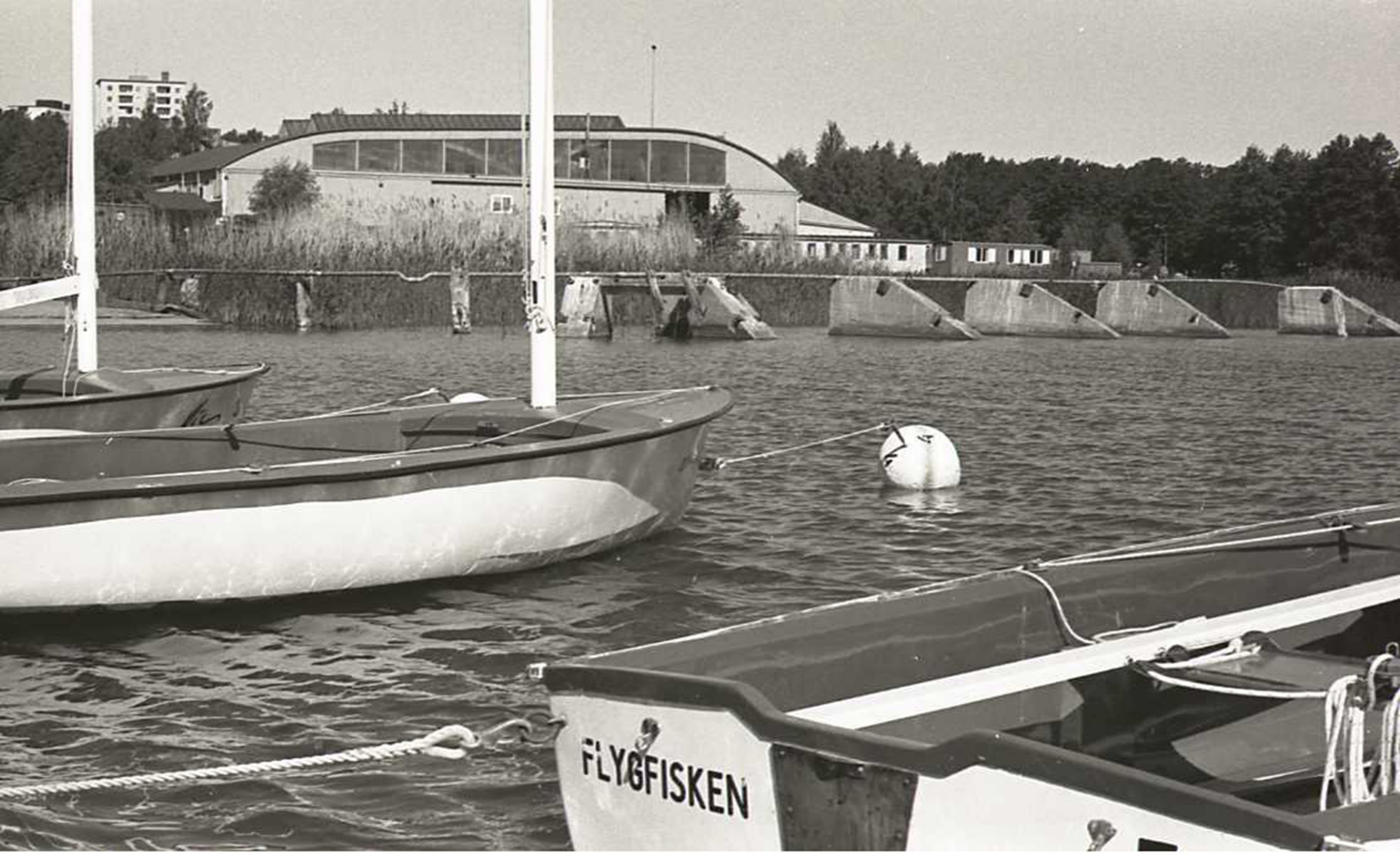
Bild 10. Avd 6. Obsevera takets form som en vingprofil. F2 Trissjollar.